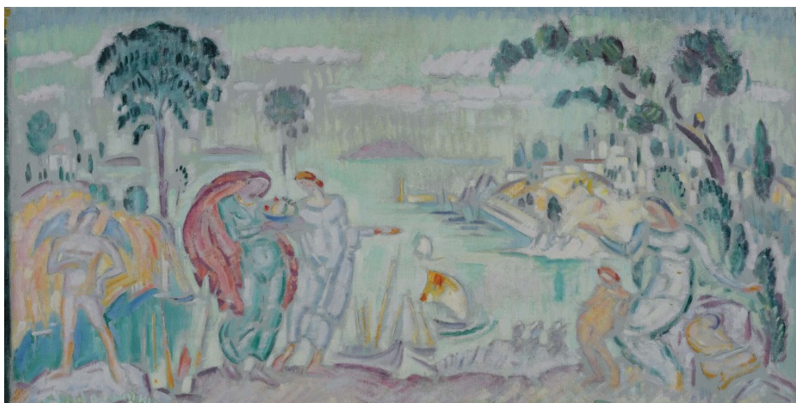
Τα αγαθά της συγκοινωνίας, 1920 - 1925, Λάδι και μολύβι σε καμβά, 34,8 x 69,3 εκ.

Διευθύντρια της Εθνικής Πινακοθήκης, Μαρίνα Λαμπράκη - Πλάκα: «Έλληνας της διασποράς, κοσμοπολίτης εκ καταγωγής και παιδείας, ο Κωνσταντίνος Παρθένης εμφανίστηκε και έλαμψε ως διάττων στο στερέωμα της επαρχιακής ακόμη ελληνικής καλλιτεχνικής σκηνής στην ανατολή του 20ου αιώνα. Γεννημένος στην πολυπολιτισμική Αλεξάνδρεια από μητέρα Ιταλίδα και πατέρα Έλληνα, πολύγλωσσος, με κοσμοπολιτική και βαθειά ελληνική παιδεία, με μουσικές γνώσεις, ο Παρθένης θα ολοκληρώσει την προσωπικότητά του με καλλιτεχνικές σπουδές που συνάδουν απόλυτα με αυτή την καταγωγή: Ρώμη, Βιέννη, Παρίσι, τρία καλλιτεχνικά κέντρα, με διαφορετικούς προσανατολισμούς και άλλη θερμοκρασία στην πνευματική τους ζωή, θα προσθέσουν τις πολύχρωμες ψηφίδες τους, συχνά αντιφατικές, στις κοσμοπολιτικές καταβολές της παιδείας του. Τα στοιχεία αυτά είναι καθοριστικά ερμηνευτικά εφόδια για τον ιστορικό που θα επιχειρήσει να φωτίσει την αινιγματική, μοναχική και πολύτροπη προσωπικότητα του Παρθένη.»