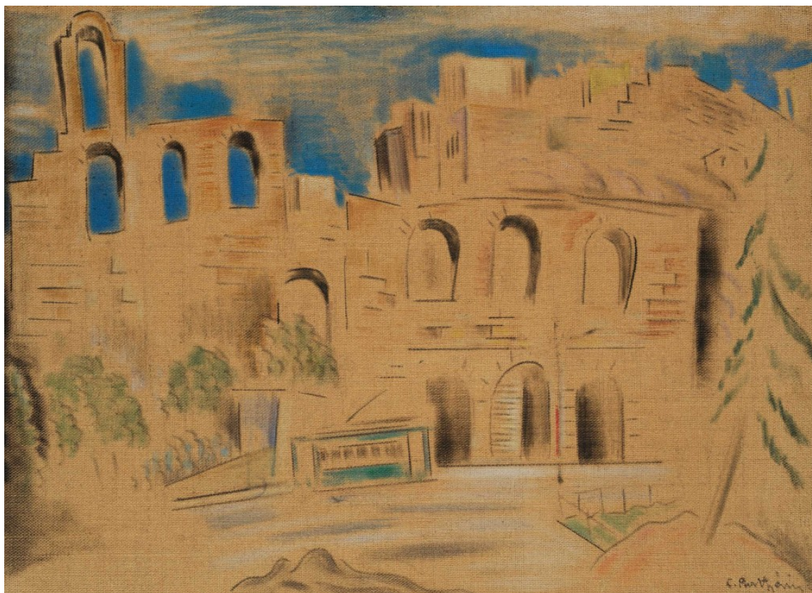
Θέατρο Ηρώδου Αττικού, 1930 - 1938, Λάδι σε καμβά, 47,3 x 70,3 εκ.

διοργανώθηκε αναδρομική έκθεση των έργων του στο πλαίσιο της ελληνικής συμμετοχής στη Μπιενάλε της Βενετίας. Ο ίδιος τιμήθηκε με το παράσημο του Στέμματος της Ιταλίας. Το 1947 παραιτήθηκε από την Ανωτάτη Σχολή Καλών Τεχνών. Ο Παρθένης πέθανε τον Ιούλιο του 1967, ενώ στα αμέσως επόμενα χρόνια σημαντικό μέρος του έργου του πέρασε στην Εθνική Πινακοθήκη. Σήμερα, ο Παρθένης αναγνωρίζεται ως ένας μεγάλος δάσκαλος και ως ο σημαντικότερος Έλληνας ζωγράφος του 20ού αιώνα.