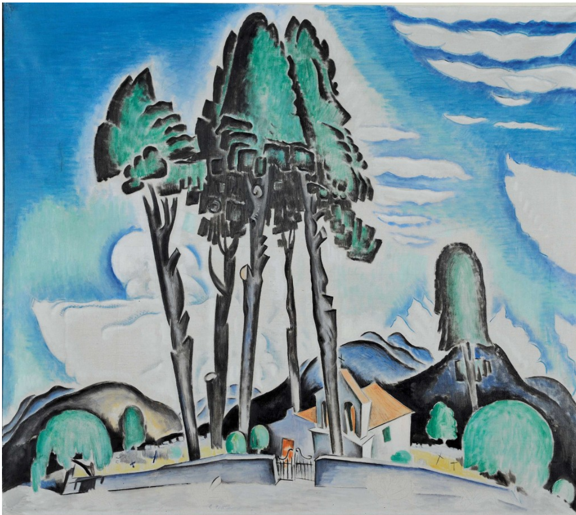
Petite église de Céhalonie, Το μικρό εκκλησάκι της Κεφαλονιάς, 1920 - 1927, Λάδι και μολύβι σε μουσαμά, 115,2 x 130,6 εκ.

Ο Κωνσταντίνος Παρθένης, θεωρείται ως ένας από τους κορυφαίους ζωγράφους των δύο τελευταίων αιώνων του νεώτερου ελληνικού κράτους, που πέτυχε να συγκεράσει τη μορφολογική αντίληψη της μοντέρνας αισθητικής με την νεοελληνική αντίληψη της ζωγραφικής. Η έκθεση παρουσιάζει έργα της εξελικτικής πορείας του κορυφαίου δημιουργού από τις συλλογές της Εθνικής Πινακοθήκης-Μουσείου Αλεξάνδρου Σούτζου (απ' όπου προέρχονται τα έργα, οι φωτογραφίες των οποίων συνοδεύουν αυτό το κείμενο), Εθνικής Τράπεζας, Τράπεζας της Ελλάδος, Δημοτικής Πινακοθήκης του Δήμου Αθηναίων, Υπουργείου Εξωτερικών, Βουλής των Ελλήνων, Ιερού Ναού Αγίου Αλεξάνδρου Παλαιού Φαλήρου και πολλών άλλων ιδιωτικών συλλογών. Ως προς τη θεματολογία της, η έκθεση περιλαμβάνει πορτρέτα, θρησκευτικά, ηθογραφικά, αλληγορικά θέματα, νεκρές φύσεις και τοπία.