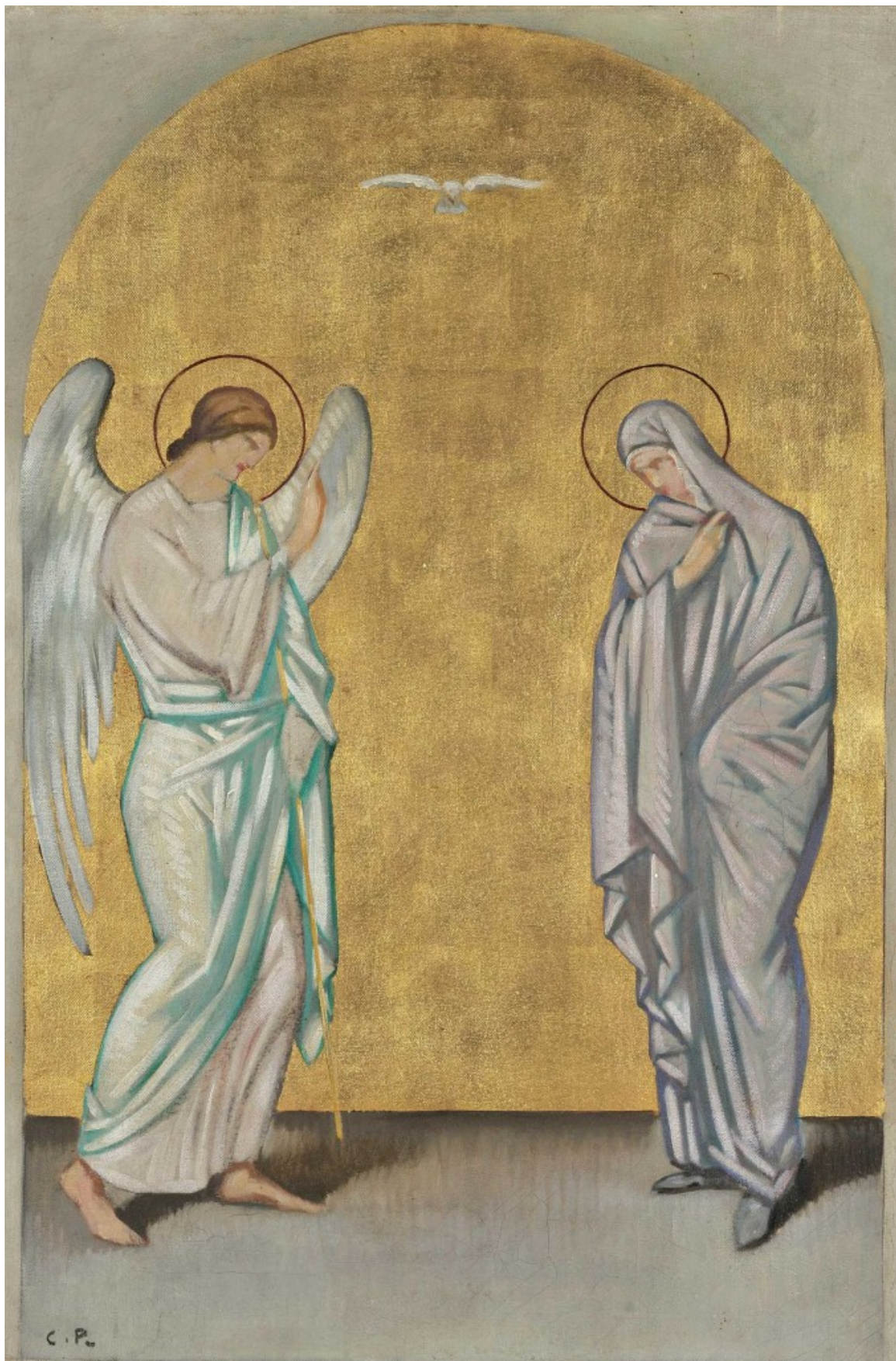
Ευαγγελισμός, 1918 - 1919, λάδι και φύλλα χρυσού σε καμβά, 60 x 40,3 εκ.