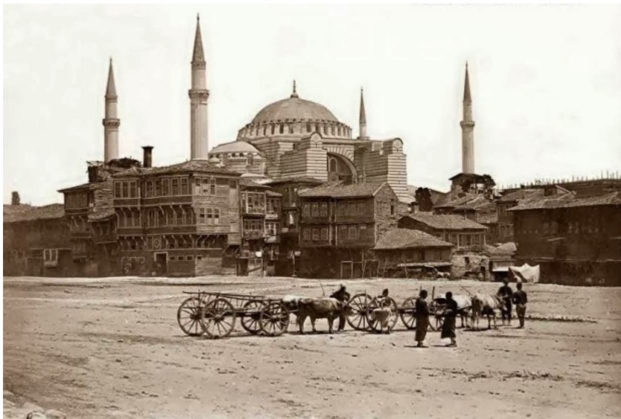
Η Αγία Σοφία σε μια αγνώριστη περιοχή το 1854...