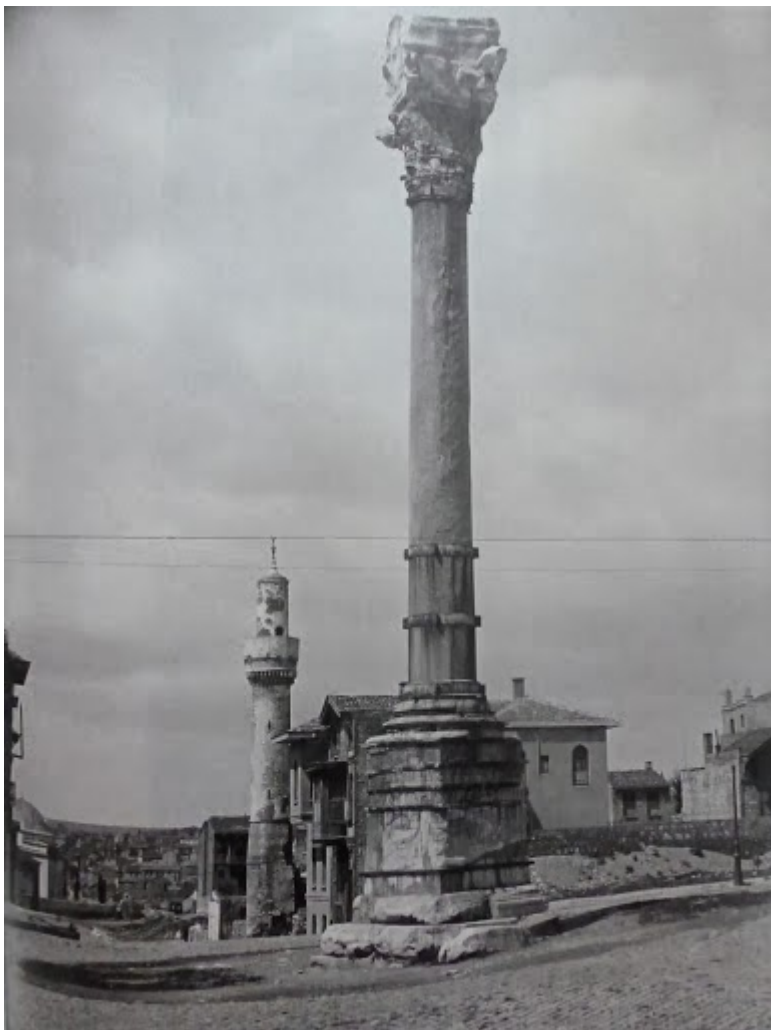
Η στήλη του Μαρκιανού τότε...

μας, φυσικά με την προσθήκη δεκάδων πολυκατοικιών.