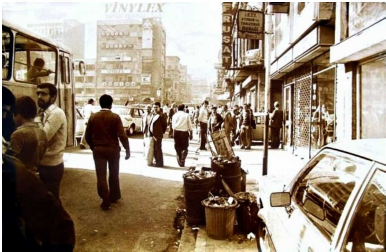
Λεωφορεία περνούσαν έξω από τον σταθμό του Σιρκετζί την δεκαετία του '70