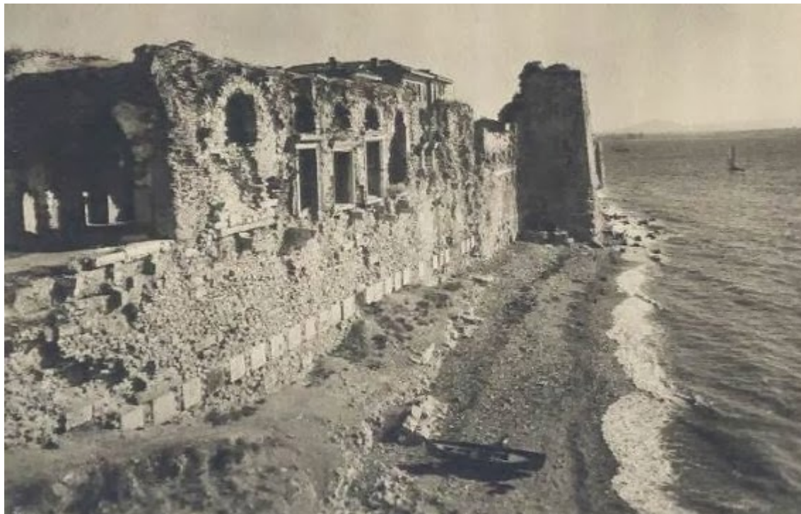
Το παλάτι του Βουκολέοντα βρέχεται από την θάλασσα του Μαρμαρά. Ένα μικρό αμμουδερό ακρογυάλι και μια βαρκούλα. Ειδυλλιακό τοπίο γεμάτο απλότητα και ξεγνοιασιά

αναζητήσεις, για μία ζεστή ματιά, ένα χαμόγελο, ένα αμμουδερό ακρογυάλι...απλότητα, αφέλεια. Μια μικρή στιγμή που συνάμα διαρκεί μια αιωνιότητα. Όπως κάποτε στα θεμέλια του παλατιού του Βουκολέοντα.