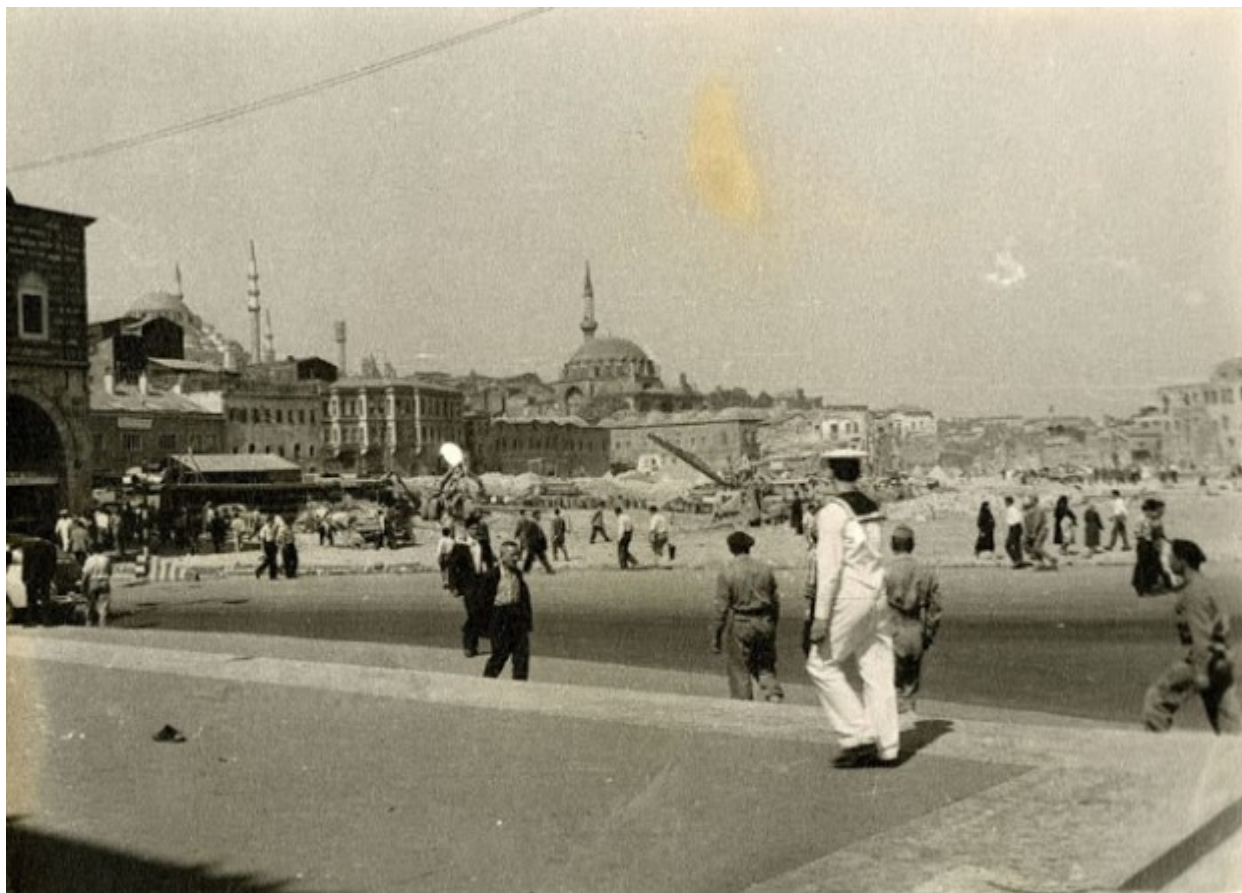
Ένα ναυτάκι ντυμένο στα λευκά κυριαρχεί στην φωτογραφία. Στο κέντρο της φωτογραφίας το τέμενος Ρουστέμ Πασά, δεξιότερα το Σουλειμανιγιέ και η Αιγυπτιακή Αγορά