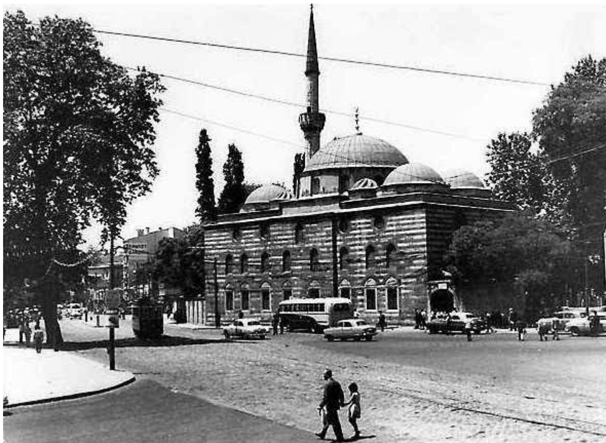
Τότε...πριν περίπου 70 χρόνια..