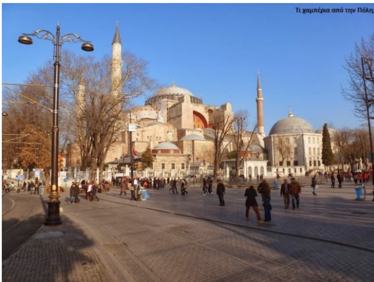
..που στις μέρες μας είναι το τουριστικό κέντρο της Πόλης