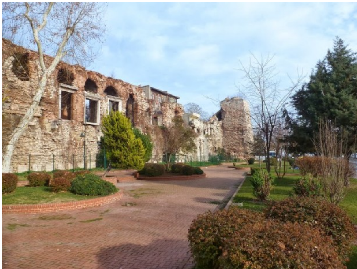
Σήμερα η γη έχει προχωρήσει περίπου 100 μέτρα μέσα στην θάλασσα. Με μικρό πάρκο αλλά και πολλά