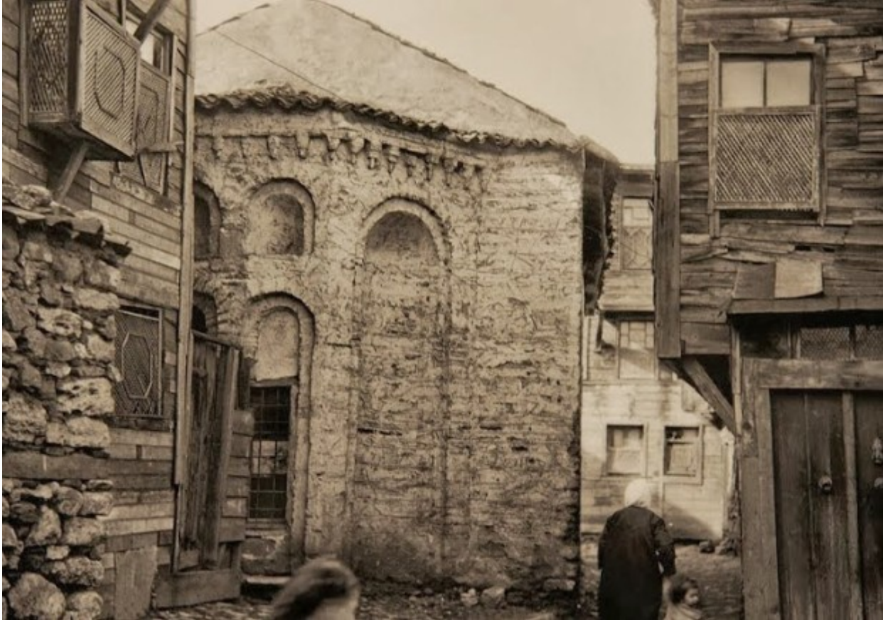
Ο ναός της Αγίας Θέκλας στις Βλαχέρνες...το σημείο αυτό έχει πλέον ισοπεδωθεί

Εκτός από την συνεχή περιπλάνηση στα μήκη και τα πλάτη της Πόλης, την εξερεύνηση και την επαφή με όλες της πτυχές της, μία ακόμη δραστηριότητά μου είναι η διαρκής καταγραφή της στον φωτογραφικό φακό μου. Μέσα από αυτή την διαδικασία επιθυμώ να συγκρίνω τις φωτογραφίες μου με αυτές του παρελθόντος αλλά και να διαφυλλάσω τις τωρινές ως σημείο σύγκρισης με το μέλλον. Εξάλλου η παρούσα εικόνα της Πόλης μεταβάλλεται γοργά.