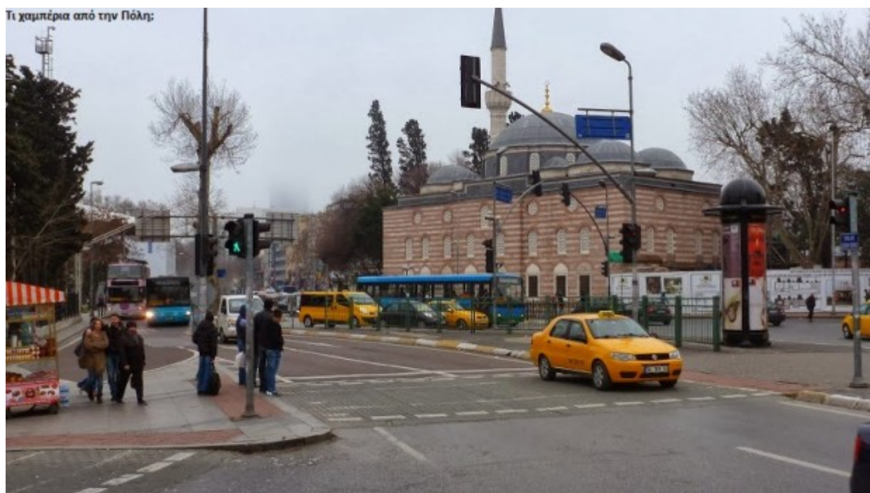
..και τώρα. Σαν να μην πέρασε μια μέρα. Οι διαφορές ελάχιστες

Η παρακάτω φωτογραφία αναμειγνύει την μεταβολή με την διαχρονικότητα. Η στήλη του Μαρκιανού κοσμεί την Πόλη για περισσότερα από 1500 έτη. Η φωτογραφία έχει τραβηχτεί στις αρχές του περασμένου αιώνα αλλά σίγουρα μετά το 1908 καθώς ως τότε η στήλη βρισκονταν σε κήπο αρχοντικού. Μετά από μεγάλη πυρκαγιά το ίδιο έτος ο χώρος πήρε την μορφή που διατηρεί ως τις μέρες