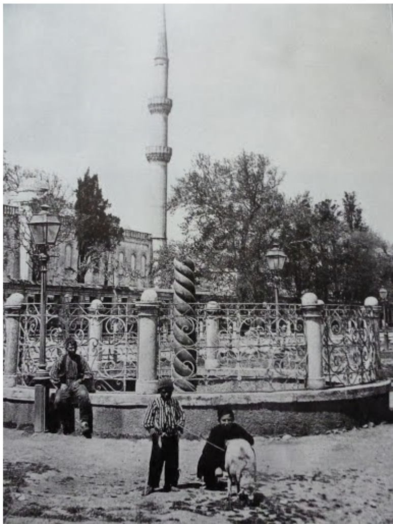
Στην Στήλη των Όφρων με συντροφιά....προβάτου ως κατοικίδιο ζώο