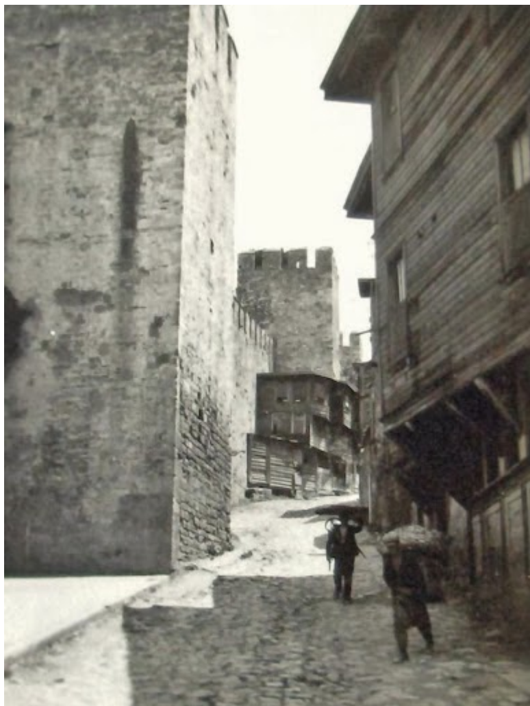
Το τελείωμα του σοκακιού από την άλλη πλευρά. Φωτογραφία του 1929