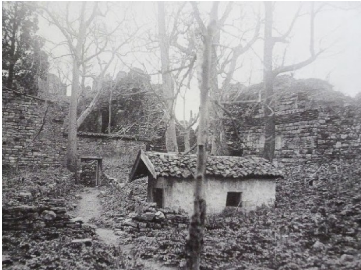
Τότε, το Αγίασμα του Αγίου Βασιλείου. Τοπίο που μοιάζει ερημικό ως στοιχειωμένο

Σε ένα σημείο των Τειχών υπήρχε και το Αγίασμα του Αγίου Βασιλείου. Στην άλλοτε καρδιά του Παλατιού των Βλαχερνών υπάρχουν στις μέρες μας δεκάδες μικρά κτίσματα, εγκαταλελειμμένα όπως τους περασμένους δύο αιώνες. Το μόνο που ίσως έχει αλλάξει είναι το γεγονός ότι τα σημεία γύρω από τα Τείχη έχουν οικιοποιηθεί από ανθρώπους. Για αυτό τον λόγο δεν κατόρθωσα να έχω την ίδια οπτική γωνία με την φωτογραφία του περασμένου αιώνα.