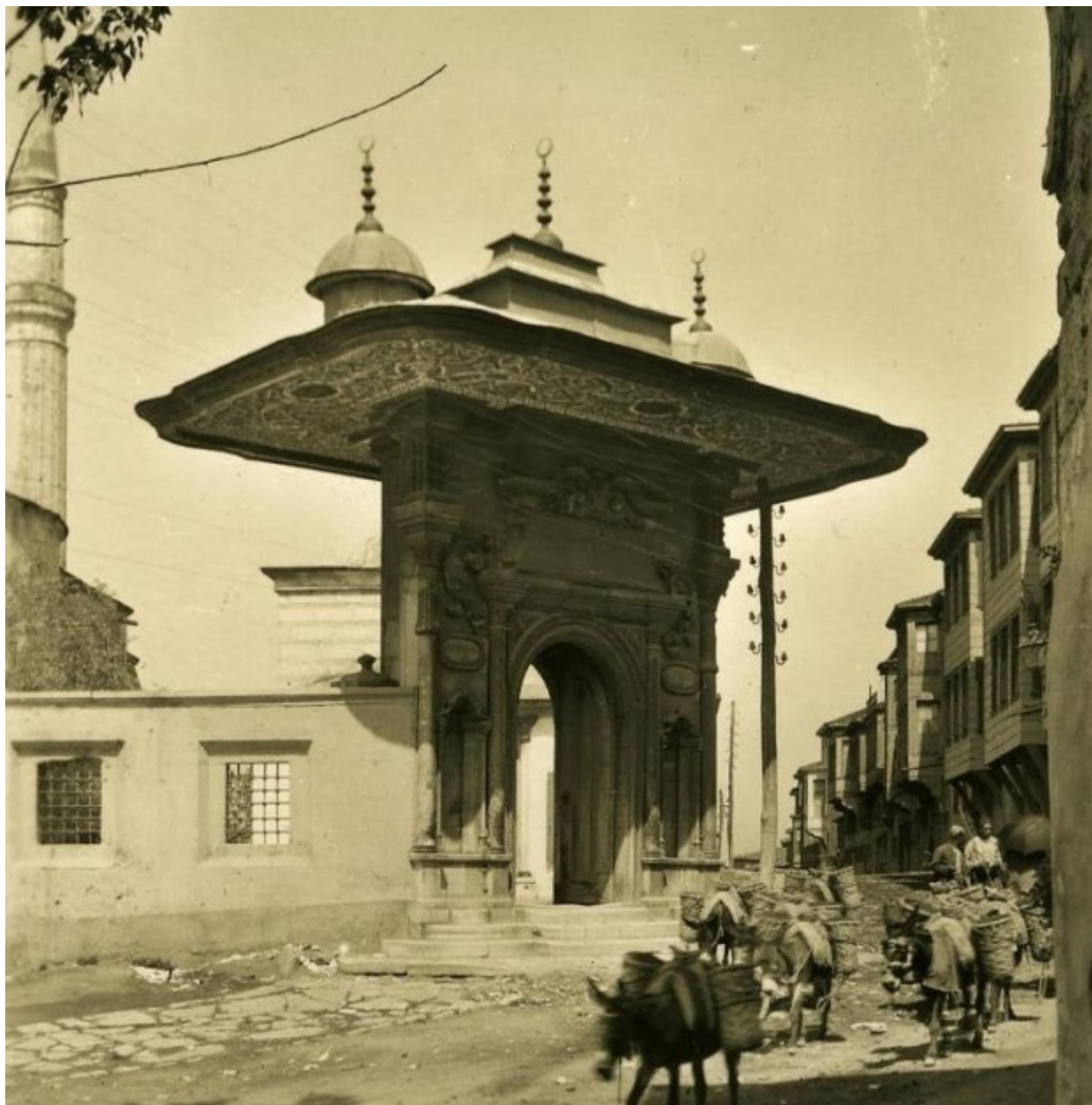
Το σοκάκι Soğuk Çesme στην βόρεια πλευρά της Αγίας Σοφίας. Χωμάτινοι δρόμοι και γαιδουράκια