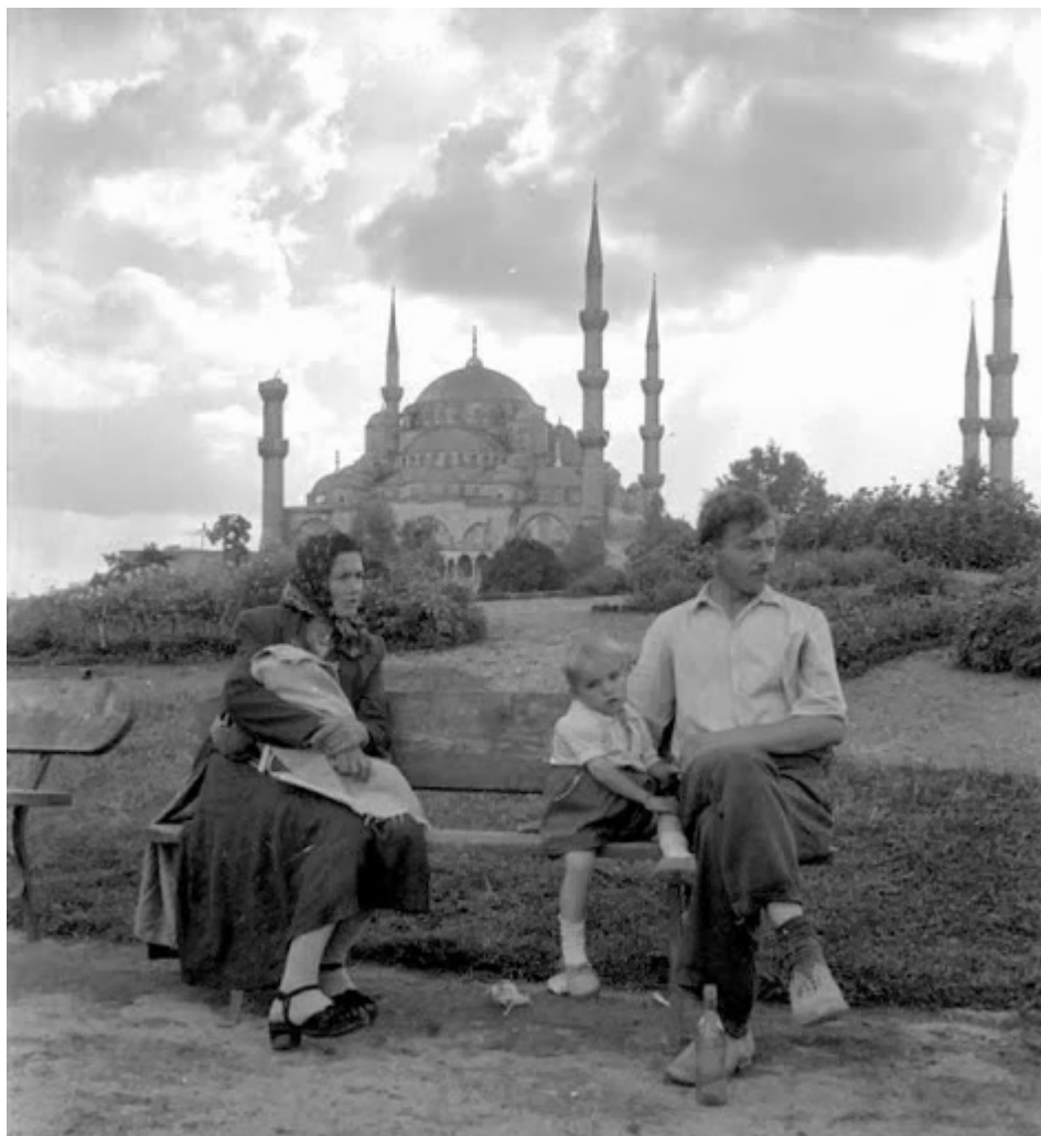
Και από την απέναντι πλευρά το Μπλέ Τζαμί. Η περιοχή παρέμενε ήρεμη μέχρι πριν κάμποσες δεκαετίες..