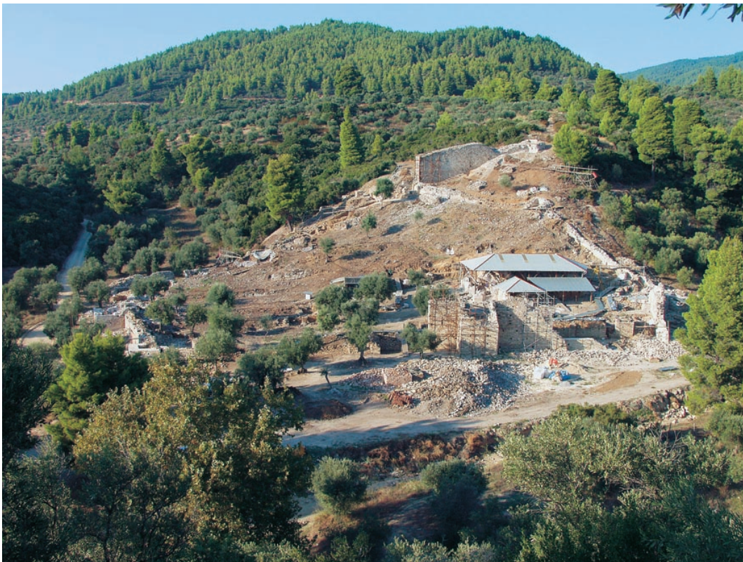
Γενική άποψη της ανασκαφής

Τα ερείπια της άλλοτε αγιορειτικής Μονής του Ζυγού διακρίνονταν χρόνια ανάμεσα στην πυκνή δασική βλάστηση και ήταν γνωστά με το όνομα «Φραγκόκαστρο». Βρίσκονται στην περιοχή της σημερινής Ουρανοπόλεως Χαλκιδικής, περί τα σαράντα μέτρα εντεύθεν της οριογραμμής του Αγίου Όρους. Ο πρώτος γνωστός επισκέπτης του χώρου, με αρχαιολογικά ενδιαφέροντα, ήταν ο πολυγραφώτατος ρώσος αρχιμανδρίτης και ερευνητής Πορφύριος Ουσπένσκυ, το 1858.