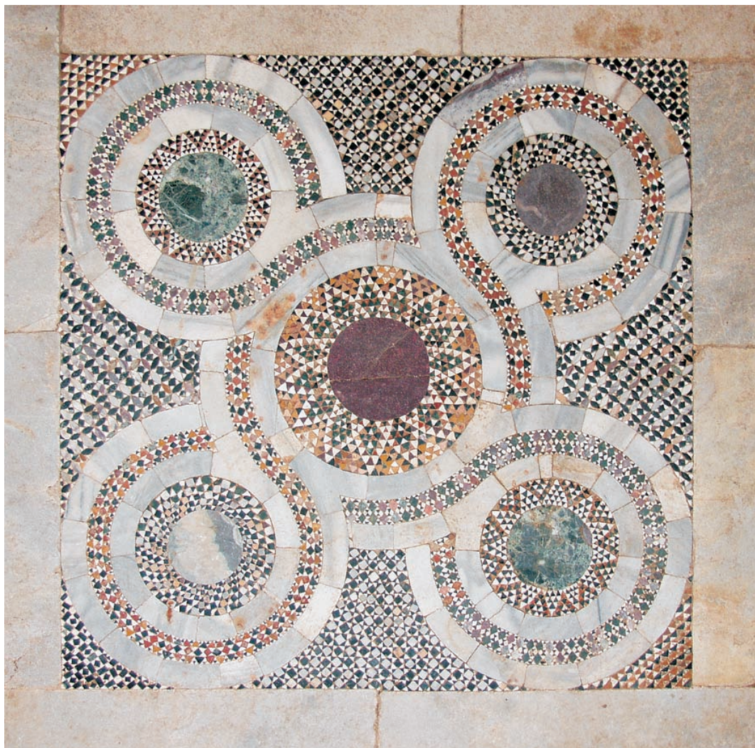
Το μαρμαροθέτημα του δαπέδου του βορείου παρεκκλησίου

Γύρω στο 1206, φαίνεται ότι εγκαταστάθηκε στο κάστρο του Ζυγού ένας Φράγκος άρχοντας με τους στρατιώτες του, ο οποίος εξορμούσε από εκεί και λεηλατούσε το Άγιον Όρος, ώσπου, περί το 1211, με παρέμβαση του Πάπα της Ρώμης εκδιώχθηκε από την περιοχή. Γι' αυτόν τον λόγο τα ερείπια της Μονής είναι γνωστά σήμερα ως «Φραγκόκαστρο».