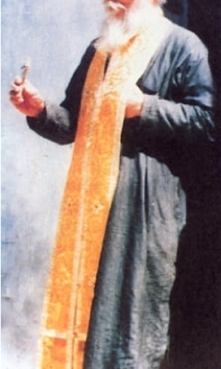
«Τελείωσις εν ασθενεία»

Σιγά-σιγά η υγεία του καμπτόταν και η όρασή του χάθηκε, ενώ τα τρία τελευταία χρόνια της ζωής του το μέγεθος της οδύνης και του συνεχούς άλγους τον έκαιγε σαν καμίνι φοβερό. Παρουσιάστηκε πρόβλημα στον προστάτη και εισήχθη στο νοσοκομείο. Επί μια εβδομάδα έβγαζε αίμα και πονούσε φοβερά χωρίς όμως να το δείχνει καθόλου. Εξομολογούσε μάλιστα και διάφορα πνευματικά του παιδιά που έρχονταν γι' αυτόν τον λόγο. Στην συνέχεια χειρουργήθηκε από σκωληκοειδίτιδα