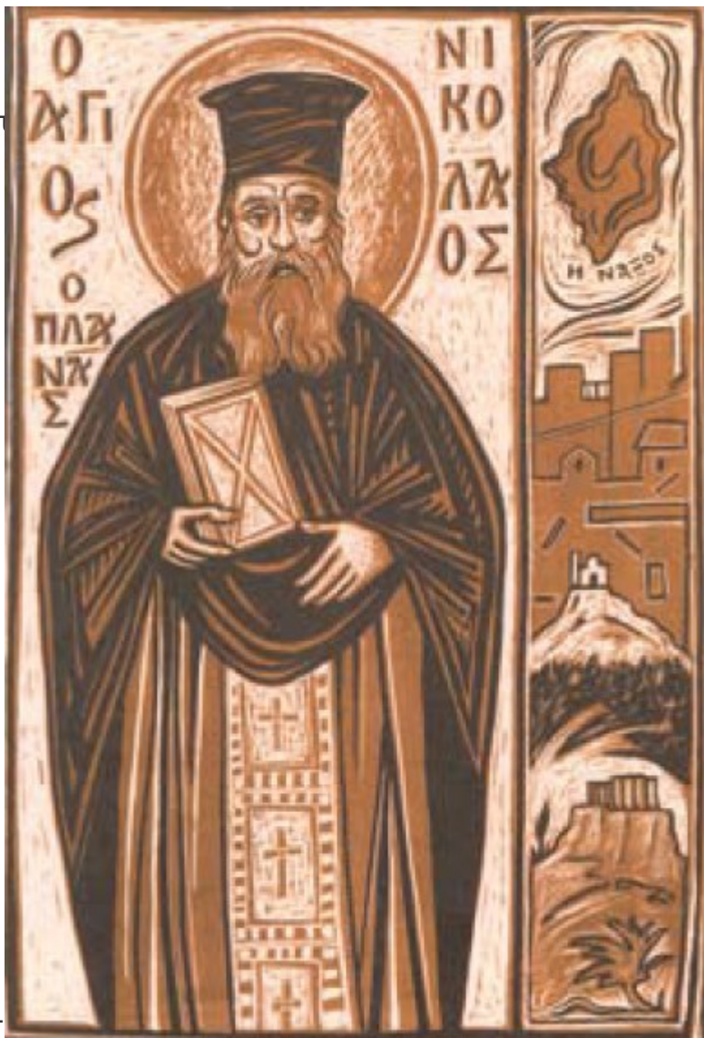
Ο ΑΓΙΟΣ ΝΙΚΟΛΑΟΣ ΠΛΑΝΑΣ

Ο Νικόλαος γεννήθηκε το 1851 στη Νάξο, διδάχτηκε τα πρώτα γράμματα από τον ιερέα παππού του, τον οποίο και συνόδευε στις Λειτουργίες και τους Εσπερινούς, βοηθώντας τον στο Ιερό και το ψαλτήρι.