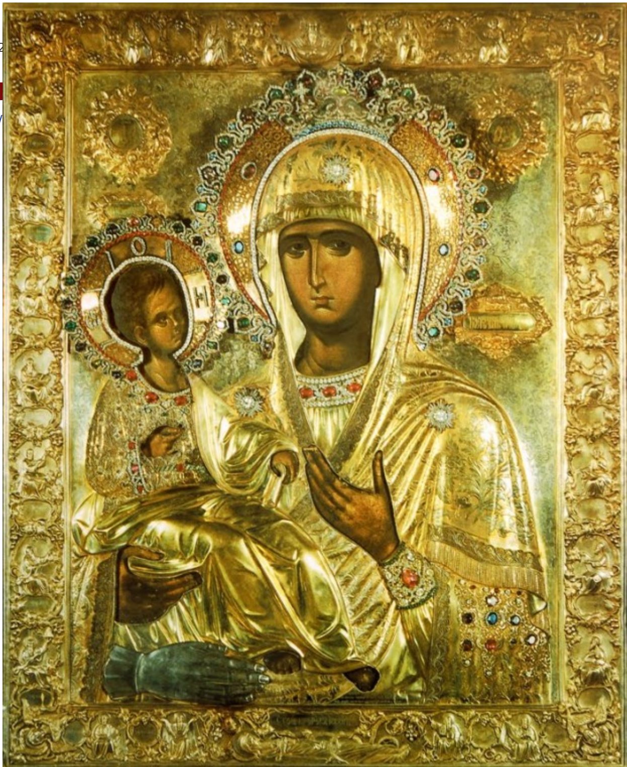
Παναγία η Τριχερούσα