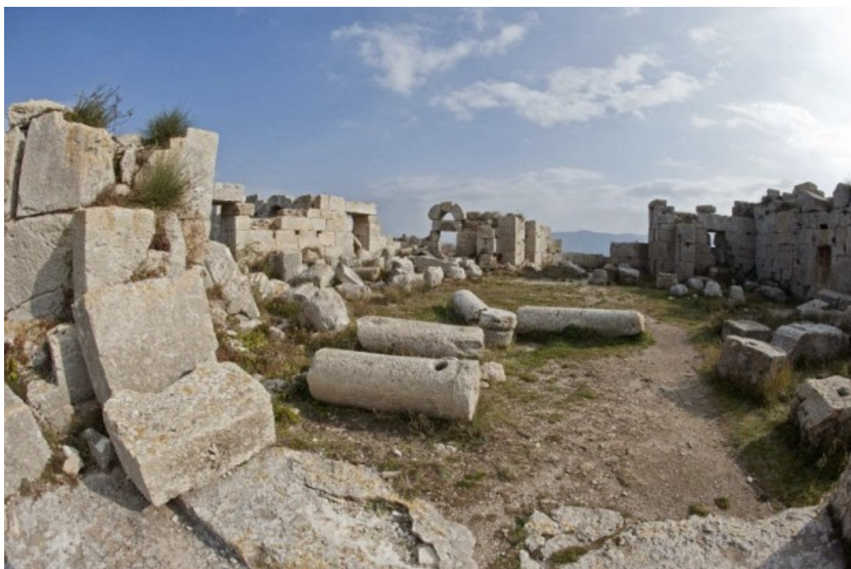
Τα ερείπια των λίθινων κτιρίων και εκκλησιών που είχαν χτιστεί γύρω από την κολώνα που ασκήτευσε ο Όσιος Συμεών ο Θαυμαστορείτης.

Το 1177 ο μοναχός Ιωάννης Φωκάς σε προσκυνηματική του ιεραποδημία στη Συροπαλαιστίνη περιγράφει «εν συνόψει τον απ' Αντιοχείας μέχρις Ιεροσολύμων κάστρων και χωρών Συρίας, Φοινίκης και των κατά Παλαιστίνη Αγίων Τόπων