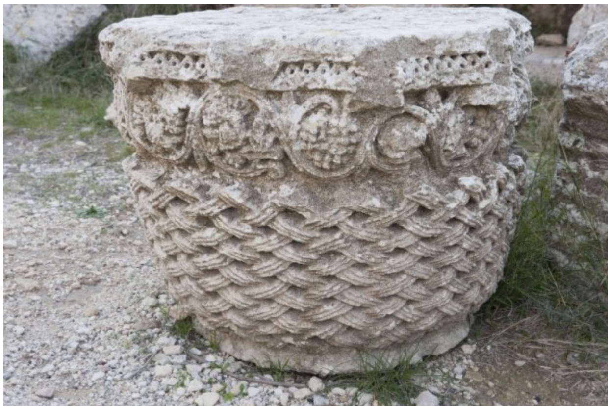
Βυζαντινό κιονόκρανο στον χώρο που ασκήτευσε ο Όσιος Συμεών ο Θαυμαστορείτης.