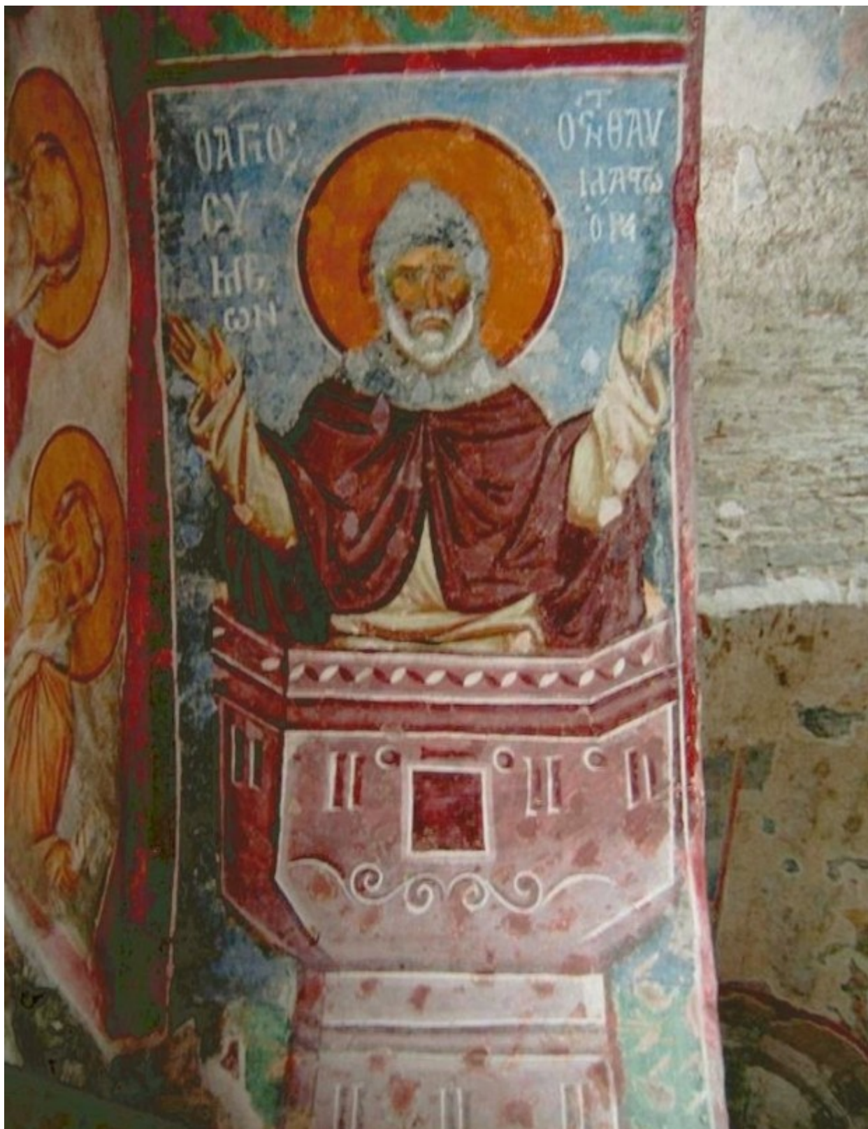
Ο Όσιος Συμεών ο Θαυμαστορείτης. Τοιχογραφία στην Αγία Σοφία Τραπεζούντας Πόντου.

Τον βίο του συνέταξε ο μαθητής του και κατοπινός επίσκοπος Κύπρου Αρκάδιος και ο Νικηφόρος Ουρανός. Πέθανε σε ηλικία εβδομήντα πέντε ετών το 596. Η κάρα του φυλάσσεται στην Ιερά Μονή Νεάμτς (Mănăstirea Neamț) της Ρουμανίας. Η κτητορική επιγραφή στην κορώνα στην οποία είναι τοποθετημένη η κάρα είναι του