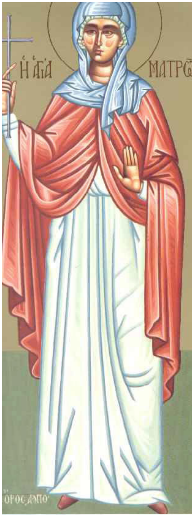
Αγία Ματρώνα η εν Θεσσαλονίκη