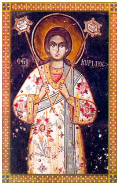
Άγιος Κύριλλος ο διάκονος