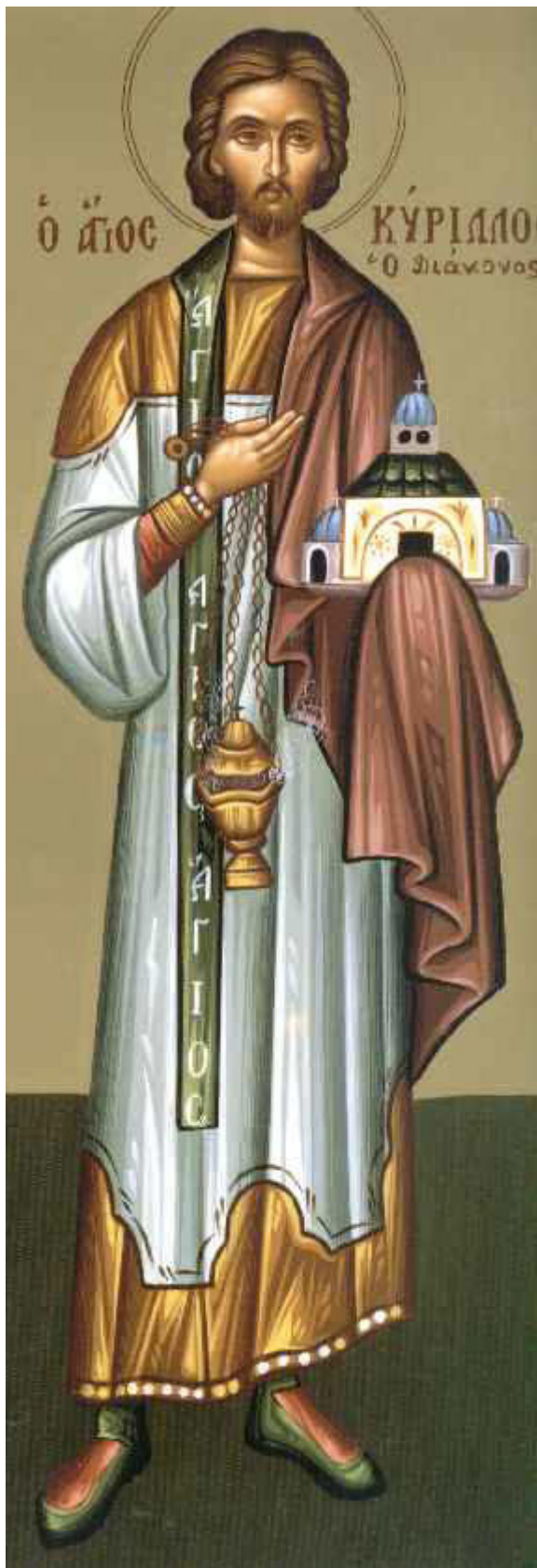
Άγιος Κύριλλος ο διάκονος