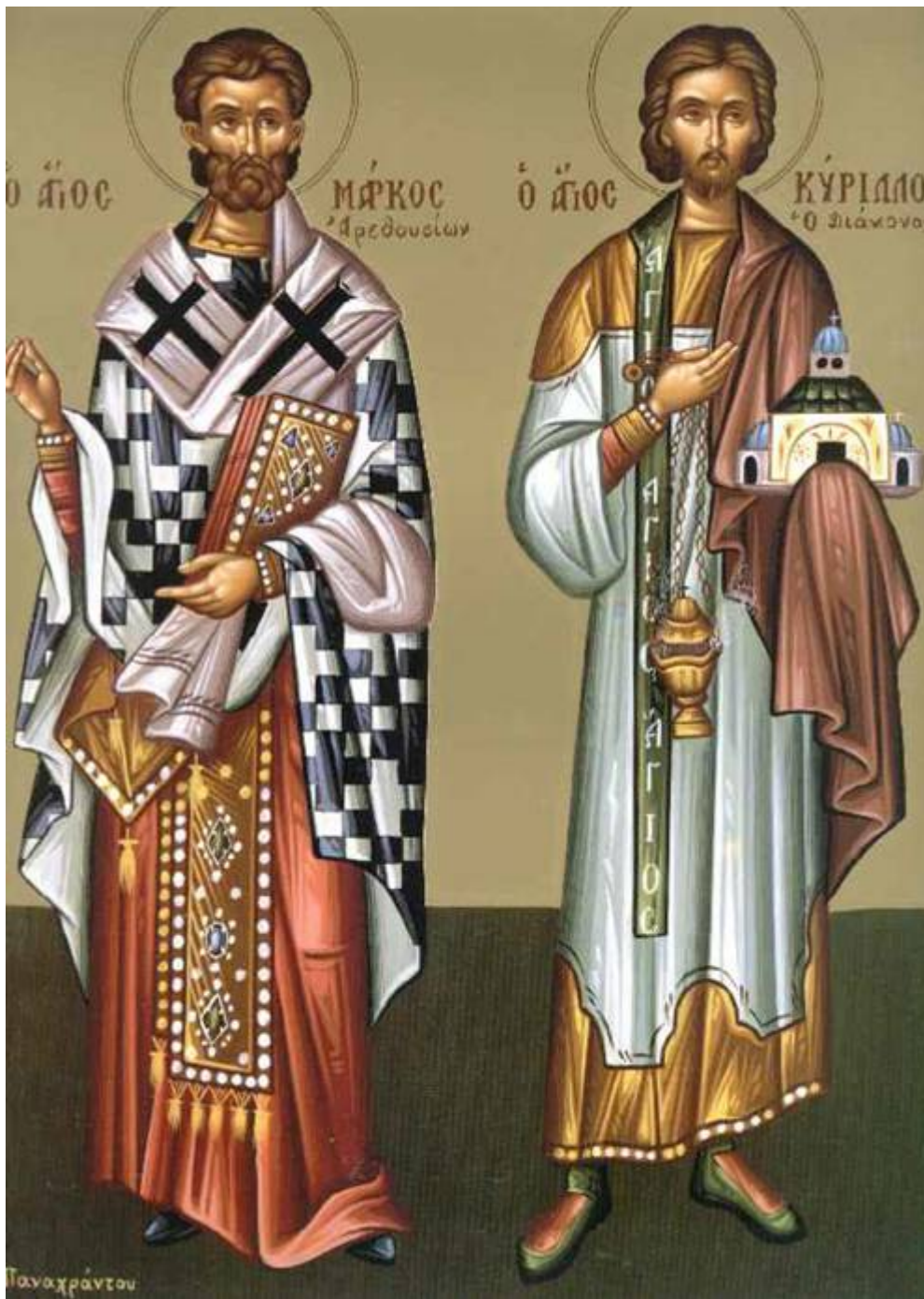
Άγιος Μάρκος επίσκοπος Αρεθουσίων, Κύριλλος διάκονος