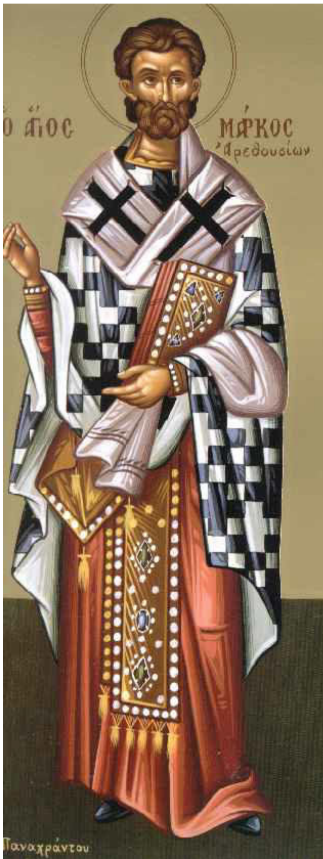
Άγιος Μάρκος επίσκοπος Αρεθουσίαν