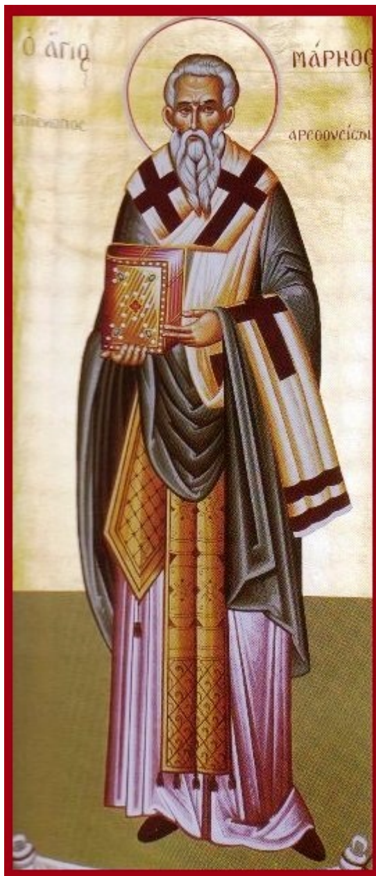
Άγιος Μάρκος επίσκοπος Αρεθουσίων