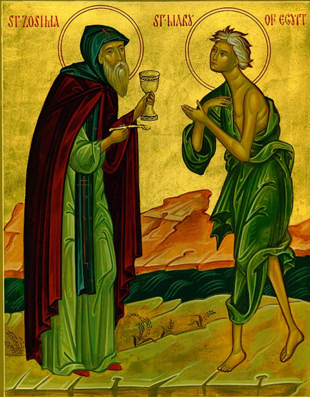
Οσία Μαρία η Αιγυπτία και Όσιος Ζωσιμάς