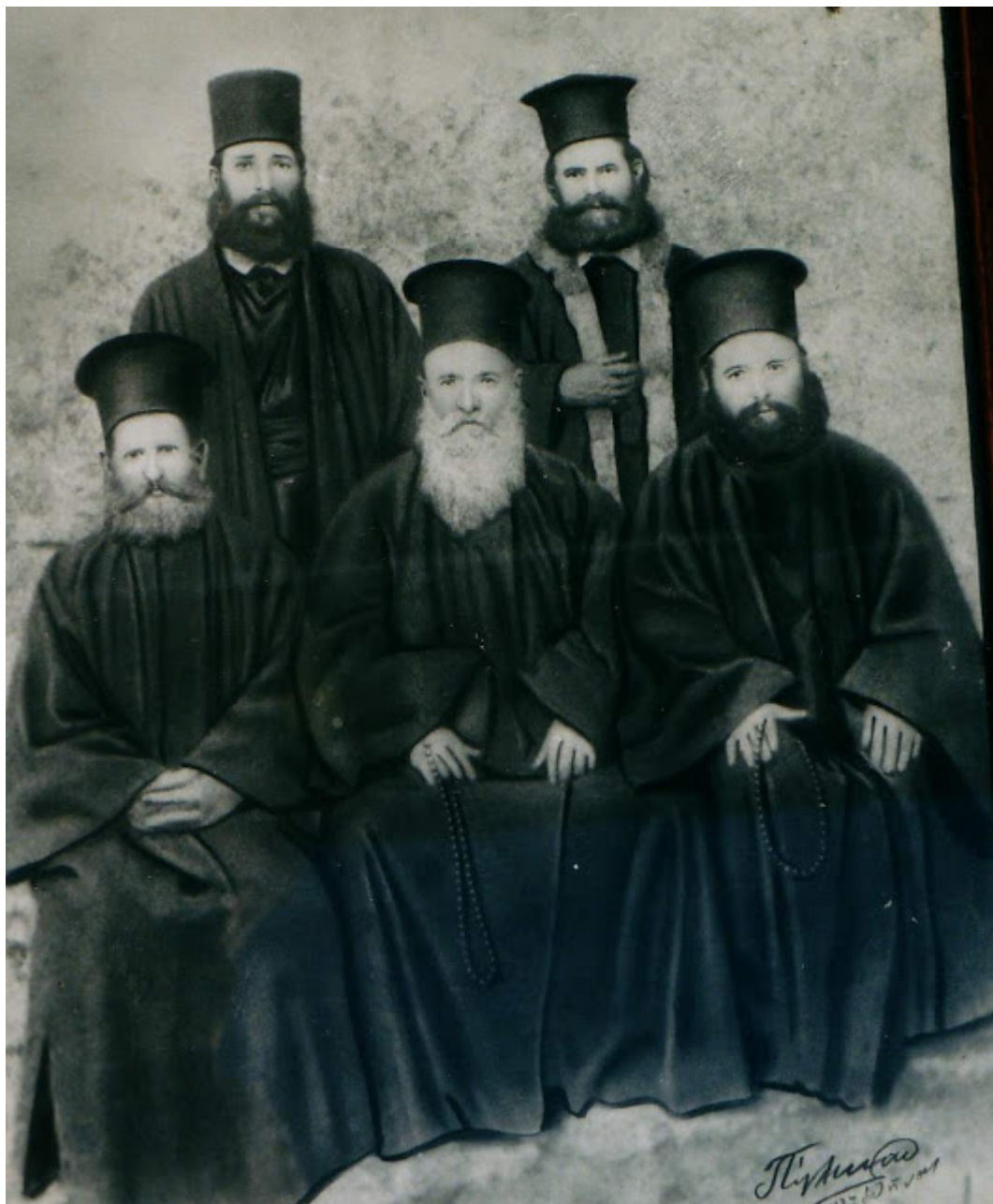
Καλόγεροι Βουλκάνου