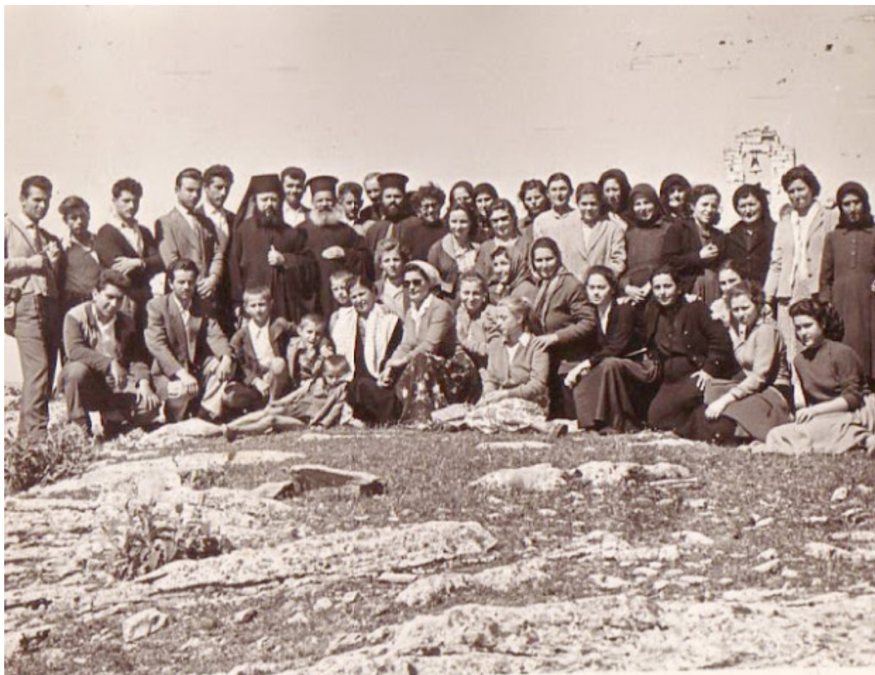
Προσκύνημα στην Παναγία του Βουλκάνου, 15 Αύγουστο