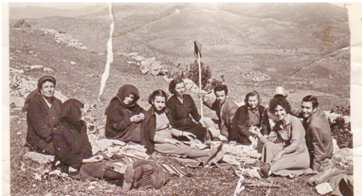
Μακρής-Προσκύνημα στην Παναγία του Βουλκάνου, 15 Αύγουστο - Φώτο:αρχείο του Γιάννη Λύρα