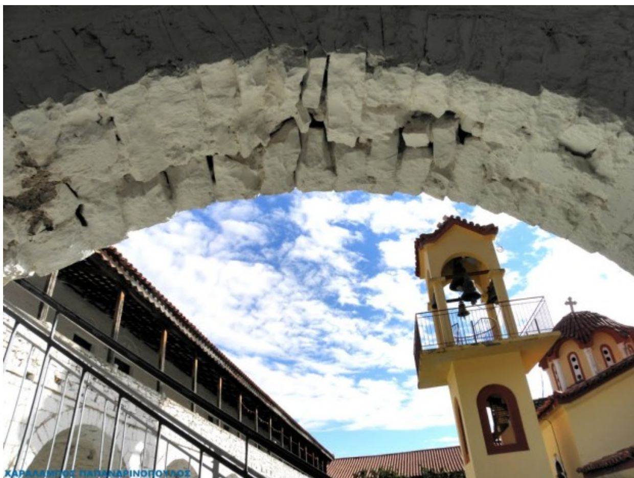
Παναγία του Βουλκάνου