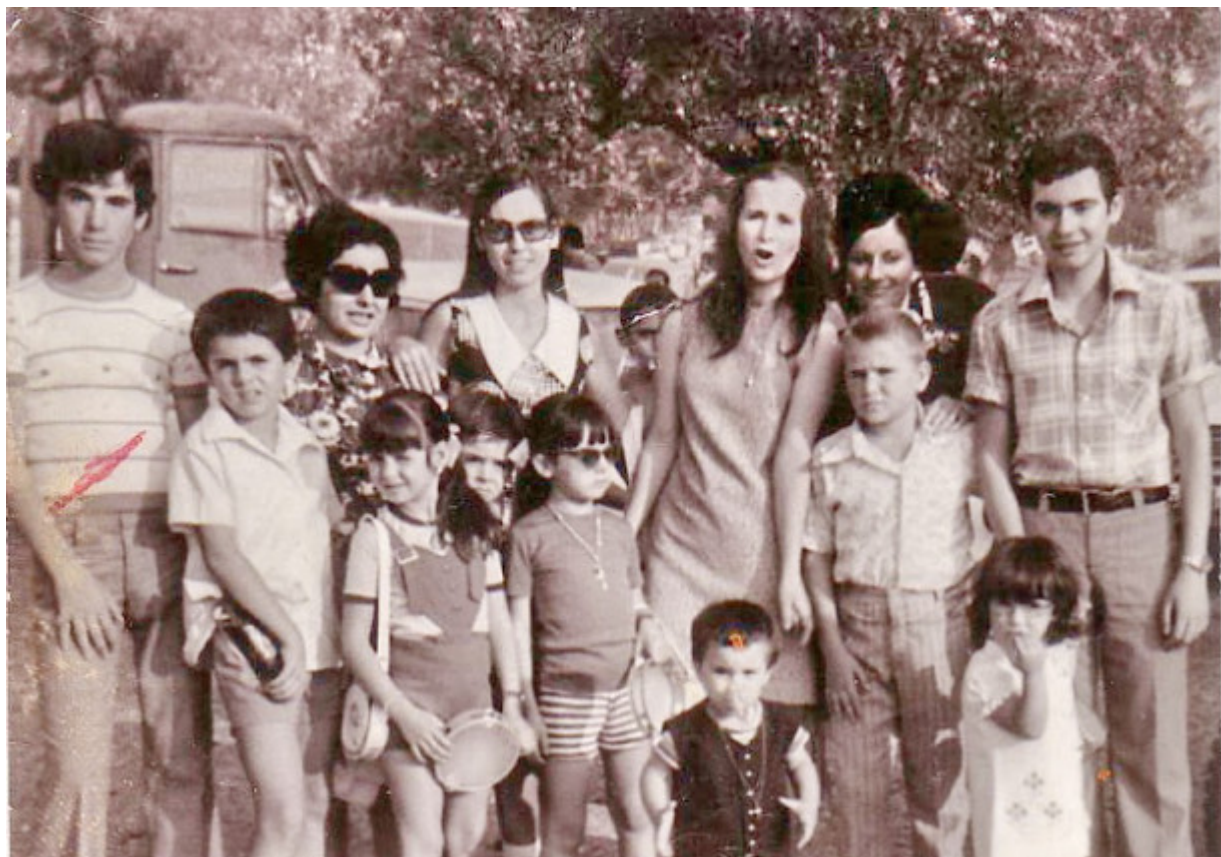
Προσκύνημα στην Παναγία του Βουλκάνου, 15 Αύγουστο