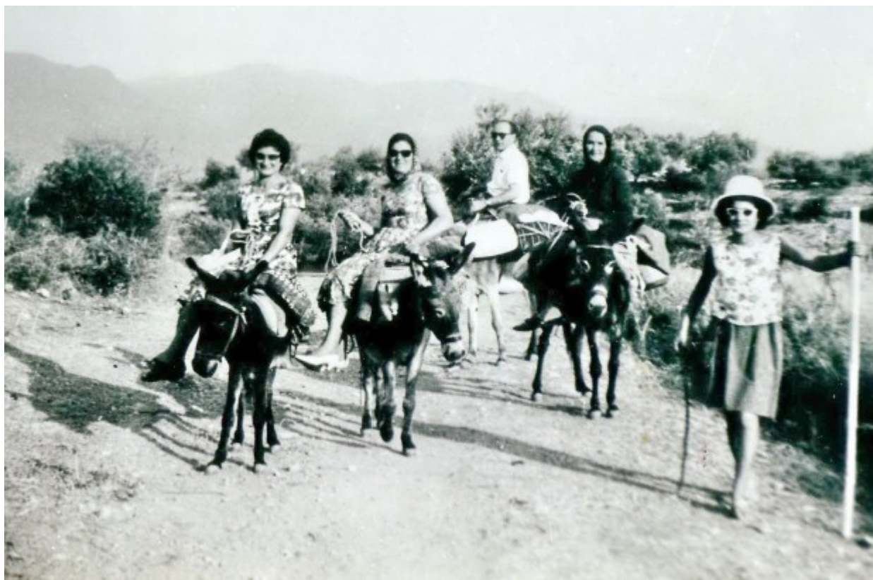
Προσκύνημα στην Παναγία του Βουλκάνου, 15 Αύγουστο