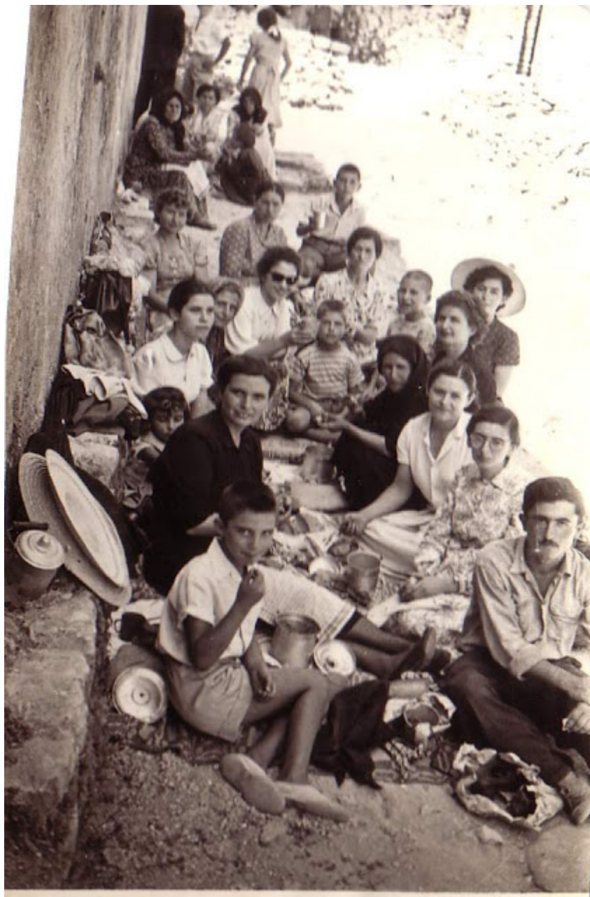
Προσκύνημα στην Παναγία του Βουλκάνου, 15 Αύγουστο