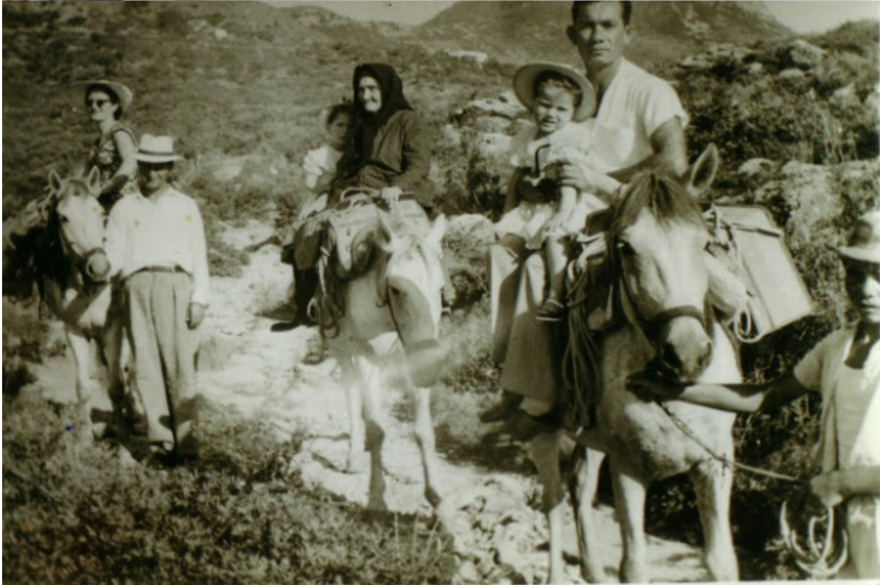
Αγωγή καλτερίμι-Προσκύνημα στην Παναγία του Βουλκάνου, 15 Αύγουστο