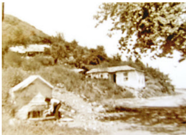
Τσουμή βρύση-Προσκύνημα στην Παναγία του Βουλκάνου, 15 Αύγουστο - Φώτο:αρχείο του Γιάννη Λύρα

Το φωτάναμμα στο Καθολικό του Βουλκάνου Μεσσηνίας είχε διαστάσεις 7.50μ μήκος, 2.61μ πλάτος και 3.06μ ύψος και στους τοίχους υπήρχαν αγιογραφίες. Χρησιμοποιείτο για θέρμανση, καταφύγιο και τόπο προσευχής όταν το κρύο γινόταν αβάσταχτο και εκ περιτροπής κατέφευγαν οι μοναχοί για να ζεσταθούν και να συνεχίσουν το θεάρεστο έργο τους