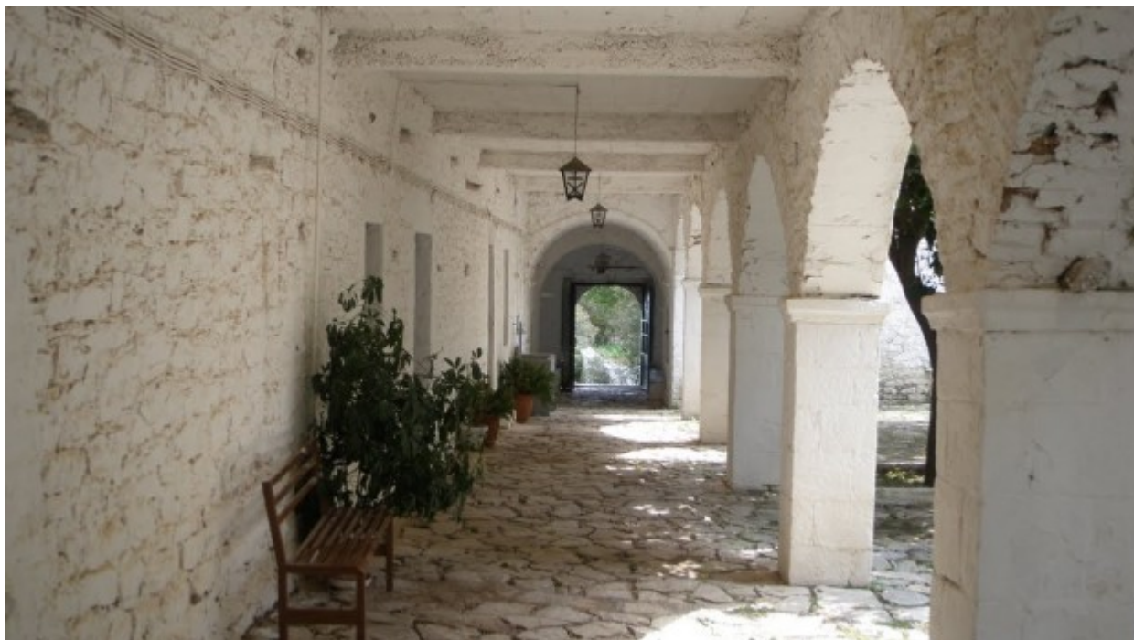
Παναγία του Βουλκάνου