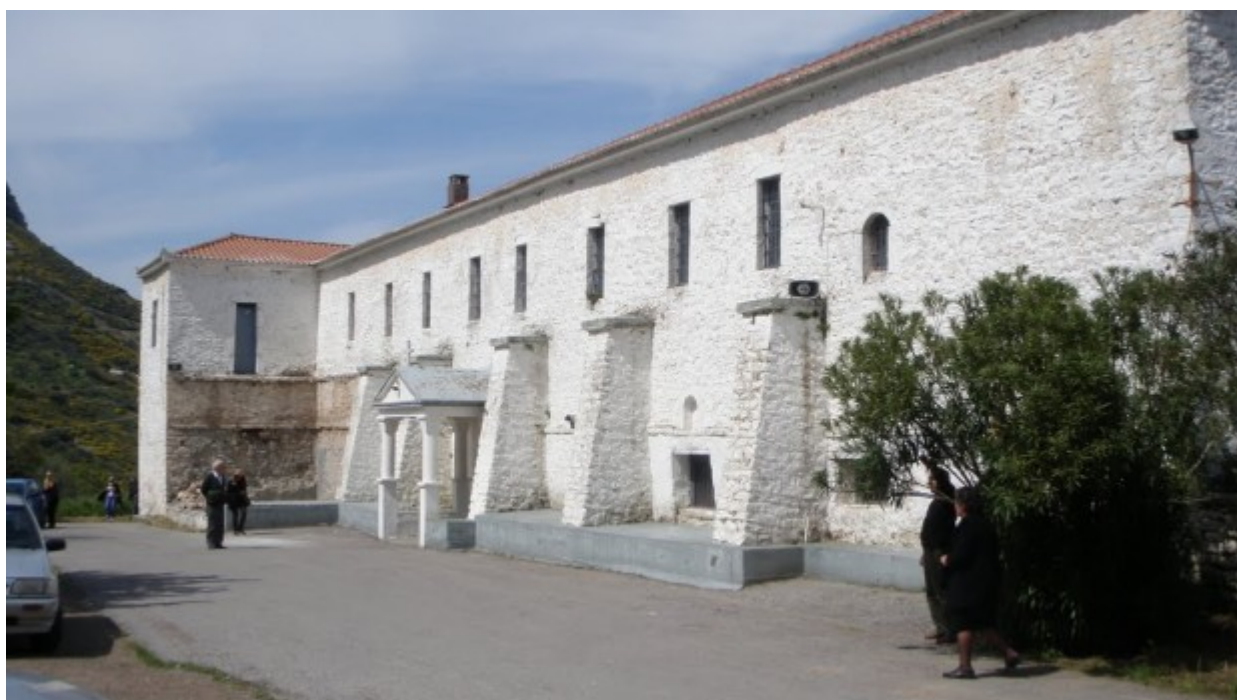
Παναγία του Βουλκάνου