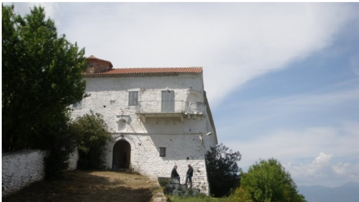
Παναγία του Βουλκάνου