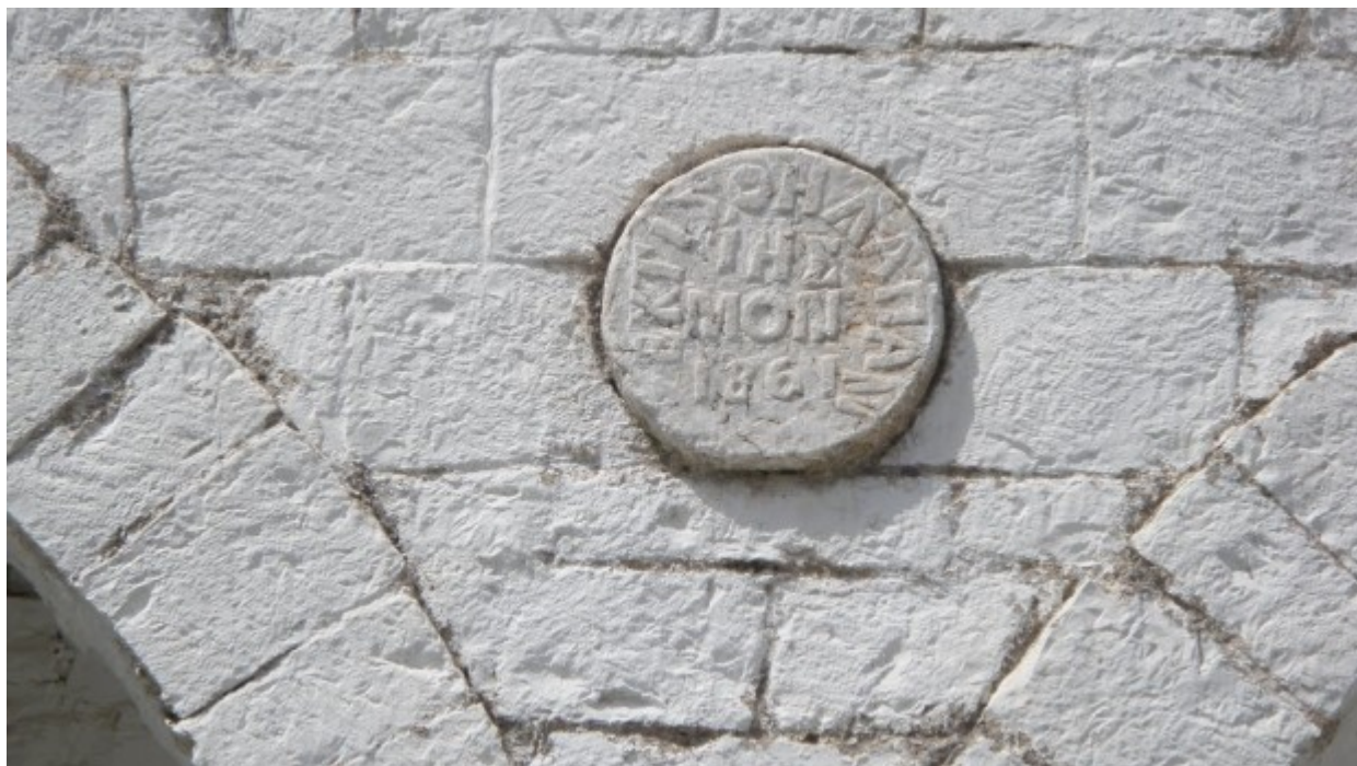
Παναγία του Βουλκάνου