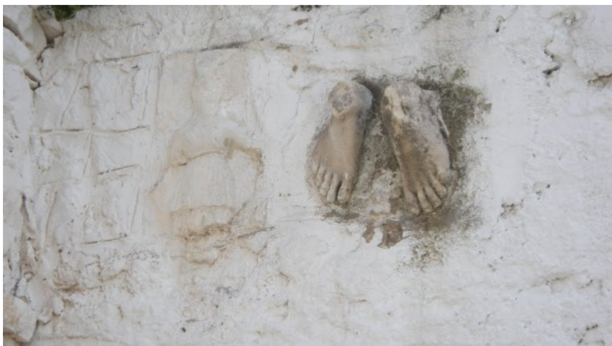
Παναγία του Βουλκάνου