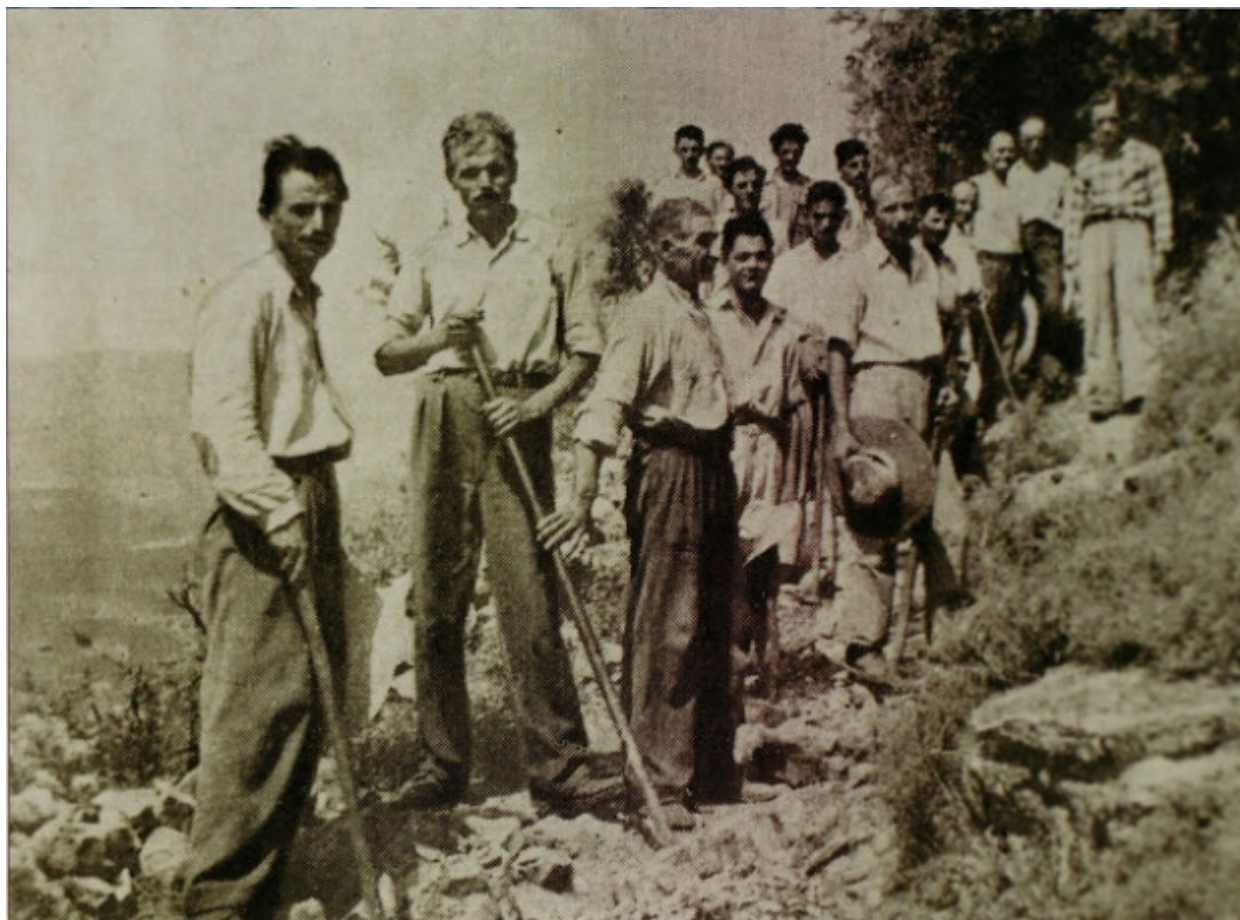
Μαυρομματαίοι-Προσκύνημα στην Παναγία του Βουλκάνου, 15 Αύγουστο - Φώτο:αρχείο του Γιάννη Λύρα