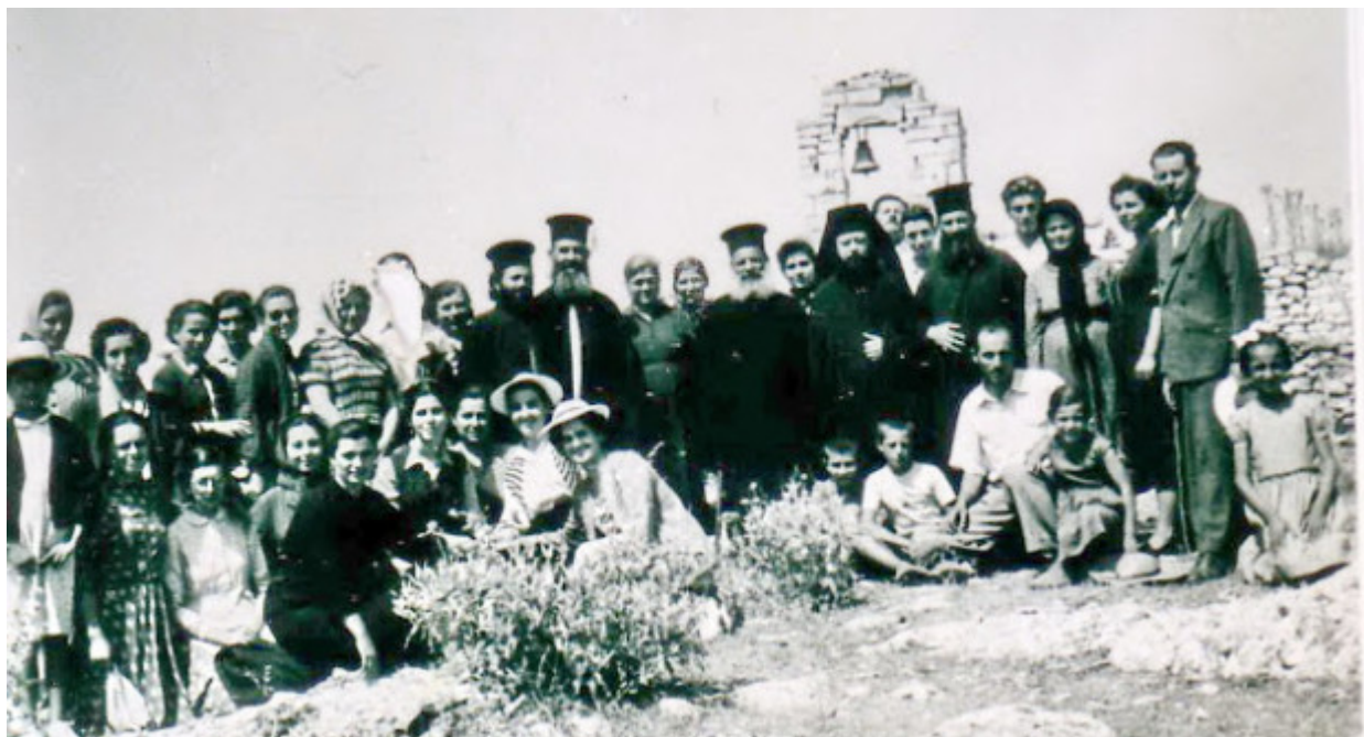
Προσκύνημα στην Παναγία του Βουλκάνου, 15 Αύγουστο