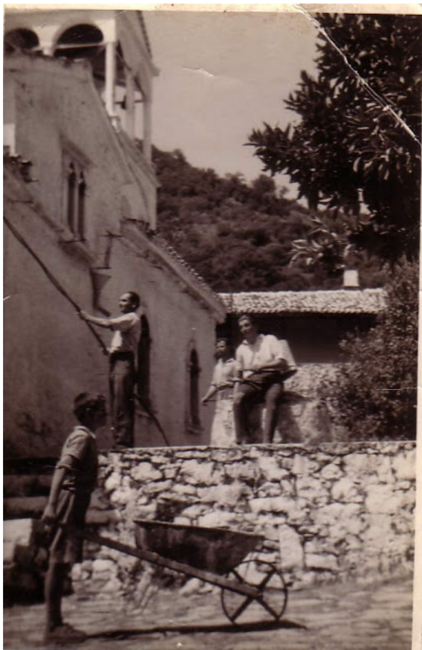
Πηγάδι κάτω Μοναστηριού -Προσκύνημα στην Παναγία του Βουλκάνου, 15 Αύγουστο - Φώτο:αρχείο του Γιάννη Λύρα