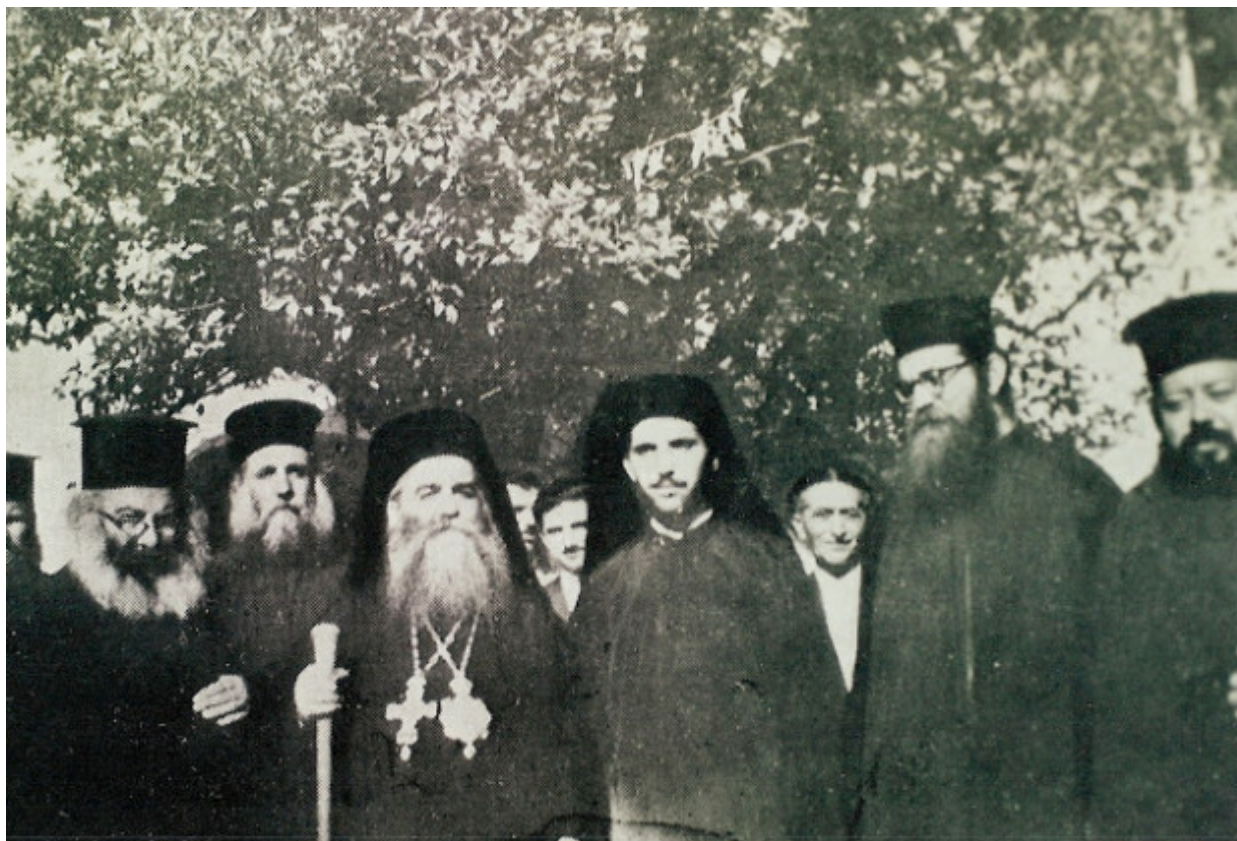
Προσκύνημα στην Παναγία του Βουλκάνου, 15 Αύγουστο