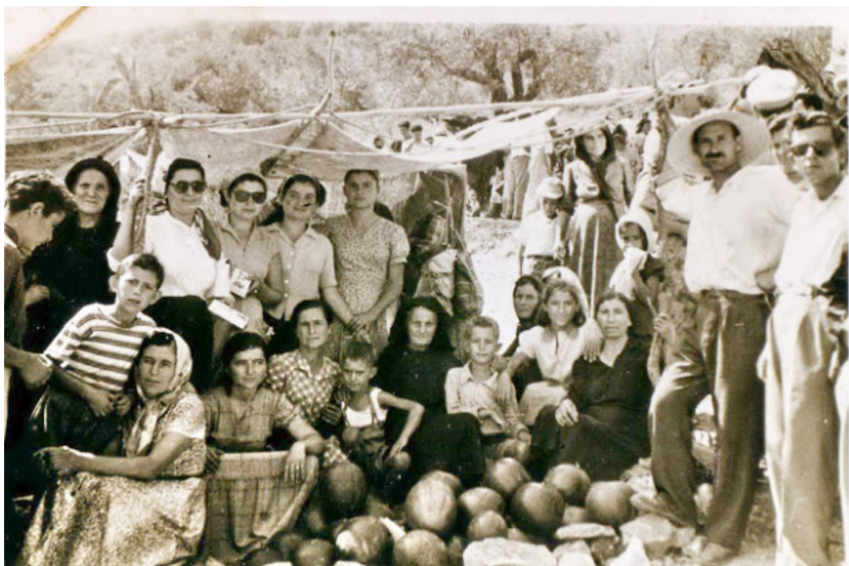
Προσκύνημα στην Παναγία του Βουλκάνου, 15 Αύγουστο - Φώτο:αρχείο