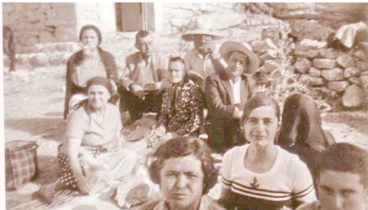
Παρέα Στρατή Γιώργη-Προσκύνημα στην Παναγία του Βουλκάνου, 15 Αύγουστο