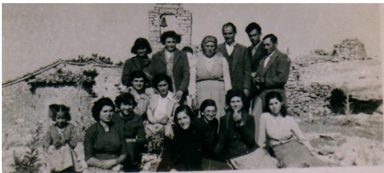
Βαλυραίοι παρέα στο μοναστήρι-Προσκύνημα στην Παναγία του Βουλκάνου, 15 Αύγουστο