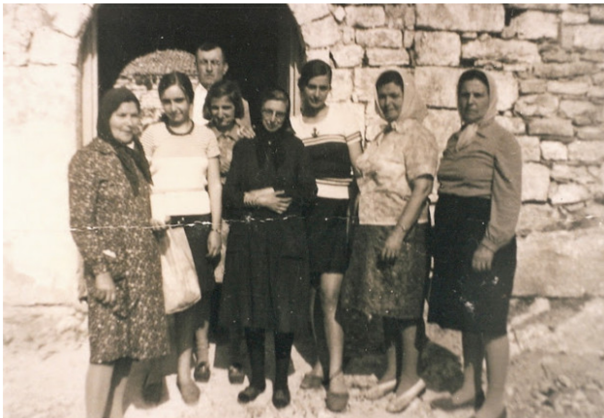
Προσκύνημα στην Παναγία του Βουλκάνου, 15 Αύγουστο