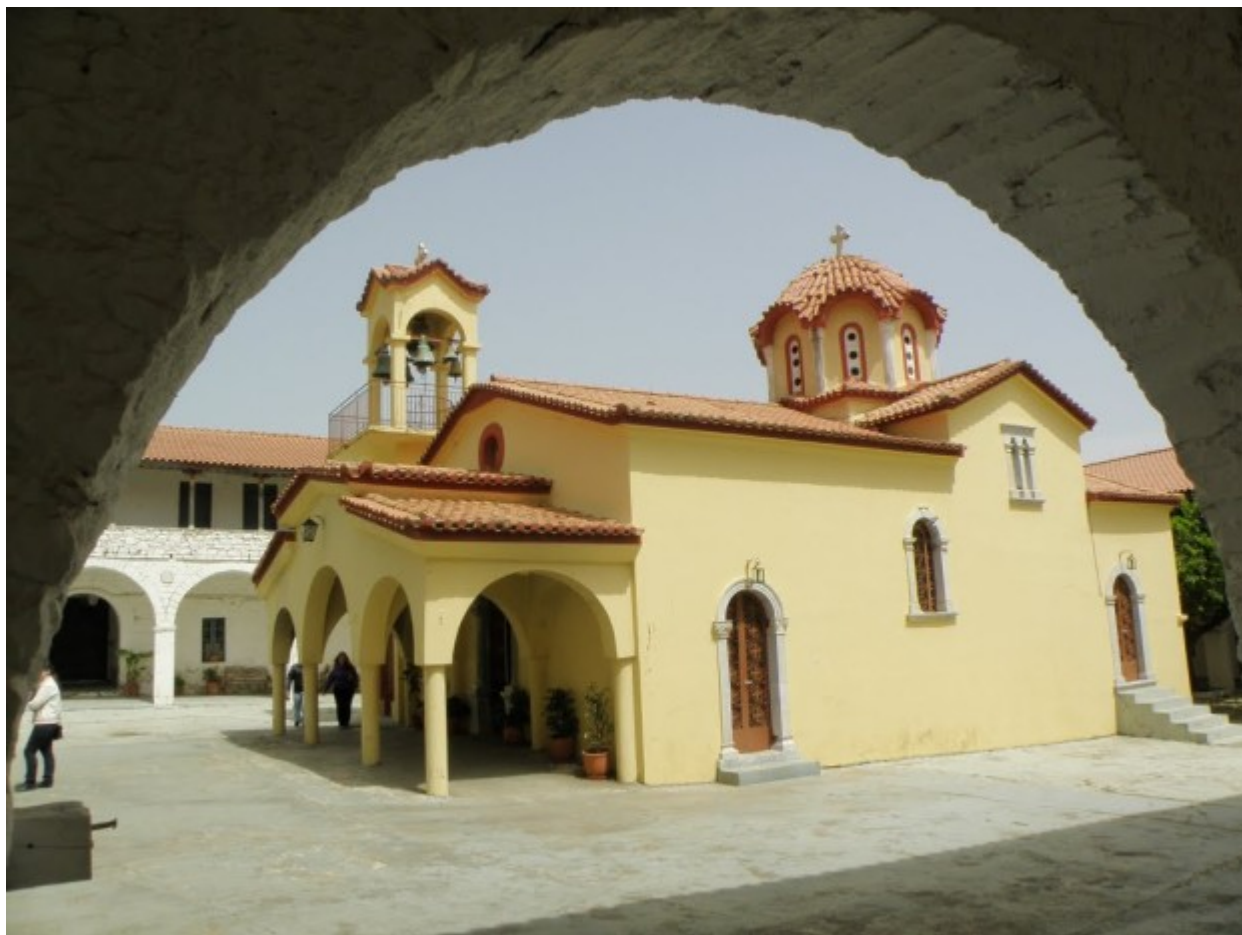
Παναγία του Βουλκάνου