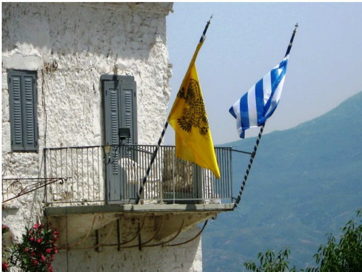
Παναγία του Βουλκάνου

Όσον αφορά στο τυπικό που ακολουθείται στη γιορτή της Γέννησης της Θεοτόκου, αυτό συμπεριλαμβάνει την κάθοδο της εικόνας στην πόλη της Μεσσήνης τη νύκτα της 19ης προς την 20η Σεπτεμβρίου προς ανάμνηση της θαυματουργής επέμβασης της Παναγίας όταν, το 1755, εξαπλώθηκε επιδημία πανούκλας που σκόρπισε το θάνατο στην περιοχή. Η κάθοδος ξεκινά περίπου στις 2 το πρωί από το Βουλκάνο και καταλήγει, μετά από πεζοπορία 20 χλμ, στη «Μαυροματέικη Παναγίτσα», στις 7:30 το πρωί.