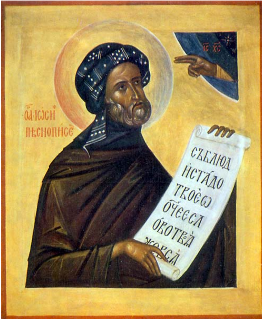
Όσιος Ιωσήφ ο Υμνογράφος