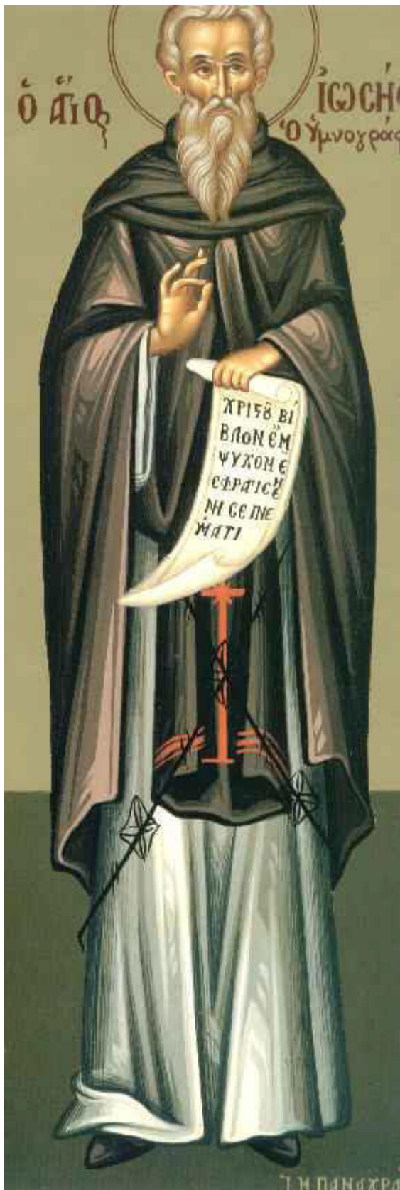
Όσιος Ιωσήφ ο Υμνογράφος