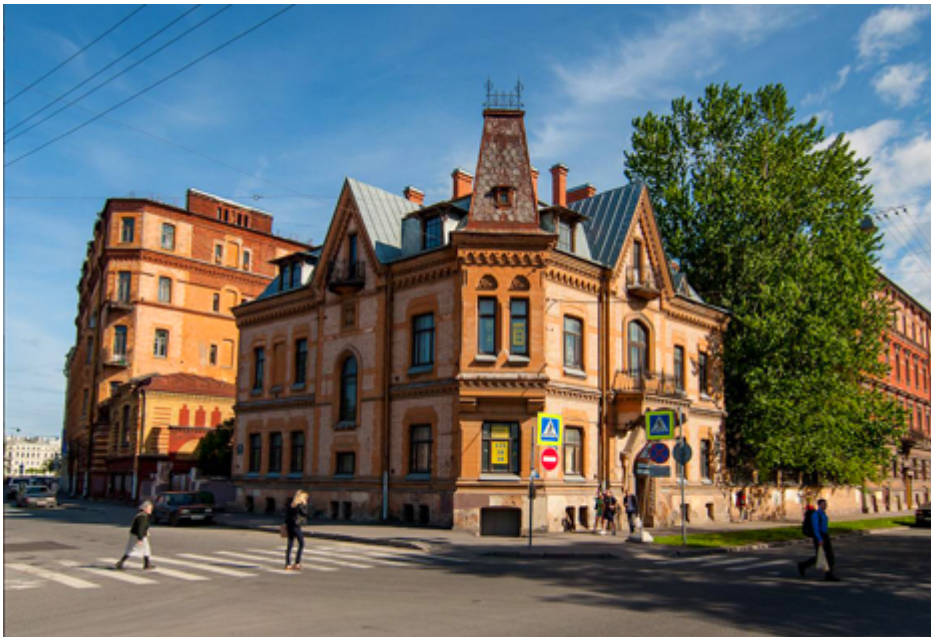
Η πολυκατοικία του Σρέντερ.

Το δεύτερο μισό του 19ου αιώνα στην Κολόμνα, ήταν αφιερωμένο στην αρχιτεκτονική. Εκείνη την εποχή εργάστηκε εδώ ένας από τους πιο σημαντικούς αρχιτέκτονες της Ρωσίας, ο δημιουργός του «πλίνθινου στυλ» Βίκτορ Σριότερ.