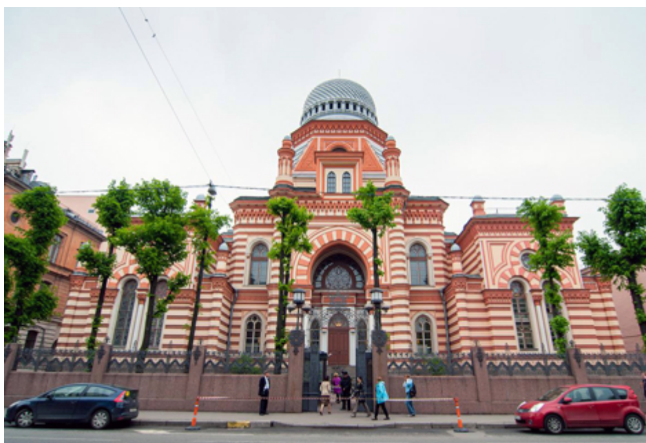
Συναγωγή Χοράλναγια.

Υπάρχει στην Κολόμνα και μια μικρή καθολική εκκλησία, του Αγίου Στανισλάβ, που χρονολογείται από το 1825 (γωνία των οδών Μάστερσκαγια και Σογιούζ Πετσάτνικοφ), καθώς και η συναγωγή Χοράλναγια (λεωφόρος Λέρμοντοβσκι), η οικοδόμηση της οποίας ολοκληρώθηκε με τις δωρεές της εβραϊκής κοινότητας της Αγίας Πετρούπολης και διήρκεσε 10 ολόκληρα χρόνια.