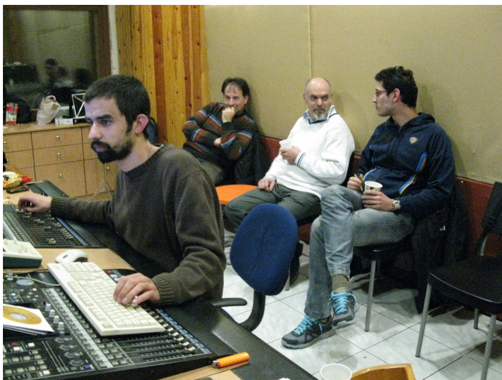
Από την ηχογράφηση του cd

-Μ.Κ.: Από το Αιγαίο, την Κύπρο και τη Μικρά Ασία, γιατί ως επί το πλείστον εκεί καλλιεργείται το συγκεκριμένο μουσικό είδος. Και ενώ κάλαντα του Λαζάρου και το Θρήνο της Παναγίας τα συναντούμε σε όλη την Ελλάδα, τα κατανυκτικά άσματα μόνο στο Αιγαίο απαντιούνται.