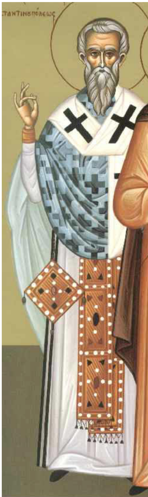
Άγιος Ευτύχιος πατριάρχης Κωνσταντινούπολης