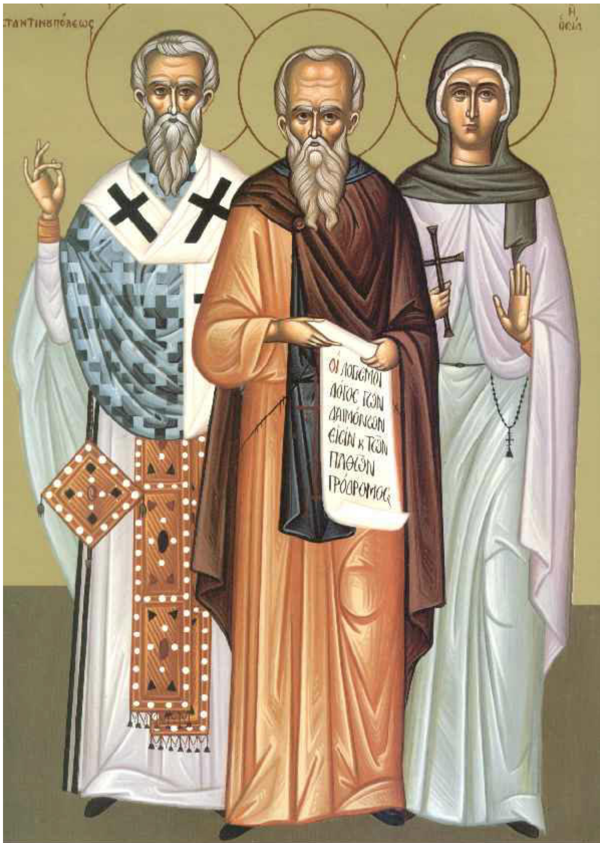
Άγιος Ευτύχιος πατριάρχης Κωνσταντινούπολης-Ο άσιος Γρηγόριος ο Σιναΐτης-Η Οσία ΠΛΑΤΩΝΙΣ