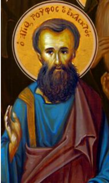
Άγιος Ρούφος ο Απόστολος από τους Ο΄