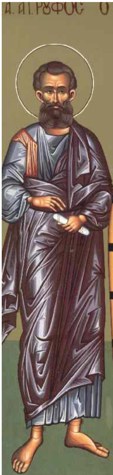
Άγιος Ρούφος ο Απόστολος από τους Ο΄