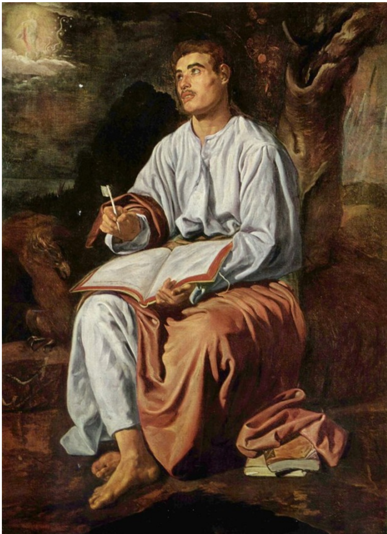
Αυτό το έργο του Diego Velázquez και μερικές εκατοντάδες άλλα σπουδαία έργα περιλαμβάνονται στα 22 videoart της παράστασης.