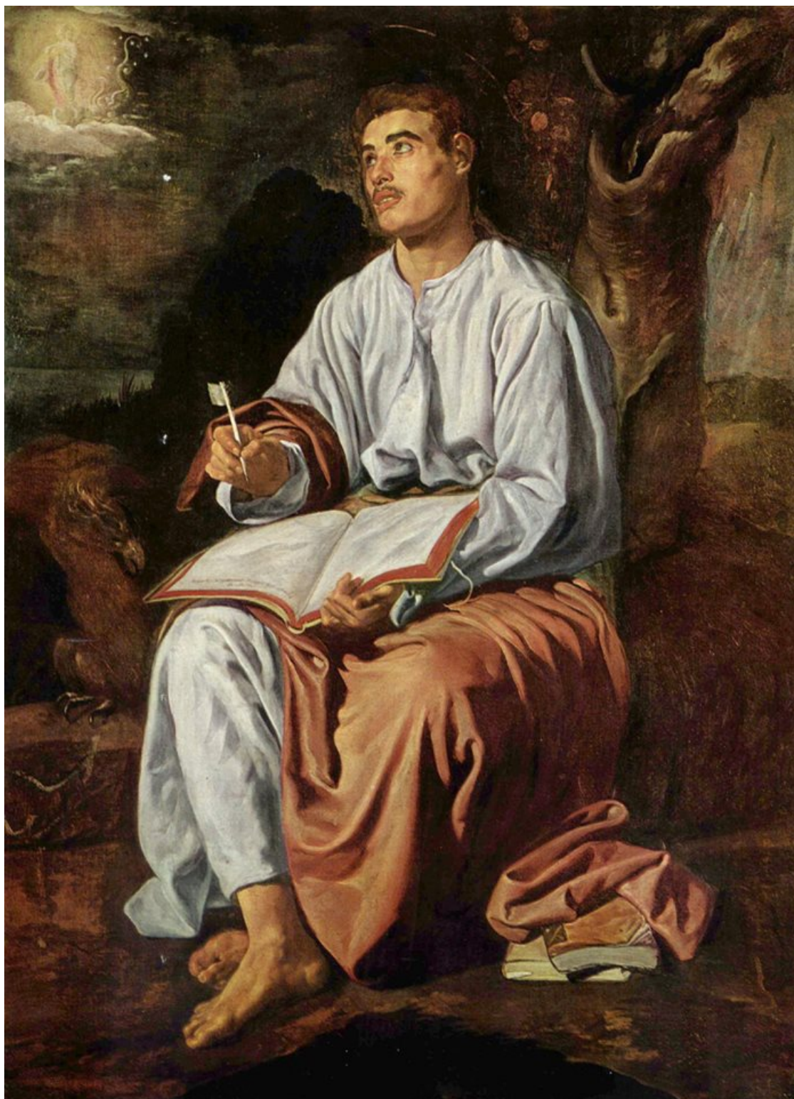
Αυτό το έργο του Diego Velázquez και μερικές εκατοντάδες άλλα σπουδαία έργα περιλαμβάνονται στα 22 videoart της παράστασης.