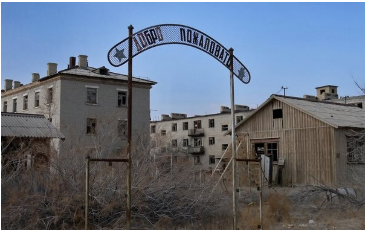
2. Kantubek, Ουζμπεκιστάν

Μια εποχή το νησί Vozrozhdeniya στη λίμνη Αράλη ανάμεσα στο Ουζμπεκιστάν και