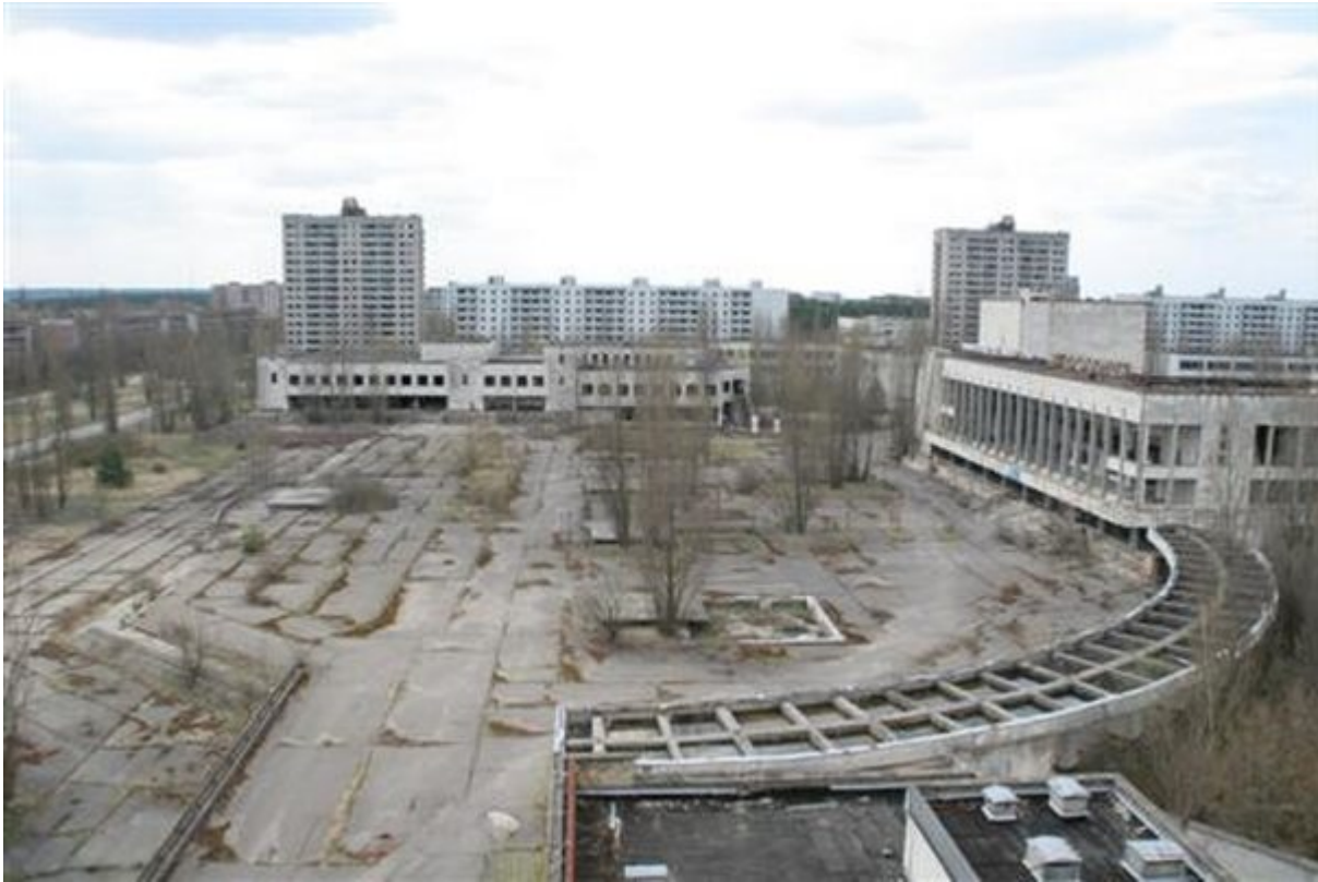
9. Pripyat, Ουκρανία

Ίσως η πιο διάσημη μολυσμένη περιοχή στον κόσμο το Pripyat εκκενώθηκε μετά το πυρηνικό δυστύχημα του Τσέρνομπιλ το 1986. Τότε φιλοξενούσε σχεδόν 50.000 κατοίκους. Τώρα είναι μια διάσημη πόλη-φάντασμα που προσελκύει τουρίστες από όλο τον κόσμο.