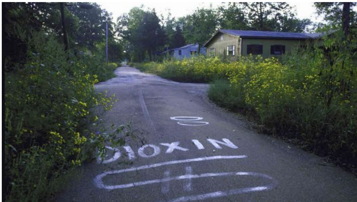
5. Times Beach, Μισσούρι, ΗΠΑ

Κατά τη δεκαετία του 1970, το Times Beach αντιμετώπιζε πρόβλημα με τη σκόνη και για αυτό το λόγο πλήρωσε τον εργολάβο Russell Bliss να ασφαλτοστρώσει τους δρόμους χρησιμοποιώντας πίσσα από ορυκτά απόβλητα. Το πρόβλημα είναι ότι ο Bliss χρησιμοποίησε απόβλητα από μια μονάδα εξαχλωροφαινίου, τα οποία περιείχαν τεράστιες ποσότητες διοξίνης. Μετά την πλημμύρα του ποταμού Μέραμεκ το 1982, η EPA ανακοίνωσε ότι οι συγκεντρώσεις διοξίνης ξεπέρασαν κατά 100 φορές τα όρια ασφαλείας και διέταξε την εκκένωση της πόλης.