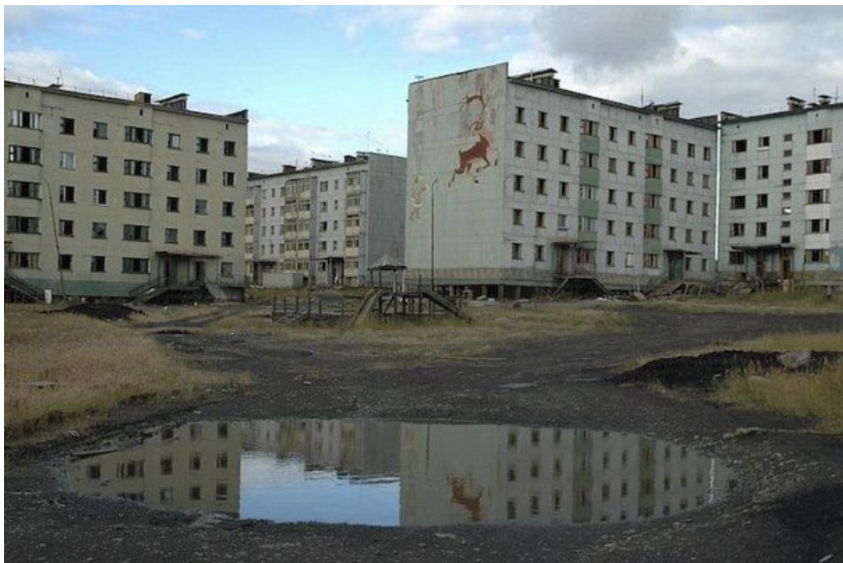
8. Centralia, Πενσυλβάνια

Κάτω από την πόλη εξελίσσεται μια υπόγεια πυρκαγιά εδώ και μισό αιώνα. Κανείς δεν γνωρίζει τα αίτια της φωτιάς ωστόσο αυτή συνεχίζει και καίει λόγω μιας τεράστιας δεξαμενής άνθρακα κάτω από τους δρόμους της πόλης. Οι δρόμοι είναι αδιάβατοι από τη θερμότητα και τα αέρια, ενώ λόγω της πυρκαγιάς διαχέονται τοξίνες στην ατμόσφαιρα. Η μεγάλη εκκένωση της πόλης έγινε το 1984 όταν η κυβέρνηση έδωσε κίνητρα στους κατοίκους να φύγουν.