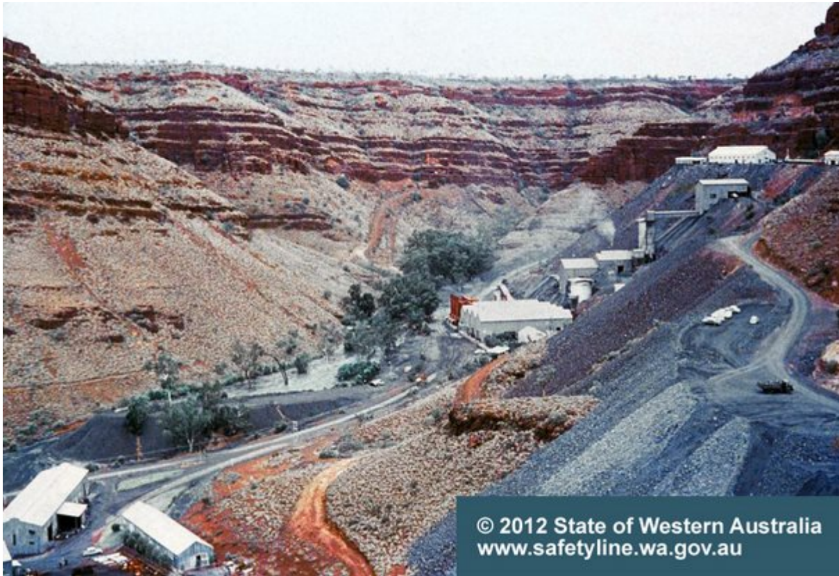
1. Wittenoom, Δυτική Αυστραλία

Η επίσκεψη σε μια πόλη-φάντασμα μπορεί να ελλοχεύει κινδύνους για μια σειρά λόγους, όπως τα ετοιμόρροπα κτήρια και η παρουσία φυλάκων που δεν διστάζουν να πυροβολήσουν τους “αδιάκριτους”.