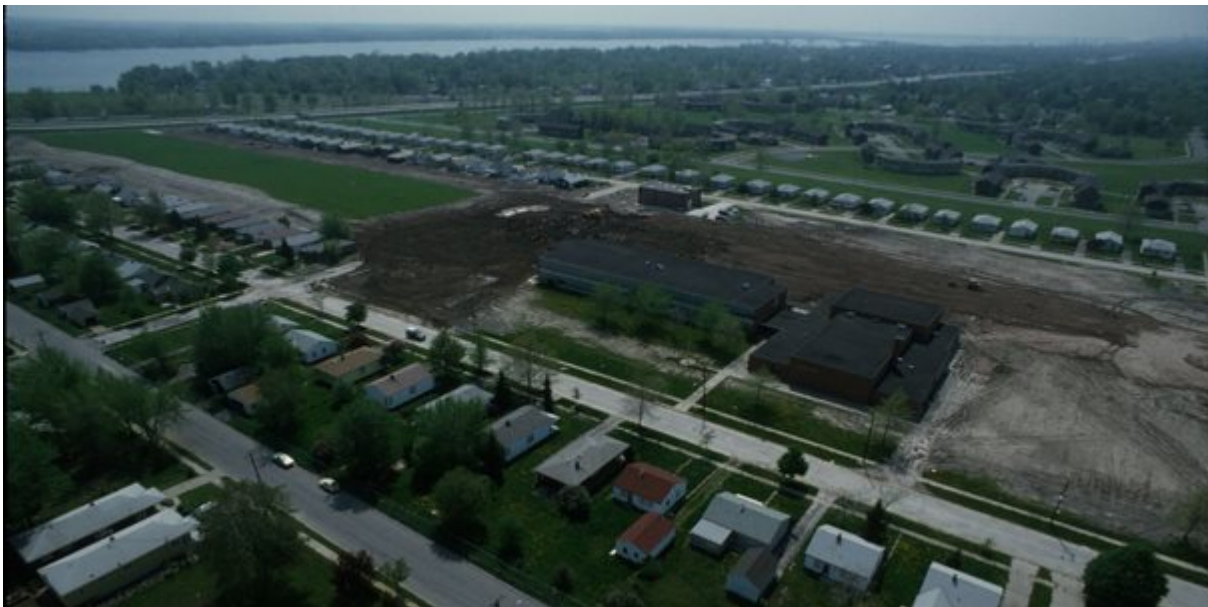
3. Love Canal, Καταράκτες του Νιαγάρα, ΗΠΑ

Παρά το όνομα της πόλης, η περίπτωση του Love Canal αποτελεί μια από τις μεγαλύτερες περιβαλλοντικές τραγωδίες στις ΗΠΑ. Τη δεκαετία του 1890, ο επιχειρηματίας William T. Love ξεκίνησε τη διάνοιξη ενός καναλιού ανάμεσα στα ποτάμια Άνω Νιαγάρας και Κάτω Νιαγάρας με σκοπό να εκμεταλλευτεί την