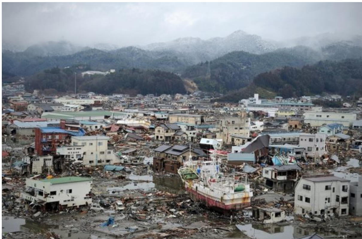
10. Φουκουσίμα, Ιαπωνία

Ο τραγικός σεισμός του Μαρτίου του 2011 και το τσουνάμι που ακολούθησε προκάλεσαν το πυρηνικό δυστύχημα της Φουκουσίμα και ρήμαξαν τις γύρω περιοχές. Μια από αυτές είναι η πόλη Namie-machi που εμπίπτει στη ζώνη εκκένωσης των 20 χιλιομέτρων.