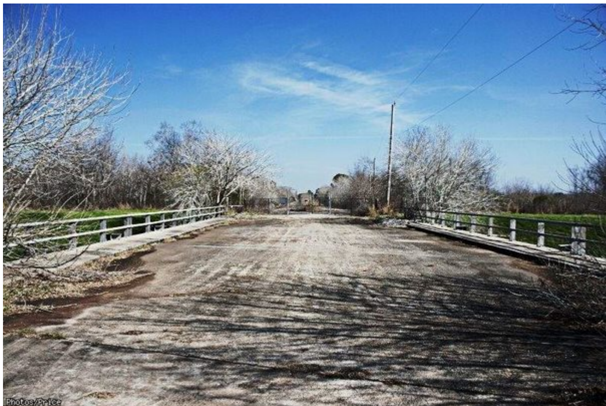
6. Brio Toxic Neighborhood, Τέξας, ΗΠΑ

Το διυλιστήριο Brio στην Κομητεία Χάρρις του Τέξας εξυπηρετούσε διάφορες εταιρείες χημικών έως ότου η Brio Refinery κήρυξε πτώχευση το 1982. Μη επεξεργασμένο πετρέλαιο και διάφορα τοξικά απόβλητα αποθηκεύτηκαν πρόχειρα σε χωμάτινους λάκκους με αποτέλεσμα να διαρρέυσουν και να μολύνουν τον υδροφόρο ορίζοντα της περιοχής. Η μόλυνση του περιβάλλοντος συνδέθηκε με λευχαιμίες, προβλήματα υγείας σε νεογνά και εμφάνιση σπάνιων ασθενειών. Το 1992 έξι εταιρείες χημικών και μια κατασκευαστική “χρύσωσαν το χάπι” στην τοπική κοινωνία πληρώνοντας τα δίδακτρα του Κολλεγίου σε 700 παιδιά από τις πληττόμενες περιοχές. Το μεγαλύτερο μέρος της εγκατάστασης έχει κατεδαφιστεί.