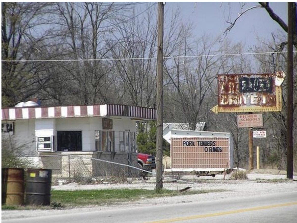
4. Picher, Οκλαχόμα, ΗΠΑ

4. Το Picher είναι μια πόλη που ζούσε από την εξόρυξη μολύβδου και ψευδαργύρου. Στα μέσα της δεκαετίας του 1990, το ένα τρίτο των παιδιών της πόλης βρέθηκαν με αυξημένες συγκεντρώσεις μολύβδου στο αίμα τους, ουσία που συνδέθηκε με νοητικές και μαθησιακές δυσκολίες σε πολλούς μαθητές. Η πόλη εγκαταλείφθηκε τελικά το 2006 όταν μια μελέτη έδειξε ότι κινδυνεύει να βυθιστεί εξαιτίας των στοών εξόρυξης κάτω από τα θεμέλιά της. Το 2011 παρέμεναν μόλις έξι νοικοκυριά και μια επιχείρηση.