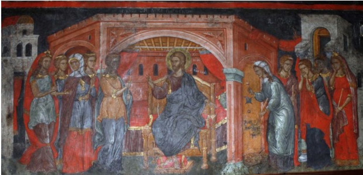
Μεγάλη Τρίτη - Των Δέκα Παρθένων