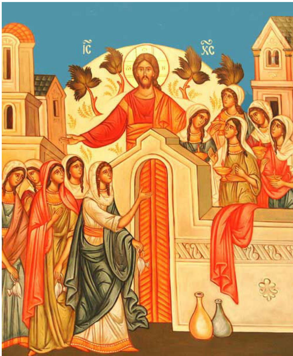
Μεγάλη Τρίτη - Των Δέκα Παρθένων