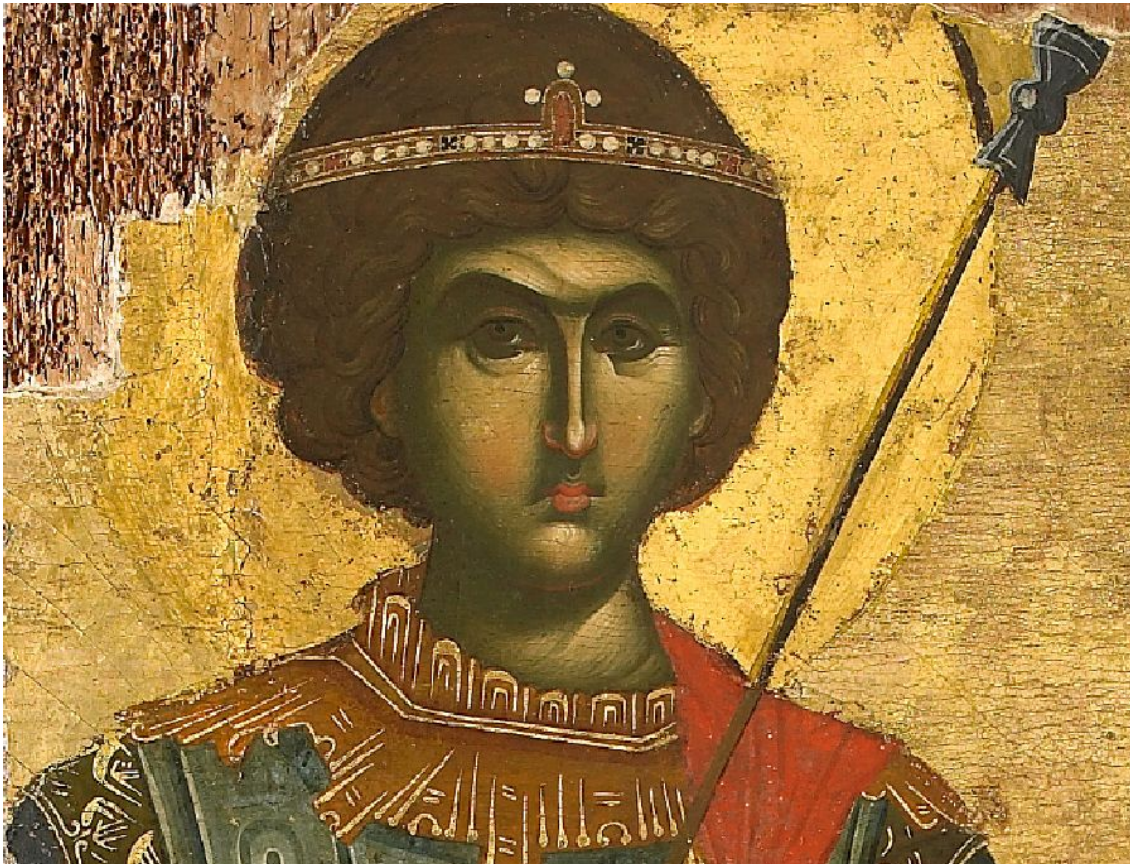
Agios Georgios (Ieptomereia IMMB) 98

Από κάθε πιστό ο Άγιος Γεώργιος και ο Άγιος Δημήτριος θεωρούνται στύλοι της Εκκλησίας πάνω στην υπερφυή μαρτυρία των οποίων στηρίχθηκαν οι πρώτοι Χριστιανοί, αλλά και οι οποίοι μέχρι σήμερα δεν έπαψαν να προστατεύουν τους ευσεβείς και κάθε επικαλούμενο το όνομά τους.