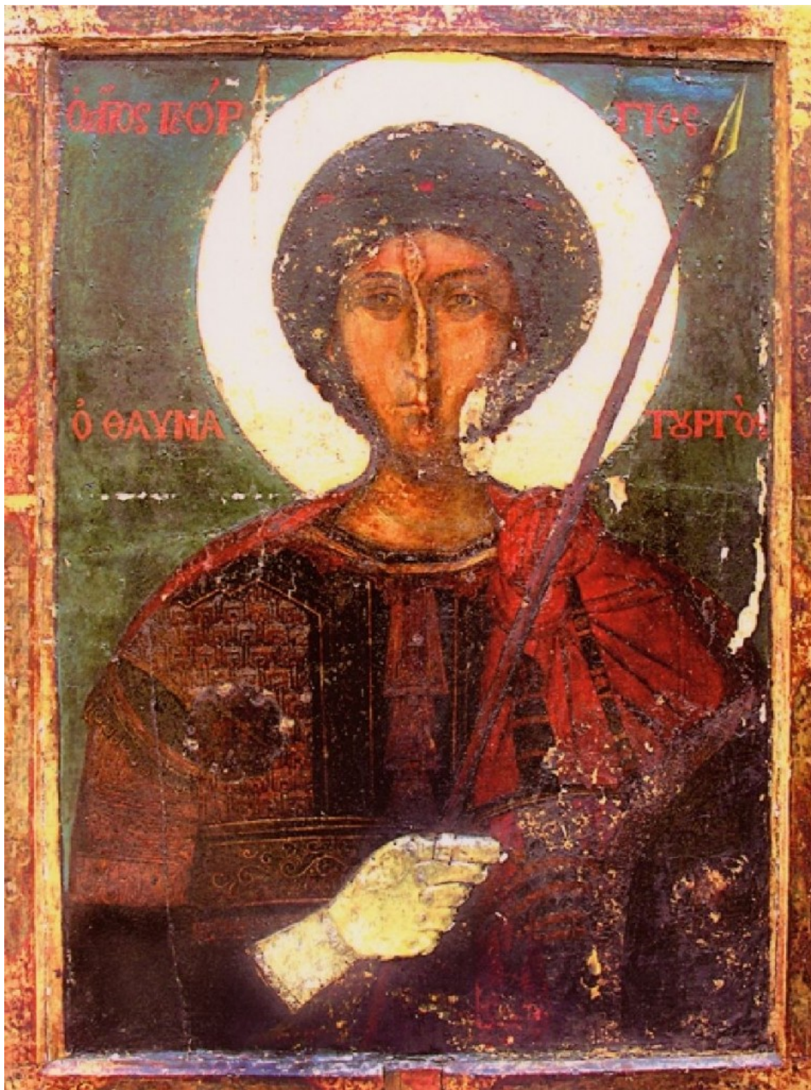
Agios Georgios, Moni Zografou

Ζήτησε τον λόγο από τον βασιλιά, προχώρησε με παρρησία στο βήμα. Όλων τα μάτια στράφηκαν πάνω του. Τι θα έλεγε ο νεαρός αυτός κόμης με το ανδρείο και ευγενικό παράστημα μπροστά στον φοβερό αυτοκράτορα, που με ένα νεύμα του και μόνο μπορούσε να του αφαιρέσει την ζωή, μπροστά σ' όλους αυτούς που ήταν έτοιμοι να κατασπαράξουν όποιον του αντιμιλούσε, μπροστά στους τόσους ηγεμόνες και στρατηλάτες που τον έτρεμαν, μπροστά στα φοβισμένα μάτια του