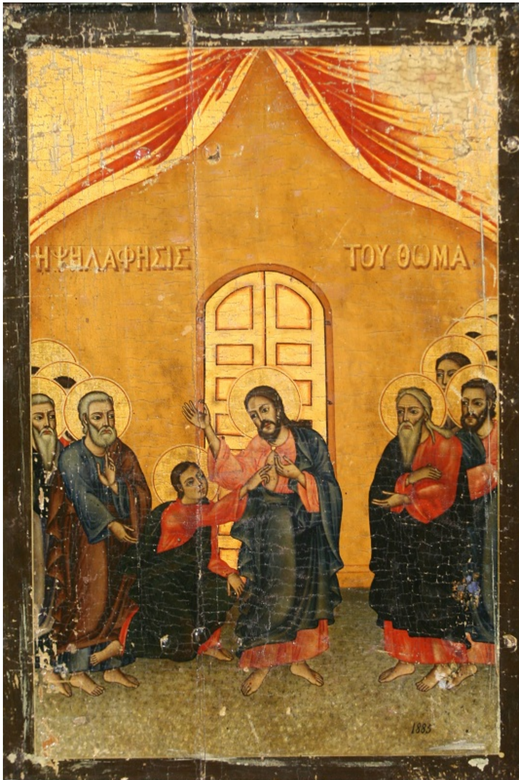
Κυριακή του Θωμά - Ι.Ν. Ζωοδόχου Πηγής, Λαρίσης ( http://www.panagialarisis.gr )