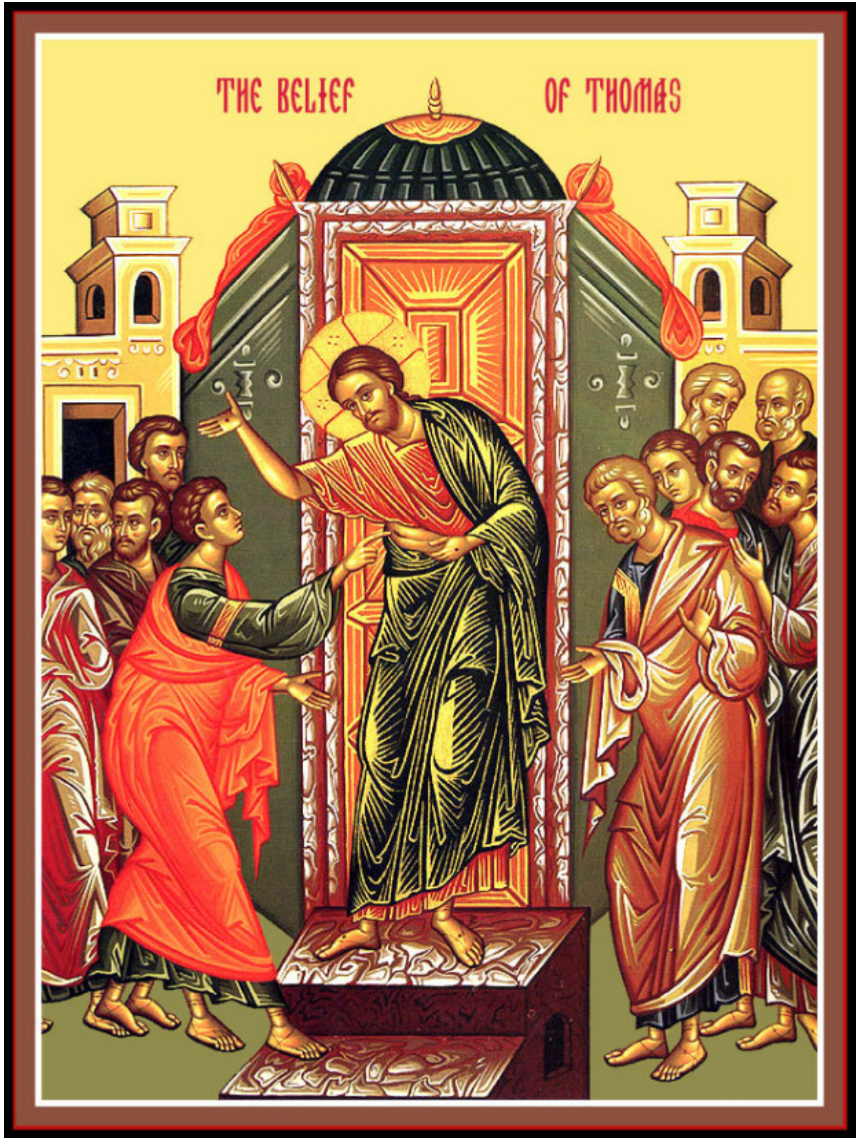
Κυριακή του Θωμά