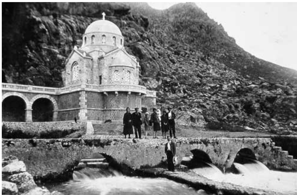
Κεφαλάρι Αργολας. Δεκαετία 1930.