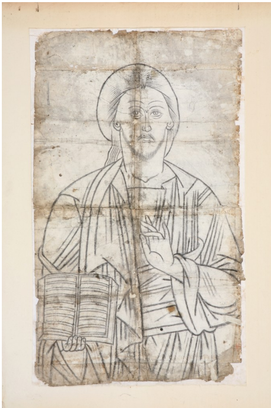
Χριστός Παντοκράτωρ, τέλη 18ου-αρχές 19ου αι.

Η Έκθεση στην Ύδρα, οργανώνεται για πρώτη φορά στην Ελλάδα, μετά από μια σειρά αντίστοιχων Εκθέσεων σε διεθνή Μουσεία την περίοδο 2007-2011, στο πλαίσιο του Προγράμματος για τη Συλλογή των Εικόνων Βελιμέζη. Αξίζει να σημειωθεί ότι για την έκθεση υπήρξε ένα ιδιαίτερο ενδιαφέρον στο εξωτερικό. Σύμφωνα με τους οργανωτές της έκθεσης, οι επισκέπτες της διέθεταν περισσότερο χρόνο για να παρατηρήσουν τα ανθίβολα απ' ό,τι για τη συλλογή Βελιμέζη.