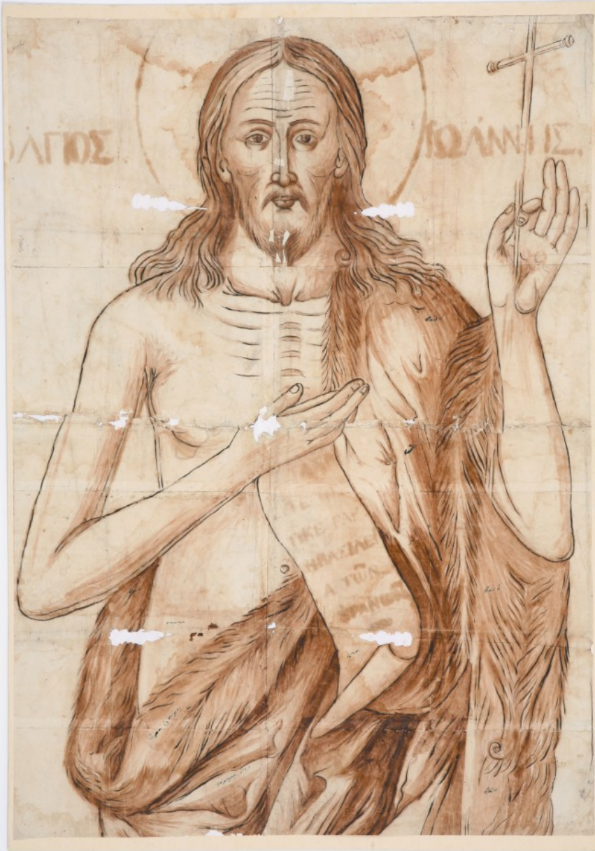
Ο Άγιος Ιωάννης ο Πρόδρομος, 19ος αι.

Στον τόμο «Ανθίβολα από τους Χιονιάδες. Συλλογή Μακρή-Μαργαρίτη», (ΥΠΠΟ, Μουσείο Ελληνικής Λαϊκής Τέχνης, Αθήνα 2009), ο Μακαριώτατος Αρχιεπίσκοπος Αθηνών και πάσης Ελλάδος κ.κ. Ιερώνυμος, σημειώνει μεταξύ άλλων τα εξής: «...Δεν θα ήταν υπερβολή να ομολογήσουμε ότι τα ανθίβολα αποτέλεσαν ένα ενδόμυχο διάλογο των καλλιτεχνών και αγιογράφων με τον ίδιο τους τον εαυτό προκειμένου να επιτύχουν στην πράξη μέσω των δημιουργημάτων τους να απαυγάσουν το θείο φως κατά τον καλύτερο τρόπο. Έτσι και οι Χιονιαδίτες, ένδοξα τέκνα της ηπειρωτικής γης, εισήλθαν στη μεγάλη αλυσίδα των βυζαντινών