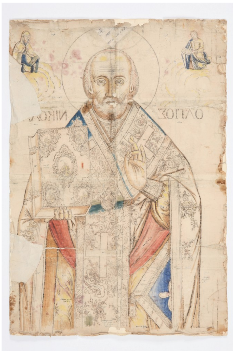
Ο Αγ. Νικόλαος, αρχές 19ου αι.

περισσότερο τη φόρμα παρά το χρώμα. Και θα ήταν λάθος να το εντάξουμε ανάμεσα στα δεκάδες προπαρασκευαστικά σκίτσα αναλογικά με τις προπαρασκευαστικές σπουδές που συχνά προηγούνται μέχρι την ολοκλήρωση ενός έργου ζωγραφικής, αν σκεφτούμε ότι οι αρχές της ισορροπίας, της συμμετρίας, της αξονικότητας, της ιεράρχησης, του ρυθμού και της αναλογίας, όσο πάμε πίσω στο χρόνο, αποτυπώνονται καθαρά και με σαφήνεια πάνω στο σκληρό γραμμικό σχέδιο του ανθιβόλου, από το οποίο συνήθως απουσιάζει η χρωματική ένταση. Αυτοί, άλλωστε, οι νόμοι αποτελούσαν τα διαπιστευτήρια του καλού τεχνίτη που αναλάμβανε να αποτυπώσει τη θεολογία της εικόνας».