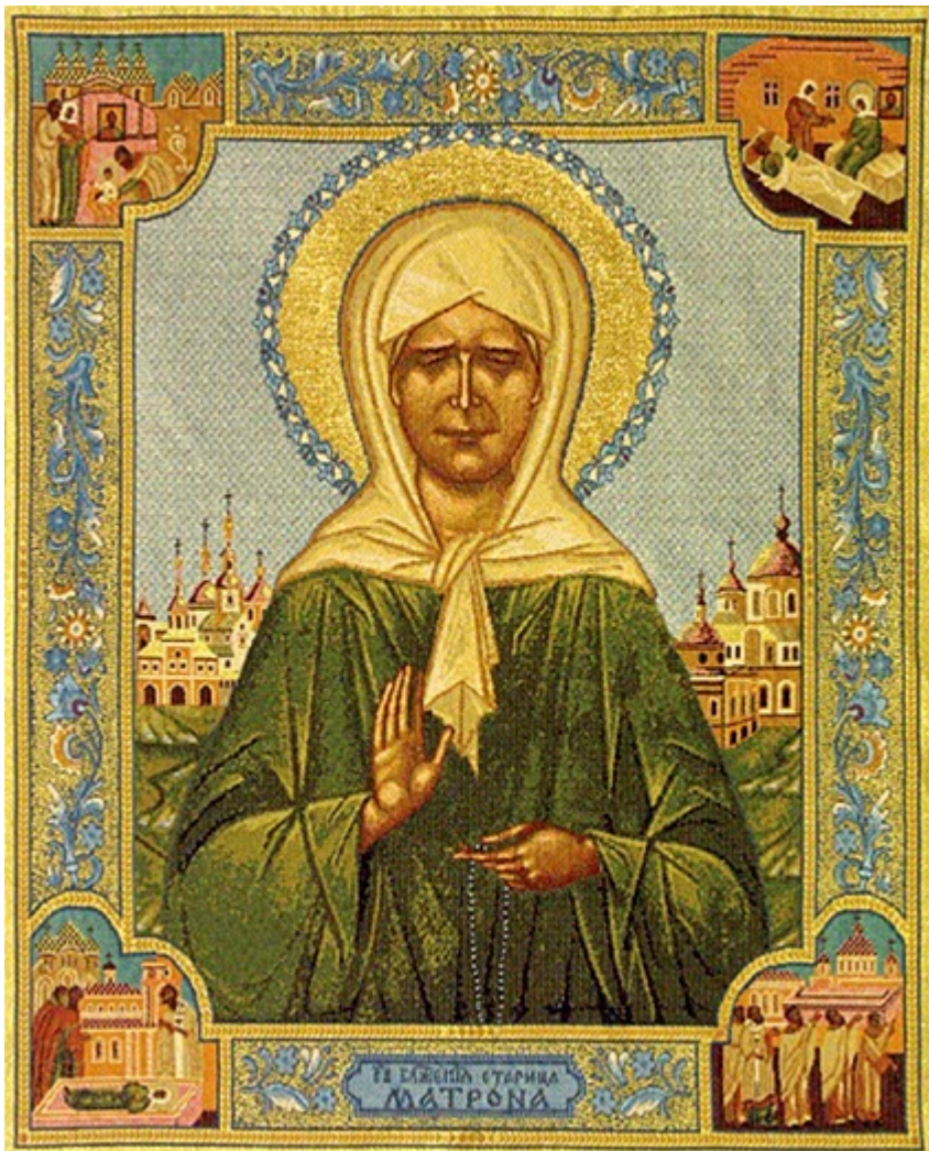
Οσία Ματρώνα εκ Ρωσίας