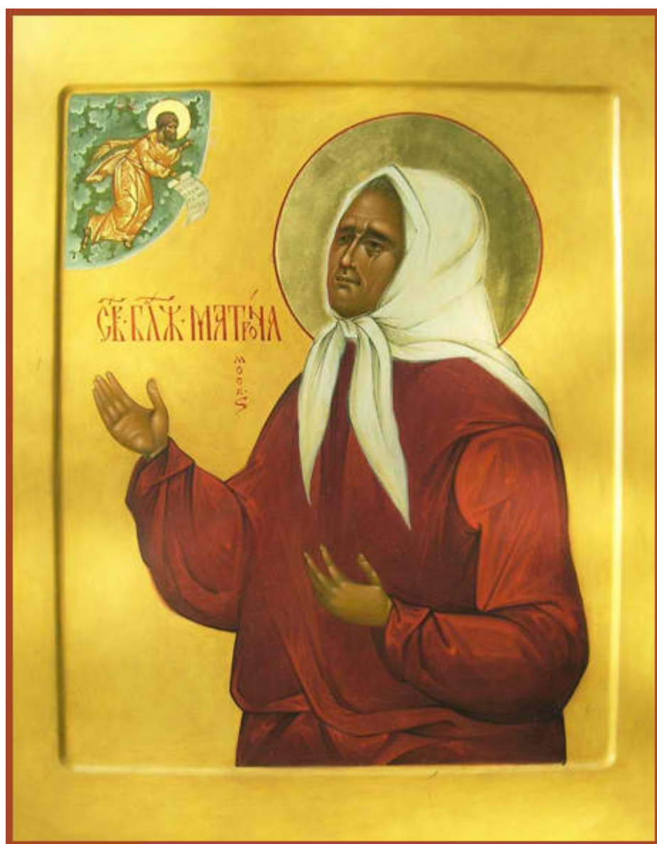
Οσία Ματρῶνα ἐκ Ρωσίας