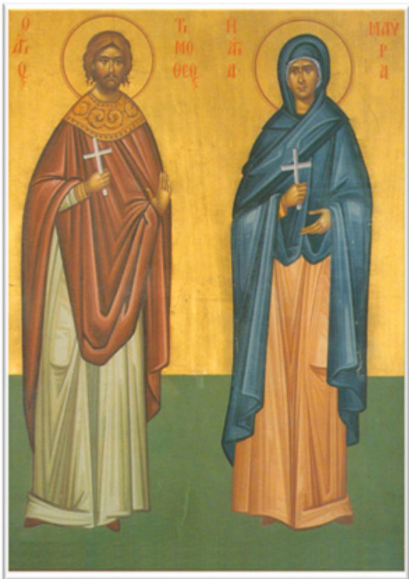
Ἅγιοι Τιμόθεος καὶ Μαύρα