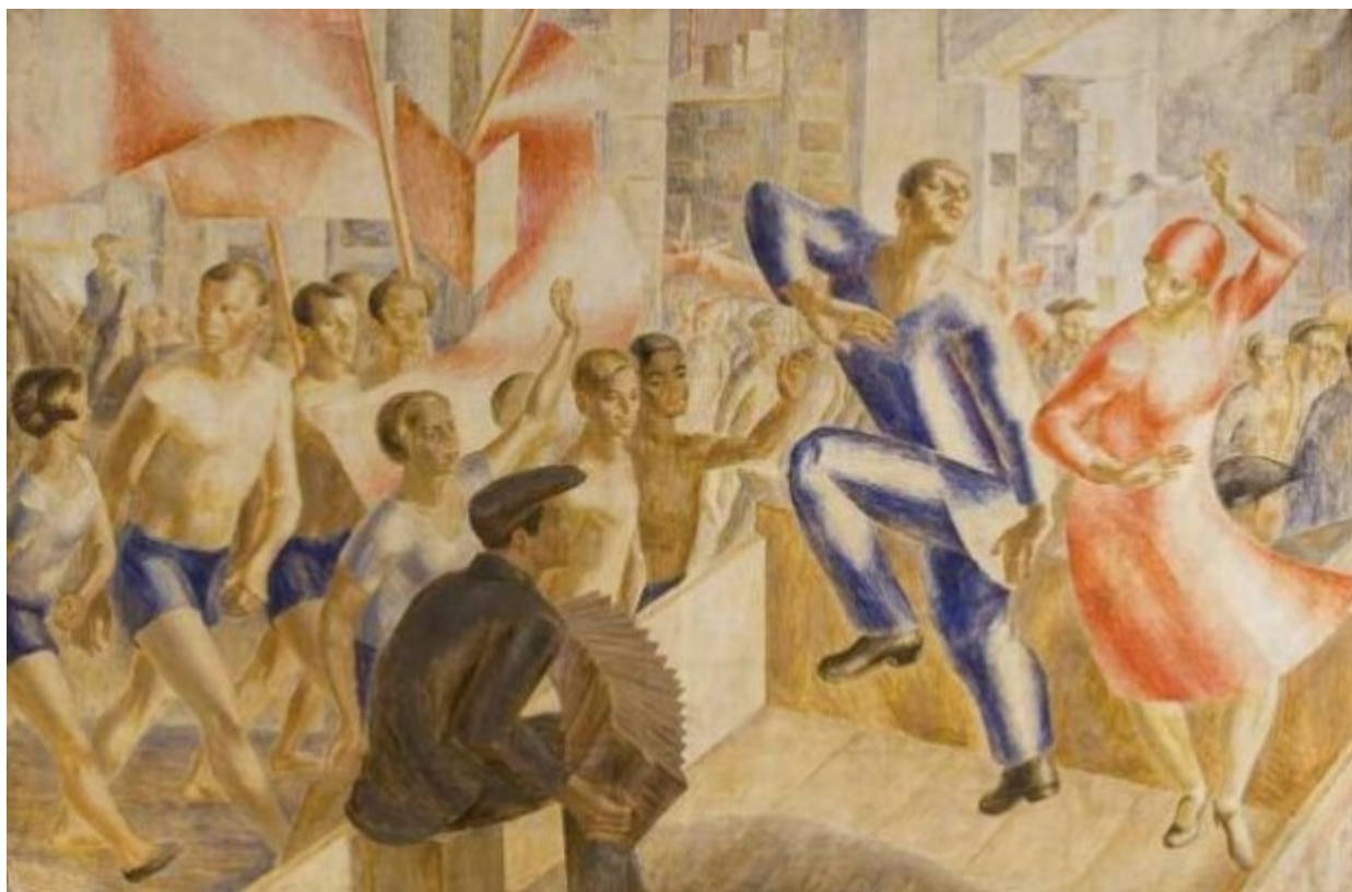
«Ο εορτασμός της Πρωτομαγιάς» του Κούζμα Πέτροφ-Βόντκιν.

6. Αφίσα για την εργατική Πρωτομαγιά του Γιάκοβ Γκούμνινερ. Η συγκεκριμένη αφίσα, έργο του 1928, είναι ένα από τα λιγότερο γνωστά διαμαντάκια του κονστρουκτιβισμού.