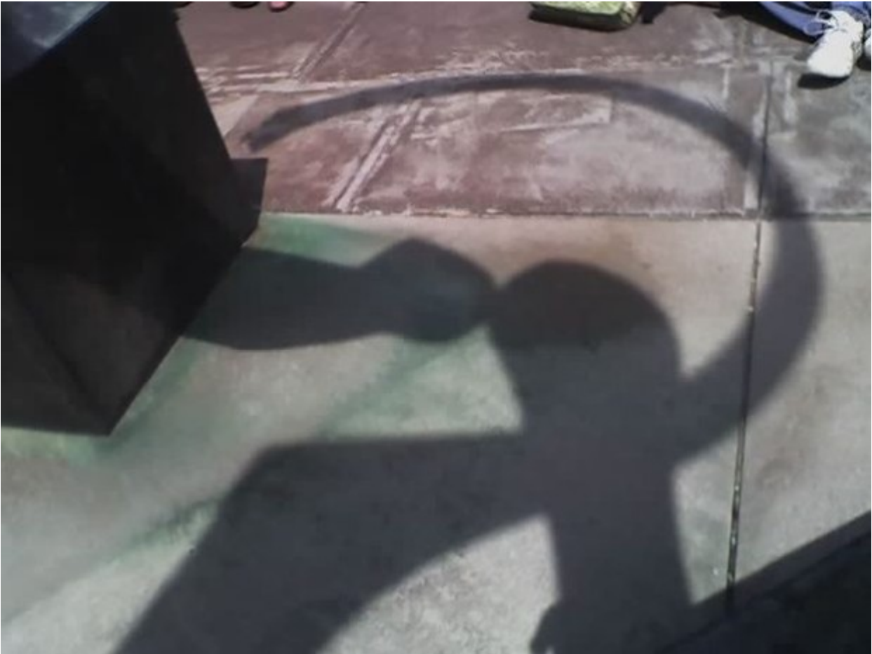
«Dialogo», Βιρτζίνιο Φεράρι.

9. «Dialogo», Βιρτζίνιο Φεράρι. Μπορεί τα έργα του να κοσμούν δημόσιους χώρους στις ΗΠΑ και στην Ιταλία, μπορεί να έχει τιμηθεί με ένα σωρό βραβεία, όμως ο Βιρτζίνιο Φεράρι οφείλει τη φήμη του σε ένα και μόνο έργο: Το γνωστό «Dialogo» το οποίο δεσπόζει στους κήπους του Πανεπιστημίου του Σικάγο από το 1973. Ο λόγος; Το γλυπτό είναι έτσι τοποθετημένο ώστε κάθε χρόνο την Πρωτομαγιά η σκιά του να διαγράφει το σχήμα του σφυροδρέπανου. Όπως είναι φυσικό το σημείο αποτελεί πόλο έλξης για αργόσχολους και περίεργους που μαζεύονται κάθε χρόνο για να παρατηρήσουν το φαινόμενο.