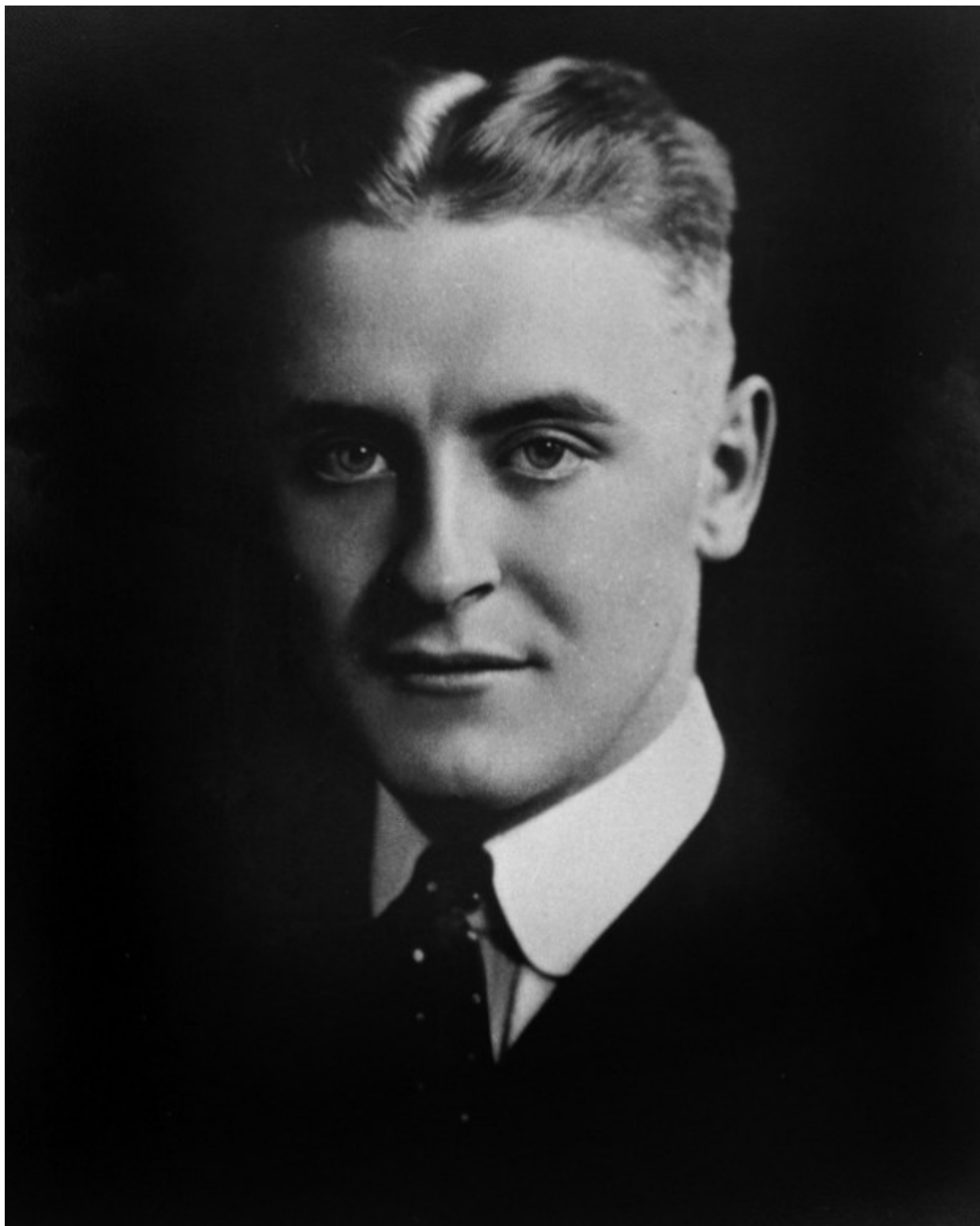
«May day», από τη συλλογή διηγημάτων «Tales of the jazz age» του Σκοτ Φιτζέραλντ.

2. «May day», από τη συλλογή διηγημάτων «Tales of the jazz age» του Σκοτ Φιτζέραλντ. Εμπνευσμένο από τα επεισόδια που συντάραξαν το Κλίβελαντ την Πρωτομαγιά του 1919, το διήγημα του Φιτζέραλντ εστιάζει σε μια παρέα νεαρών απόφοιτων του Γέιλ οι οποίοι παρατηρούν τα γεγονότα με τον κυνισμό και την αδιαφορία που χαρακτηρίζουν τους γνωστότερους ήρωες του συγγραφέα.