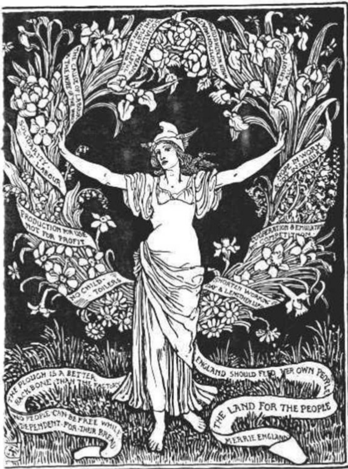
• A GARLAND FOR MAY DAY 1895 • • DEDICATED TO THE WORKERS BY WALTER CRANE •

Ένα στεφάνι για την πρωτομαγιά του 1895, αφιερωμένο στους εργάτες από τον Ουόλτερ Κρέιν.