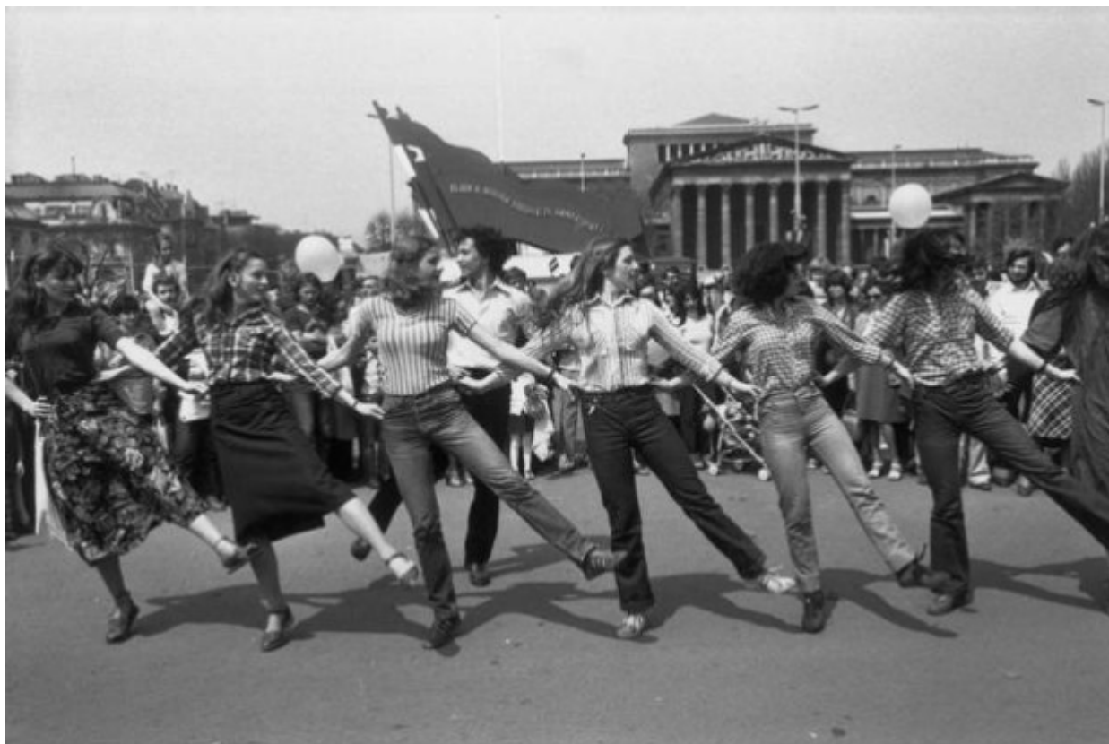
Η Πρωτομαγιά του 1968 στην Πράγα με τον φακό του Γιόζεφ Κουντέλκα.