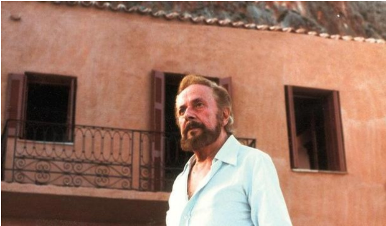
«Επιτάφιος», Γιάννης Ρίτσος.

Η Εργατική Πρωτομαγιά και τα ιστορικά γεγονότα που συνέπεσαν με αυτή την ημερομηνία υπήρξαν η αφορμή για τη δημιουργία έργων τέχνης, συχνά προπαγανδιστικού χαρακτήρα. Κάποια από αυτά, αφού εξυπηρέτησαν τον σκοπό τους, ξεχάστηκαν διότι η καλλιτεχνική αξία τους ήταν ελάχιστη, κάποια περιμένουν στα συρτάρια για να ανακαλυφθούν εκ νέου και κάποια άλλα συνεχίζουν να συγκινούν με τη δύναμη και την πρωτοτυπία τους. Επιλέξαμε μερικά από αυτά και τα καταθέτουμε.