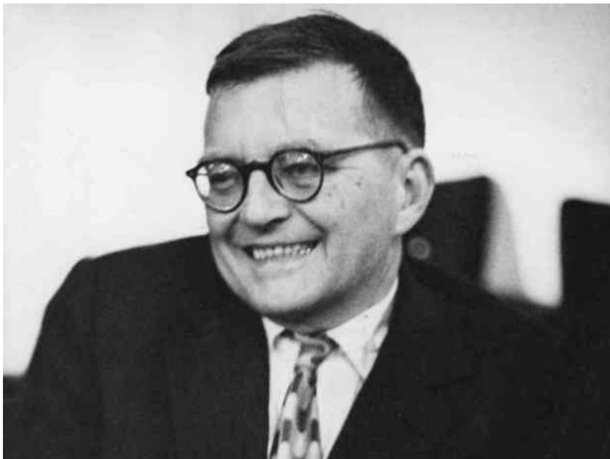
Συμφωνία Νο 3 «Η πρώτη του Μάη» του Ντιμίτρι Σοστακόβιτς.

4. Συμφωνία Νο 3 «Η πρώτη του Μάη» του Ντιμίτρι Σοστακόβιτς. Παρουσιάστηκε για πρώτη φορά από τη Συμφωνική Ορχήστρα του Λένινγκραντ το 1930 και εκφράζει σύμφωνα με τον δημιουργό της το πνεύμα της ειρηνικής ανοικοδόμησης μετά από την επιτυχή έκβαση της επανάστασης.