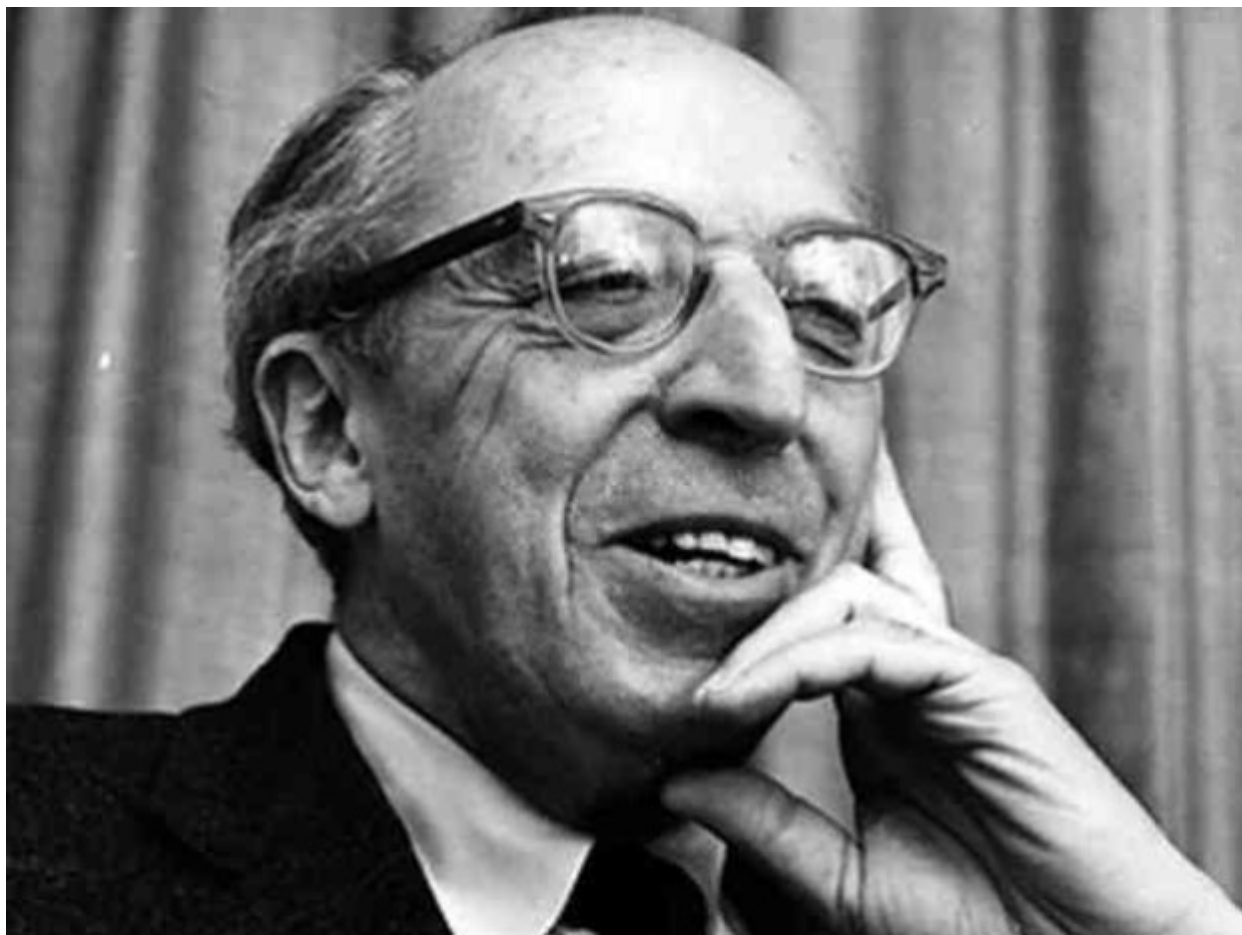
«Into the streets May first» του Άαρον Κόπλαντ.

3. «Into the streets May first» του Άαρον Κόπλαντ. Το τραγούδι γράφτηκε το 1935 όμως ο συνθέτης του, ο πιο Αμερικανός από τους Αμερικανούς συνθέτες του 20ού αιώνα, κλήθηκε να απολογηθεί γι' αυτό το 1953. Οι «κακοί» της ιστορίας ήταν φυσικά τα μέλη της Επιτροπής Αντιαμερικανικών Ενεργειών της οποίας προέδρευε ο γερουσιαστής Τζόζεφ Μακάρθι που καταλόγισαν στον Κόπλαντ συμμετοχή σε 27 (!)