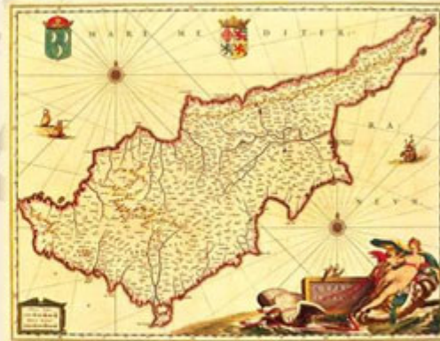
Wikimedia Commons: H.C.101, Novus Atlas, Jamboulium 1661-62