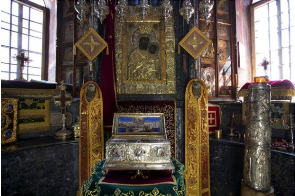
Η Τιμία Ζώνη της Υπεραγίας Θεοτόκου (Ιερά Μεγίστη Μονή Βατοπαιδίου Αγίου Όρους).

Η λειψανοθήκη αναδημοσιεύει εδώ το άρθρο του Κωνσταντίνου Θ. Χιούτη σχετικά με το αρχαιακό υλικό που διασώζεται στην Ιερά Μονή Βατοπαιδίου Αγίου Όρους και αφορά την αποστολή της Αγίας Ζώνης της Θεοτόκου και του λειψάνου του Αγίου Χαραλάμπους, προστάτου κατά της πανώλης, από την Ιερά Μονή Βατοπαιδίου στην Αρναία Χαλκιδικής, όταν επιδημία πανώλης έπληξε το 1813 την περιοχή.