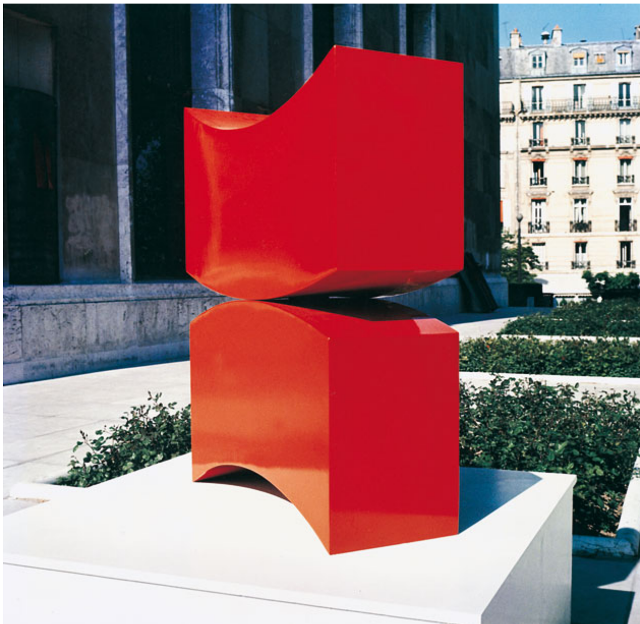
Ναυσικά Πάστρα. Σύνεκτρον Χ2, Synectron X2, Σίδηρο, Iron, 95χ90χ30εκ./cm, Salon de Mai, Museum of Modern Art, Paris, 1973.

Για το έργο την καλλιτεχνική έρευνα και τη θεωρία στο έργο της Ναυσικάς Πάστρα θα πραγματοποιηθεί στο Γαλλικό Ινστιτούτο Θεσσαλονίκης, την Τρίτη 13 Μαΐου 2014, στις 18.00, στο πλαίσιο της έκθεσης «Ναυσικά Πάστρα. 1921-2011. Αναδρομική έκθεση: τα σχέδια, τα γλυπτά και τα θεωρητικά κείμενα» που φιλοξενείται μέχρι τις 25.05 στο Κρατικό Μουσείο Σύγχρονης Τέχνης, στη Μονή Λαζαριστών, στη Θεσσαλονίκη. Στην έκθεση παρουσιάζεται, για πρώτη φορά, μέρος της συνέντευξης της Ναυσικάς Πάστρα, που πραγματοποιήθηκε το 2005 στο πλαίσιο του προγράμματος του Εθνικού Μουσείου Σύγχρονης Τέχνης (ΕΜΣΤ) «Προφορικές Ιστορίες». Πρόκειται για μια ευγενική παραχώρηση του αρχείου του ΕΜΣΤ.