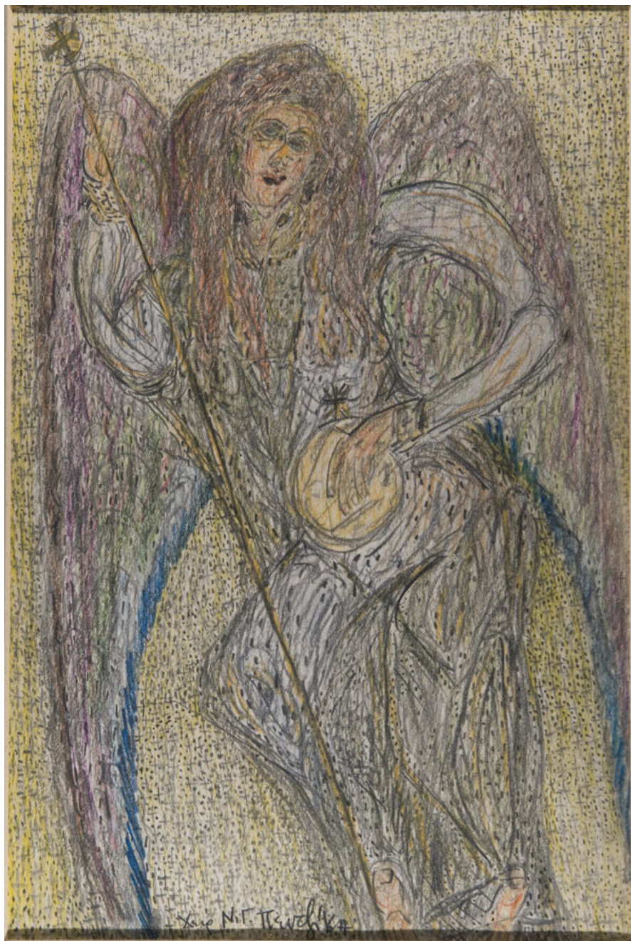
Ν.Γ.Πεντζίκης. Άγγελος, χ.χ. 24Χ16 εκ.

Τον Θ' π.Χ. αιώνα, δηλαδή σ' εποχή κοντινή με την σύνταξη των ομηρικών επών, ο ασεβής βασιλιάς Ἀχάβ, παροτρυνόμενος απ' την φυσικώς έμορφη, καταγόμενη εκ Φοινίκης, σύζυγό του Ἰεζάβελ, υποκατέστησε την θρησκεία του Ιεχωβά των Ισραηλιτών δια της λατρείας του Βαάλ. Τότε, λοιπόν, ο Ἅγιος Ηλίας ο Θεσβίτης, υπεραμυνόμενος της πατροπαραδότου θρησκείας, ανακράζει: «Νυν δικάσω εγώ υπέρ του Κτίστου, ασεβείς δε της γης εξολοθρεύσω και ψηφίσομαι τιμωρίαν», σύμφωνα προς όσα αναγινώσκουμε στου Αγίου Ρωμανού του Μελωδού το ποίημα, πιστή ερμηνευτική αναδρομή εις τα της Αγίας Γραφής. Ο Προφήτης οργισμένος, δεσμεύοντας την θεία βούληση δια του όρκου «ζη Κύριος», αποφαίνεται πως