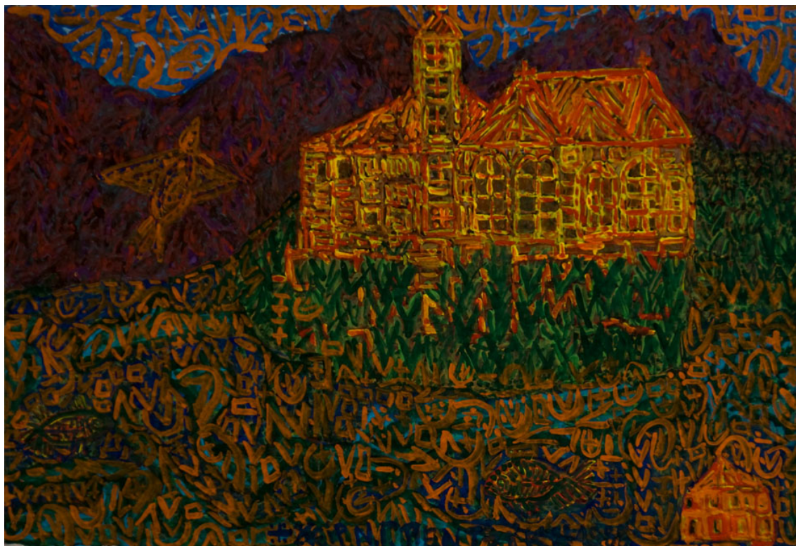
Ν.Γ.Πεντζίκης. Βατοπαιδινό Μετόχι στο Πόρτο Λάγος, 1988, τέμπερα σε χαρτόνι 24Χ35 εκ.

Παράδειγμα άριστο προς μίμηση αποτελεί ο Μέγας Άγιος Άρχιεπίσκοπος Θεσσαλονίκης και δεύτερος Πολιούχος της, Γρηγόριος ο Παλαμάς, που αδίστακτα, χωρίς ουδαμώς να εκφύγει της αληθείας της πίστεώς του εις Χριστόν, συνεζήτησε με Μωαμεθανό Πασά στην Προύσα. Η πίστη μας εν Κυρίω τω Χριστώ δεν είναι έννοια εκφραζομένη, αλλά αληθώς όλο το σώμα μας εις το ακέραιο. Το σώμα μας σκέφτεται και αγαπά τον Χριστό και όχι μόνο η γλώσσα. Στις πόλεις ζώντας με τις αισθήσεις μας ακέραιες, εξ αδυναμίας, χρειαζόμαστε την ομορφιά των ειδώλων, προκειμένου να βοηθηθούμε στην πορεία μας προς τον Κύριο των Δυνάμεων. Έξ αυτού, λοιπόν, το τέχνασμά μου ν' αναφερθώ στον ποιητή που πεπαίδευκε την Ελλάδα. Μια και συσχετιστίσαμε προς την Προσευχή την θάλασσα, είναι εύκολο να φανταστούμε την μητέρα του Άχιλλέως Θέτιδα (όταν ακούει στο μέγα υποθαλάσσιο άντρο να θρηνεί ο γιος της), ν' αναδύεται από τα νερά μαζί με τις αδελφάδες της, που η κάθε μια έχει όνομα χαρακτηριστικό της απάνω στην θάλασσα φοράς των ανέμων (συμβολικής εικόνας της επί των υδάτων πνοής του Κυρίου), προσερχόμενη αρωγός και παρήγορος. Με την μεσολάβησή της ετοιμάστηκε από τον Ήφαιστο, στο εργαστήριό του, η δευτέρα πανοπλία, που σαν σύνολο την ταυτίσαμε με το Άγιο Βουνό, της οποίας, ως είναι γνωστό, η ασπίδα, ωραιοτάτη φέρει αναπαράσταση, συμβολίζουσα όλες τις εγκόσμιας ζωής εκδηλώσεις των ανθρώπων.