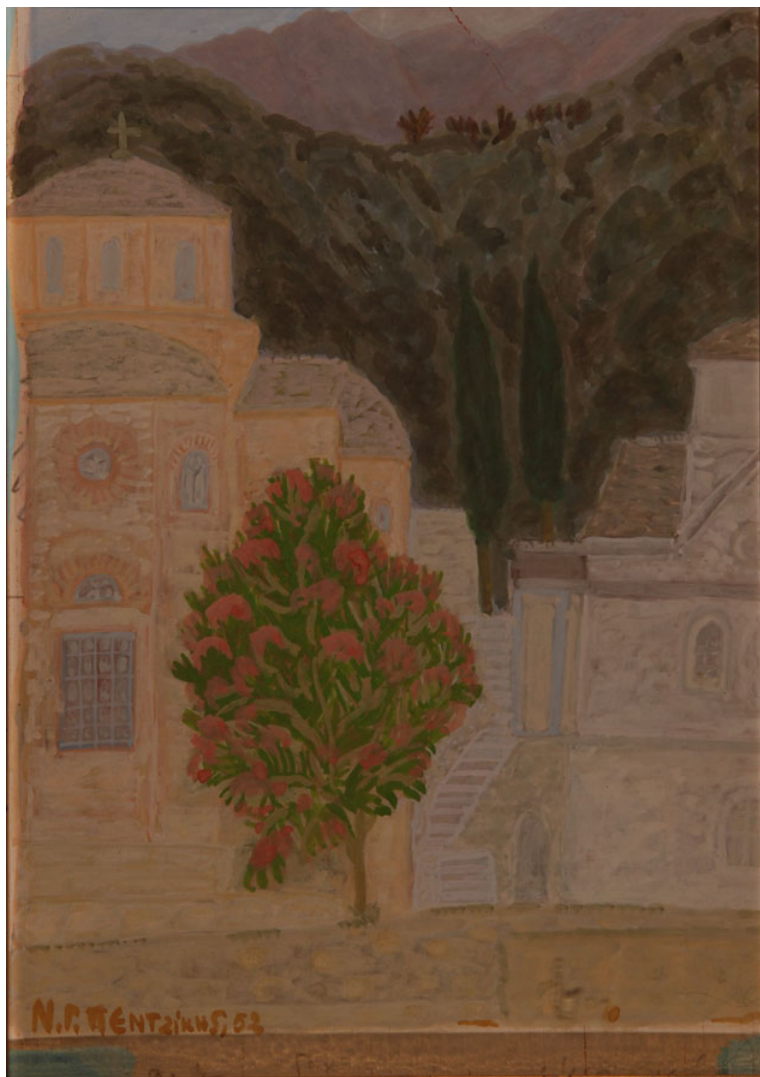
Ν.Γ.Πεντζίκης. Το καθολικό στα καυσοκαλύβια. 1952, τέμπερα σε χαρτόνι 22Χ16 εκ.

Στους νάρθηκες των Ναών, των Ιερών Μονών, Σκητών, Καλυβίων και Καθισμάτων του Αγίου Όρους, μας δίνεται η ευκαιρία να παρακολουθήσουμε στις τοιχογραφίες τον τρόπο του εναγκαλισμού και σωματικής επαφής, υπό των αδελφών Μοναχών, του μεταστάντος, για να βοηθηθούμε στην κατανόηση του τι σημαίνει η εν απολύτω φυσική αδυναμία κατάκλιση του ζώντος ανθρώπου επί του νεκρού.