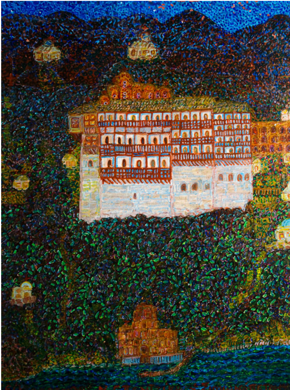
Ν.Γ.Πεντζίκης. Η Σιμωνόπετρα, 1980, τέμπερα 63Χ39 εκ.

σκέψεως, στο βάθος της ησυχίας, μετά την κάθαρση της ψυχής, στην άβυσσο απορρήτων και εξαισίων θεωριών, με θεληματική ταπείνωση και ευθυτένιση και αγάπη, αποτελεί σύστημα παραβαλλόμενο προς τα συστήματα των θαλασσών και το πολύ νερό. Όσοι εν ταις ημέραις μας θρηνεείτε προσφιλείς ναυαγούς, ψηλώνοντας τον νου σε όσα εκφράζει ο Άγιος Πατήρ, για να αλλάξετε ενδύματα μετατρέποντα το πένθος σε γεμάτη ελπίδα χαρά, καταλάβετε τι απέραντο πέλαγος είναι μέσα μας η προσευχή, η δύναμη με την οποία επικαλούμεθα το έλεος του Πανάγαθου.