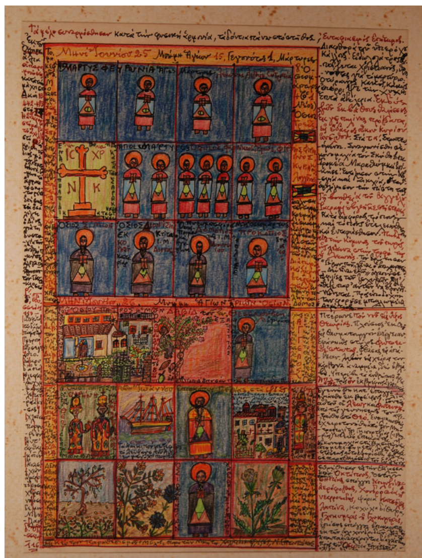
Ν.Γ.Πεντζίκης. Μηνί Ιουνίου 25, 1969, τέμπρα σε 26,5X19,5 εκ.

Δηλαδή ότι η όλη προσπάθεια του διαλόγου μεταξύ Θεού και Προφήτου και όταν τα άγρια κοράκια μετατρέπονται σε φιλεύσπλαχνους παροχείς τροφής και όταν τα άδεια ντουλάπια της χήρας, εν καιρώ λιμού, γεμίζουν σιτία, κατ' ουσίαν δεν είναι άλλη από την καταστροφή της φυσικής, έτοιμης, γονικής πανοπλίας, ώστε να μπορέσει ο άνθρωπος να ντυθεί την δεύτερη στολή.