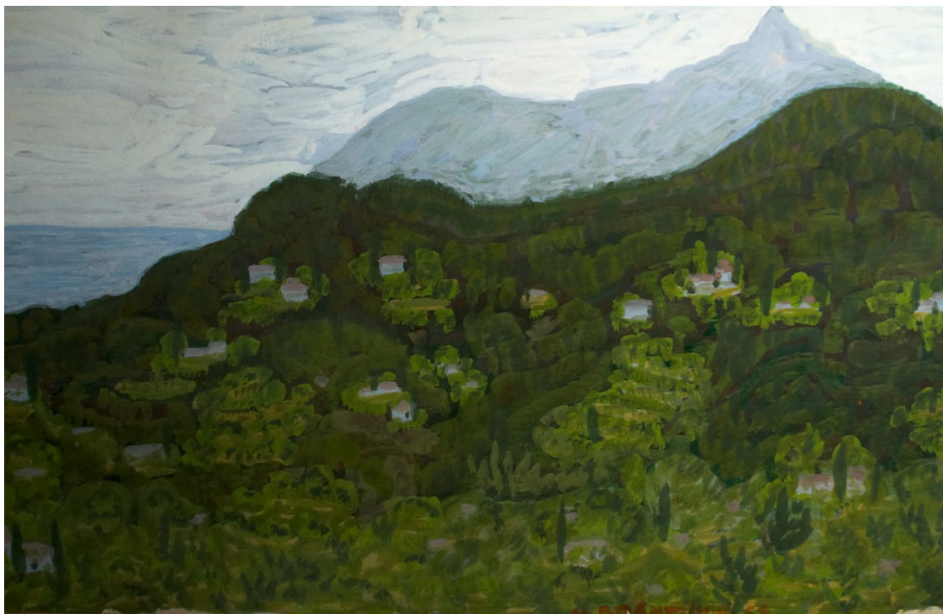
Ν.Γ.Πεντζίκης. Ο Άθως από τη Μονή Κουτλουμουσίου, τέμπερα σε χαρτόνι 22,5Χ33 εκ.

Τι μπορεί να πει κανείς για τον Άθω τριγυρνώντας στους δρόμους μιας σύγχρονης πόλης; Μήπως θα πρέπει ν' αρχίσω αναφέροντας την έκταση του γεωγραφικού χώρου σε τετραγωνικά χιλιόμετρα;