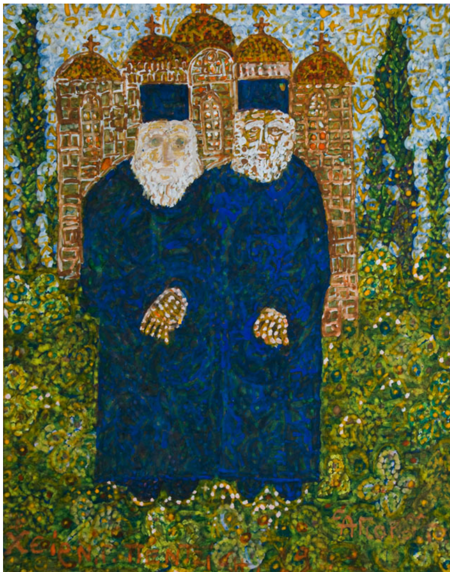
Ν.Γ.Πεντζίκης. Ηγούμενος και Ερημίτης. 1982, τέμπερα σε χαρτόνι 25,2Χ20 εκ.

Γερά στερεωμένη στην επιστήμη, η λογική πληροφόρηση του σύγχρονου ατόμου, δεν επιτρέπει εύκολα στις συγκινήσεις και την σκεπτική τους συνάρτηση να διατρυπήσουν την φυσική πανοπλία, που λαβαίνομε από τους γονιούς μας, όταν μας φέρνουν στον κόσμο.