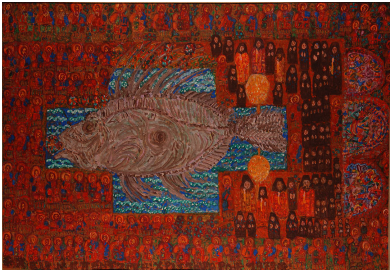
Ν.Γ.Πεντζίκης. Χριστόπαρο, 1978, τέμπερα σε χαρτόνι 25Χ36,5 εκ.

Θα μας διευκόλυνε πολύ αν αυτόν τον προβληματισμό του βίου και της σκέψης τον συνδέαμε με ο,τι κατέστη συνήθεια να λέγεται πάλι προς τον δαίμονα.