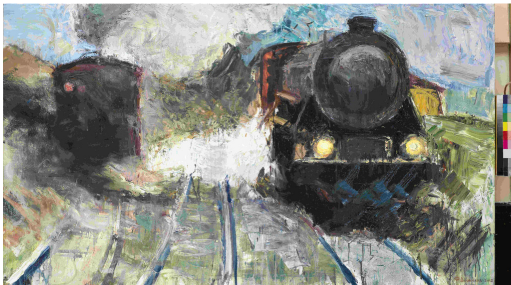
Φραγκίσκος Δουκάκης, 125x225cm

Σε ό,τι αφορά στον στόχο της έκθεσης, ο Φραγκίσκος Δουκάκης επισημαίνει: