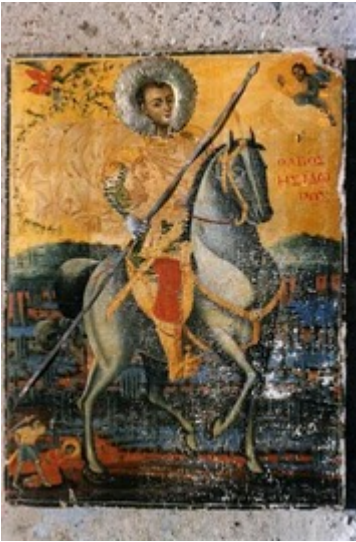
Άγιος Ισίδωρος που μαρτύρησε στη Χίο