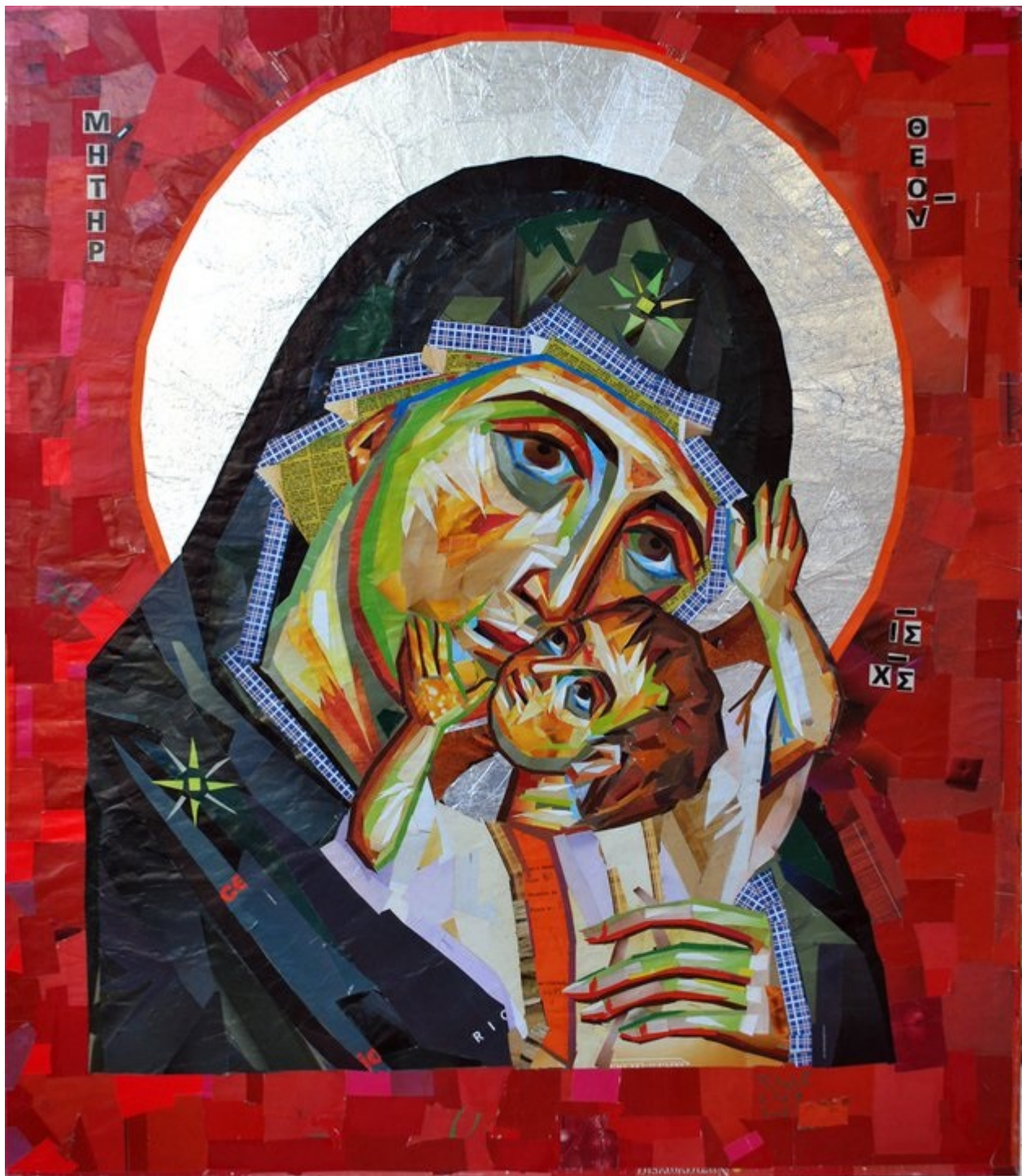
«Madonna della tenerezza» 87 x 100 cm collage

Με ποιον τρόπο λειτουργείτε, πως δομείτε την σκέψη σας, τα υλικά και τελικά πως εκφράζεστε;