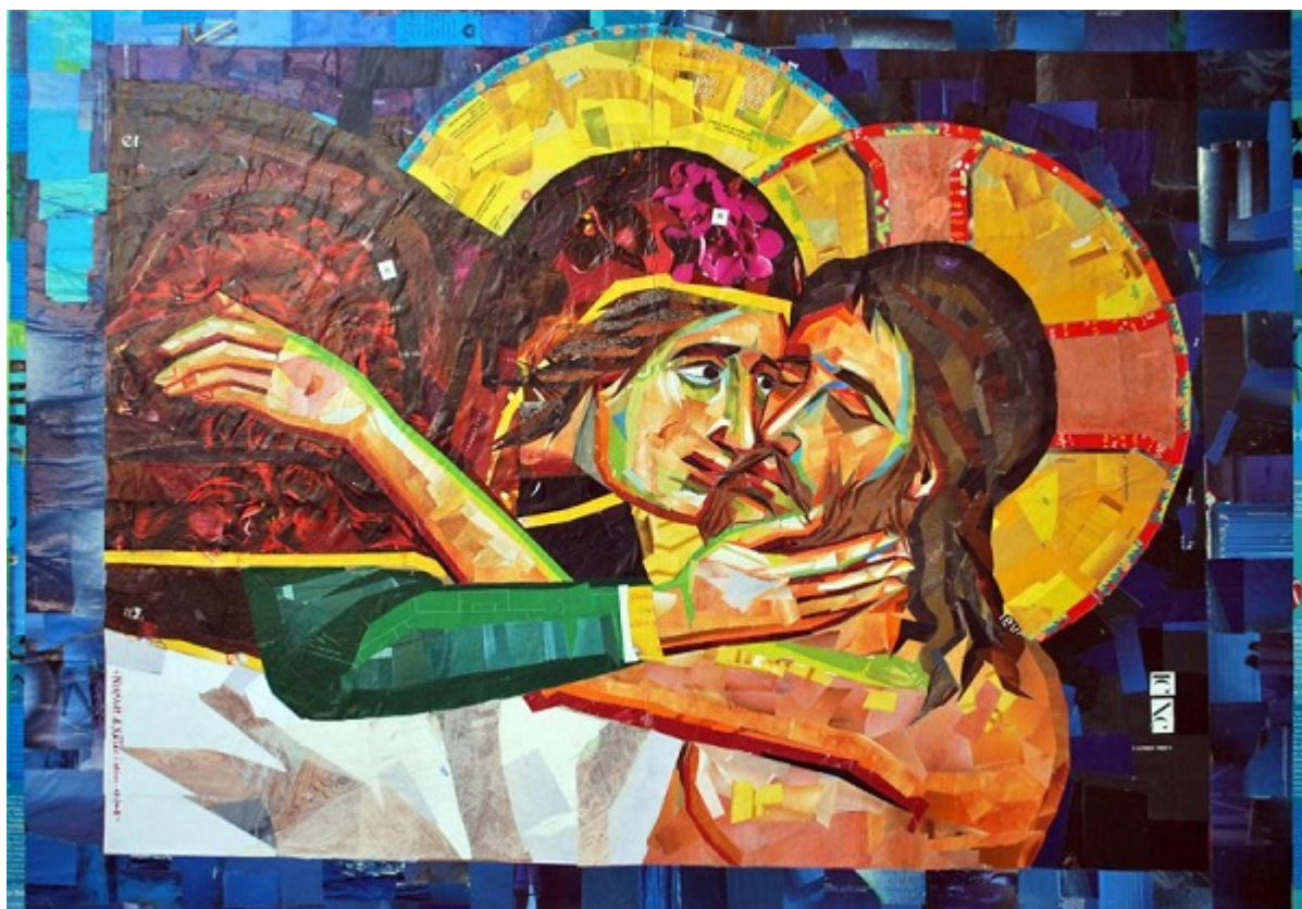
«Il bacio della passione di Cristo», part. 95 x 120 cm collage