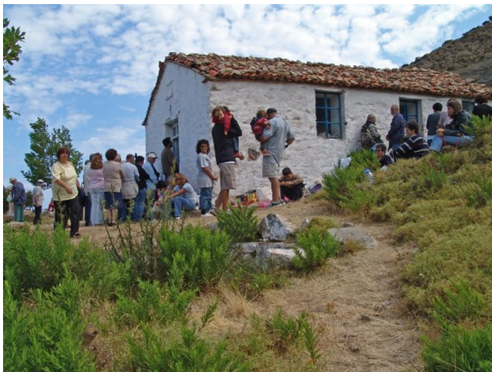
Στην Ίμβρο, φωτο 4

Πεμπτουσία: Θα μπορούσε να πει κανείς ότι ο σκοπός της εκδήλωσης είναι διττός: Καλλιτεχνικός και πατριωτικός; Παρεξηγημένες έννοιες και οι δύο στις μέρες μας.