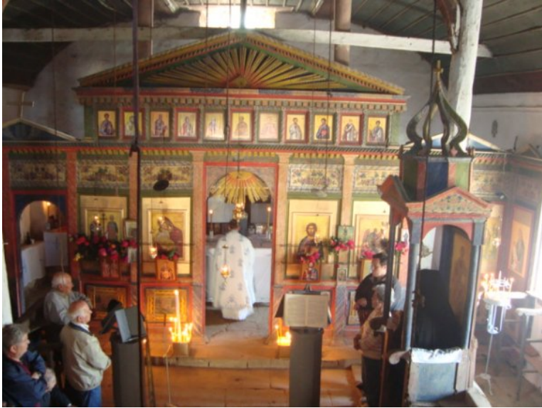
Στην Ίμβρο, φωτο 3

θα θέλαμε να τεθούν υπό την αιγίδα της Ιεράς Συνόδου.