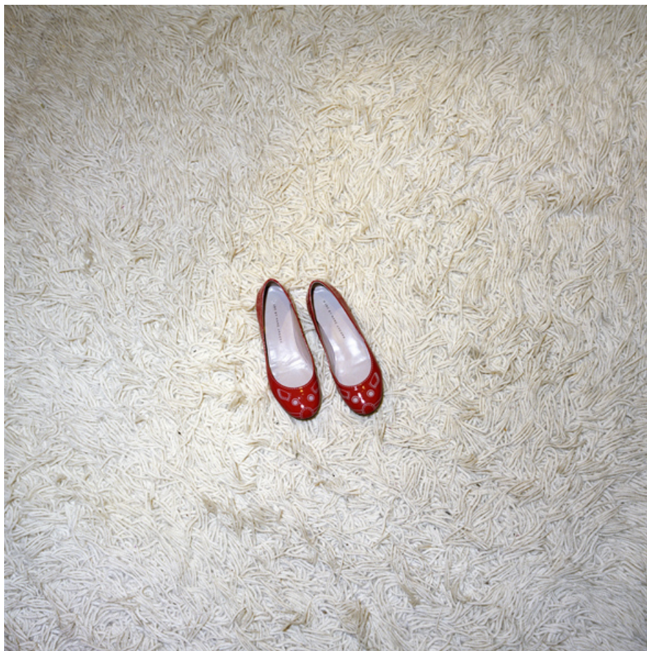
FYSAKIS, για την λέξη Ιθάκη

Στην έκθεση παρουσιάζονται έργα των παρακάτω εικαστικών, με τις αντίστοιχες λέξεις: