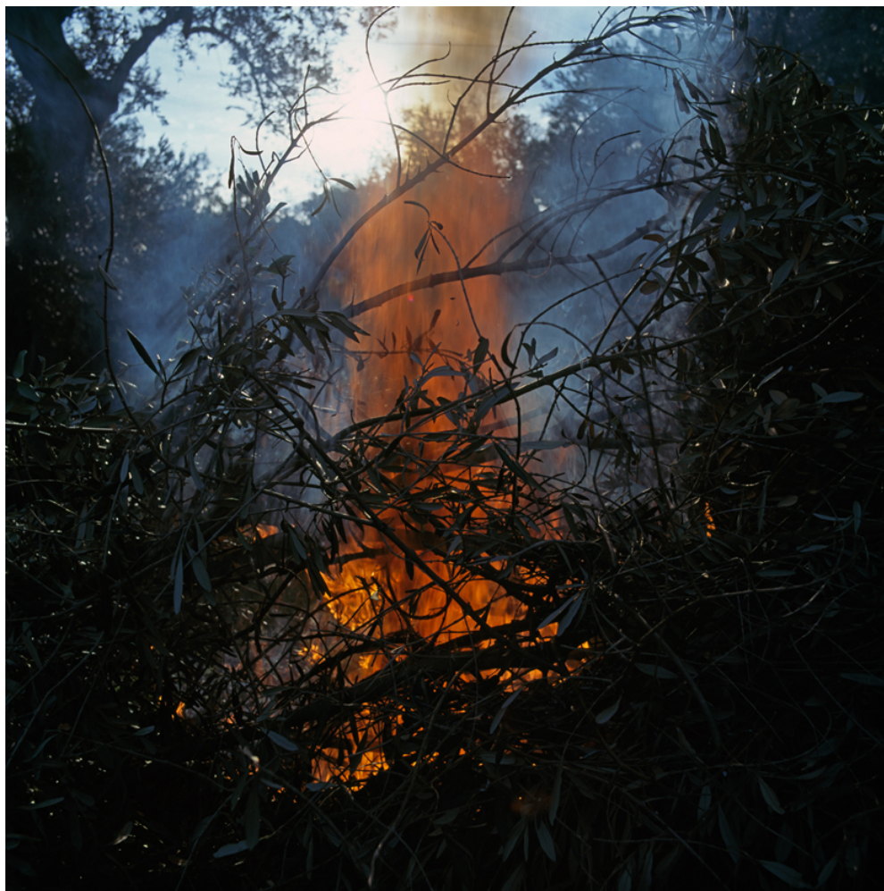
NOLLAS, για την λέξη Ύβρις

Υπάρχουν επίσης λέξεις που αντιπροσωπεύουν ιδέες ή επινοήσεις όπως η λέξη Χάρτης (ο αρχαίος φιλόσοφος Αναξίμανδρος ήταν ένας από τους πρωτοπόρους της χαρτογραφίας), αλλά δεν είναι ευρέως γνωστές.