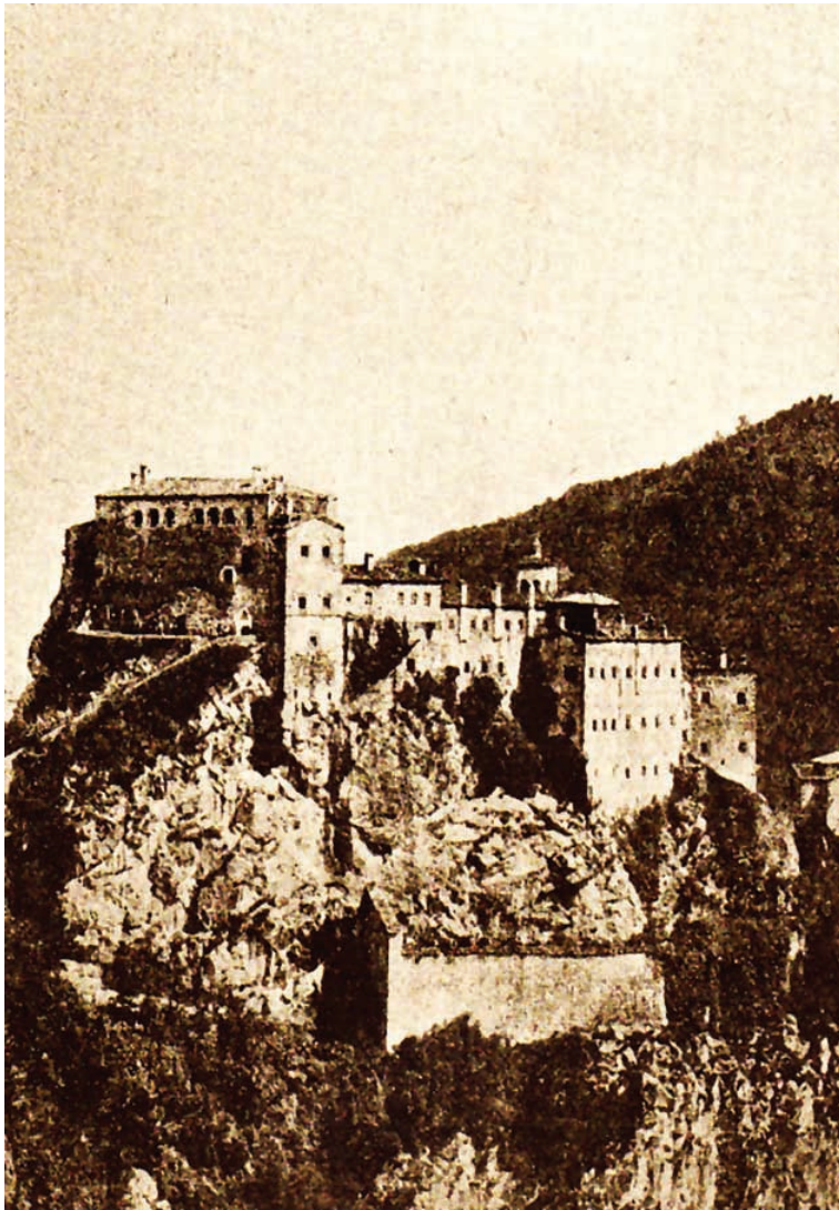
Ι.Μ. Αγίου Γεωργίου Περιστερώτα.

Όμως το τέλος είναι προδιαγεγραμμένο. Ο Κεμάλ μετά την ολοκληρωτική νίκη του θα αναφωνήσει στις 13 Αυγούστου του 1923, γεμάτος ικανοποίηση και ανακούφιση: «Επιτέλους, τους ξεριζώσαμε»!