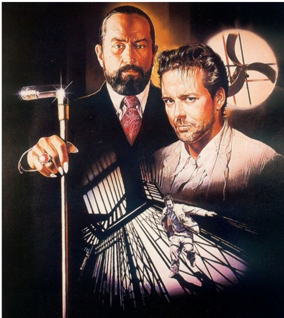
Από τη διαφημιστική αφίσα της ταινίας «Δαιμονισμένος άγγελος»

Θα μπορούσαμε να καταγράψουμε ακόμα δεκάδες ταινίες[72], που προβλήθηκαν κατά καιρούς από το κινηματογράφο και την τηλεόραση και οι οποίες αναφέρονται στον υπέρτατο άρχοντα του κακού, το διάβολο, την εικόνα του οποίου επιχειρούν να εξωραΐσουν. Στο δικηγόρο του διαβόλου, με τον Αλ Πατσίνο, το μότο του ζάπλουτου, πανίσχυρου και πρώτου πολίτη της Νέας Υόρκης μίστερ Μίλτον είναι πως το « κακό έχει πάντα τον τρόπο του να νικάει! ». Στο ερώτημα που τίθεται για το « τι είναι τελικά ο Διάβολος; », η απάντηση που δίδεται είναι « ο καλύτερος φίλος του ανθρώπου ». Η ταινία τελειώνει με την ατάκα του Αλ Πατσίνο: « η ματαιοδοξία είναι το αγαπημένο μου αμάρτημα ! ».