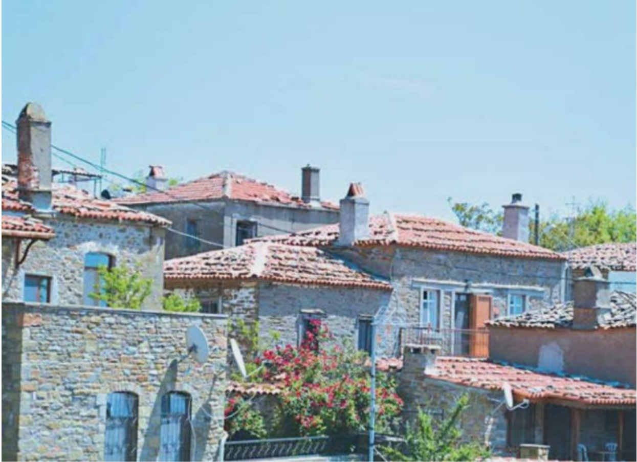
Άγριδια: Το μόνο ελληνικό σήμερα χωριό

Η οδύσσεια των Ελλήνων της Ίμβρου και της Τενέδου άρχισε τον Μάιο του 1964 με το «Πρόγραμμα Ανάλυσης» του Αριστείδη Βικέτου