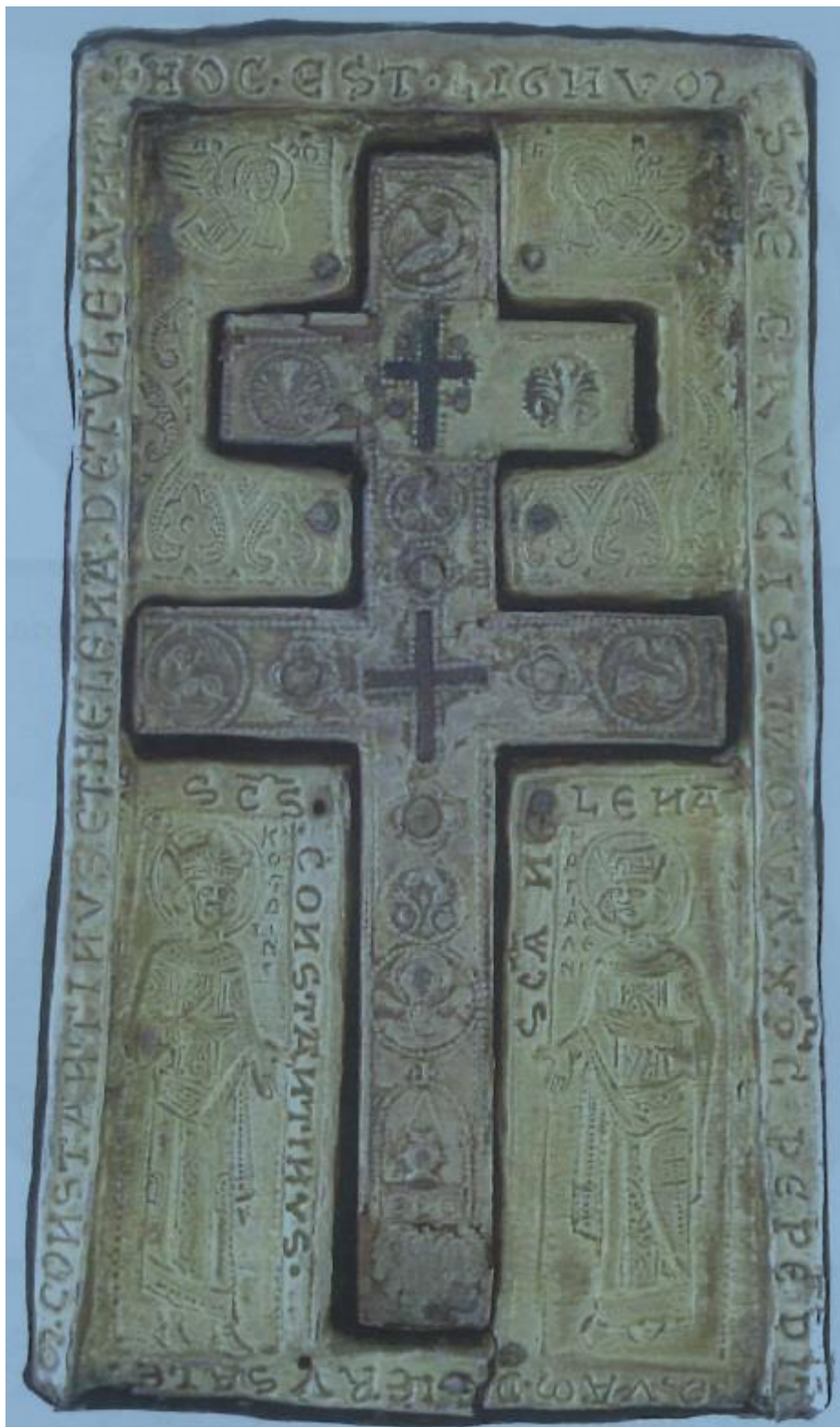
4. Σταυροθήκη τιμίυ ξύλου, που φέρει εκατέρωθεν τις μορφές των Αγίων Κωνσταντίνου και Ελένης

Την άνοιξη του 312, ο Κωνσταντίνος άρχισε τον πόλεμο κατά του Μαξεντίου, τον ενίκησε και τον εθανάτωσε στην Μουλβία Γέφυρα (28 Οκτωβρίου 312). Πριν από τη νίκη του αυτή ο Άγιος Κωνσταντίνος αξιώθηκε να δει, μεσημβρινή ώρα, και ενώ ο ήλιος έλαμπε, το σημείον του Τιμίυ Σταυρού, αποτελούμενον από αστέρια και άκουσε εξ ουρανού την φωνήν «τούτω νικά», δηλαδή «με την δύναμη του σημείου