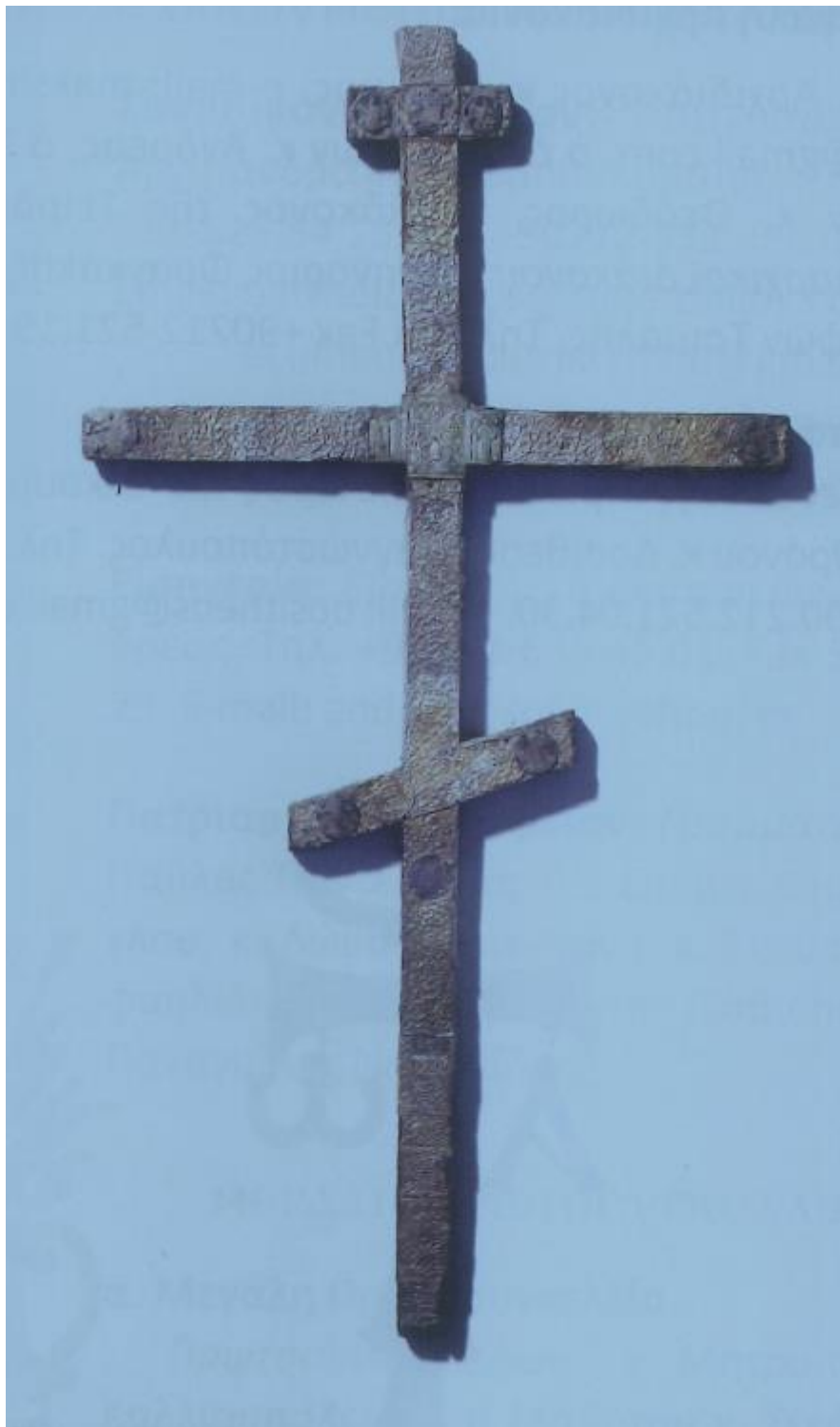
3. Σταυρός του Μ. Κωνσταντίνου, Ι. Μ. Βατοπαιδίου

και ο Μαξέντιος συνήψαν συμμαχία με τον Κωνσταντίνο κατά του Γαλερίου, ο δε Κωνσταντίνος διεζεύχθηκε την Μινερβίνα και έλαβε σύζυγον την Φάυστα, θυγατέρα του Μαξιμιανού, που ήταν φημισμένη για την ομορφιά της αλλά και για την πονηρία της, και ανεγνωρίσθη το 307 Αύγουστος από τον Μαξέντιο και τον Μαξιμιανό, πράγμα όμως που δεν ανεγνώρισε η Ανατολή. Κατόπιν, ο Μαξιμιανός ήλθε σε ρήξη με τον Μαξέντιο και κατέφυγε στον Μέγα Κωνσταντίνο στην Γαλατία.