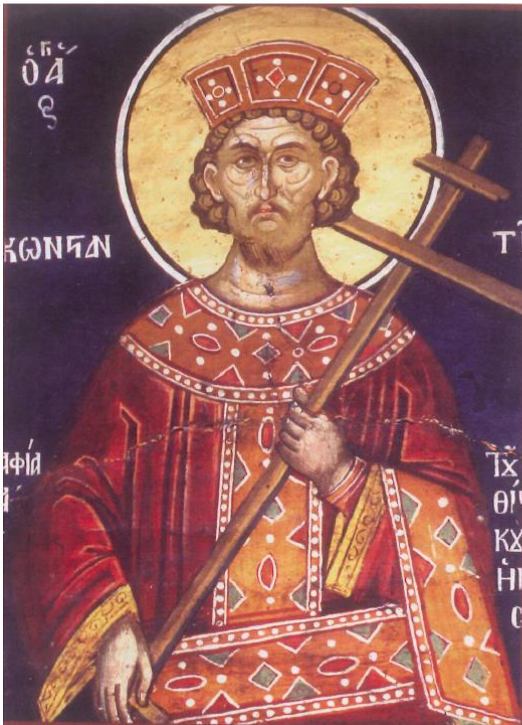
1. Ο Άγιος Κωνσταντίνος, τοιχογραφία εκ του παρεκκλησίου της Παναγίας του «Ακαθίστου», της Ιεράς Μονής του Αγίου Διονυσίου του Αγίου Όρους (16ος αιών)

Ο Άγιος και Ισαπόστολος Κωνσταντίνος ο Μέγας εγεννήθη στην Ναϊσσόν (Νίκαια-Δακία) της σημερινής Σερβίας, στις 20 Φεβρουαρίου, όχι προ του έτους 280. Ήταν υιός του Καίσαρος Κωνσταντίου του Α΄ που είχε Ιλλυρική καταγωγή και της Αγίας Ελένης, που γεννήθηκε στην πόλη Δρεπάνη της Βιθυνίας. Εκοιμήθη την 22αν Μαΐου του 337 στον Χάρακα της Νικομήδειας. Ανετράφη στην αυλή του Διοκλητιανού και του Γαλερίου στην Ανατολή. Καίτοι όμως βρισκόταν ανάμεσα σε τυράννους και ασεβείς δεν επηρεάστηκε από αυτούς χάρη στην χριστιανική ανατροφή που του