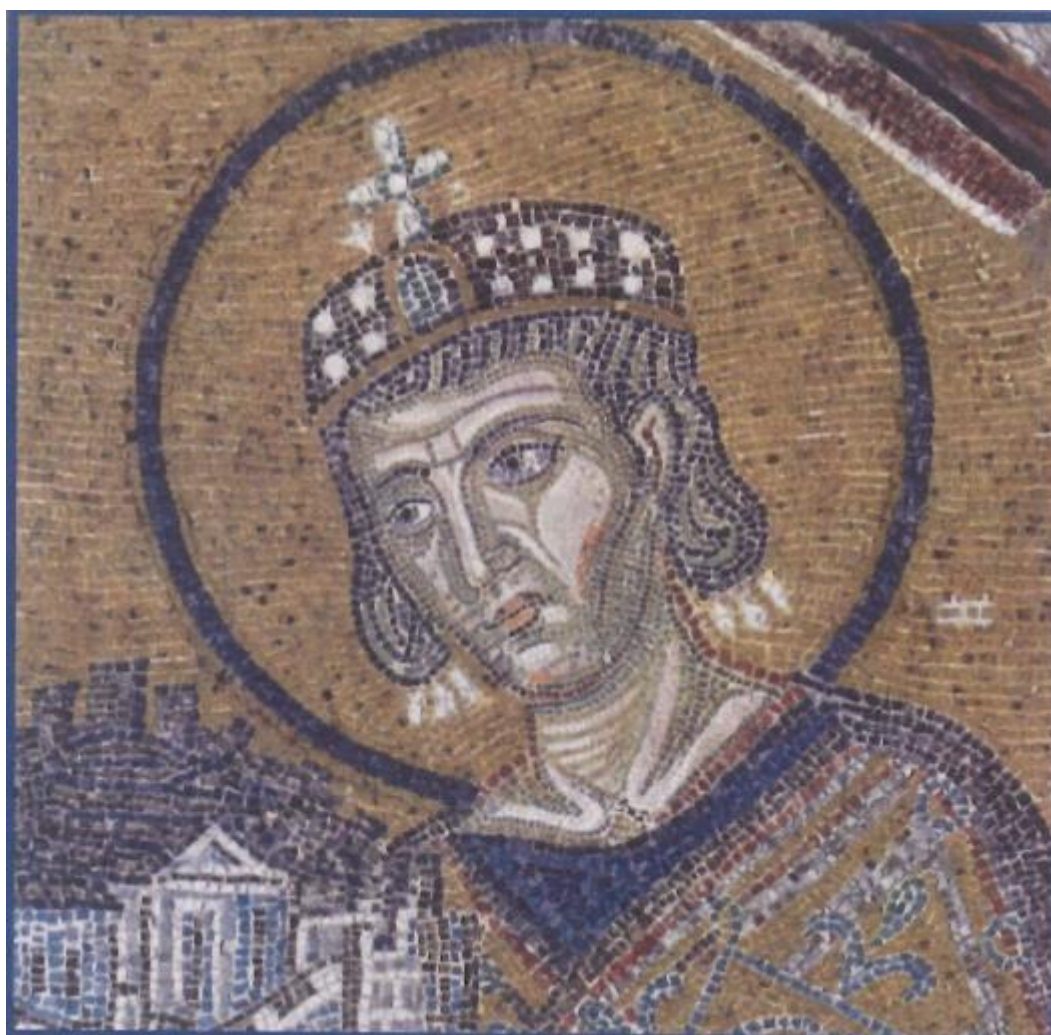
2. Ο Μέγας Κωνσταντίνος ενώπιον της Θεοτόκου κρατών και αναθέτων εις αυτήν την Βασιλεύουσαν (Λεπτομέρεια ψηφιδωτού της Αγίας Σοφίας)

είχε δώσει η μητέρα του Αγία Ελένη. Οι τύραννοι που τον ζήλευαν αφάνταστα, ρώτησαν το μαντείο του Απόλλωνος για το μέλλον του. Και το μαντείο απάντησε ότι αν το επιτρέψει ο Θεός ο Κωνσταντίνος θα κυριεύσει τον κόσμο ολόκληρο και θα κηρύξει τον Χριστόν ως Θεόν. Ο Μέγας Κωνσταντίνος ενυμφεύθη την Μινερβίνα από την οποία απέκτησε τον υιό του Κρίσπο. Μετά την παραίτηση του Διοκλητιανού και του Μαξιμιανού (1η Μαΐου 305), ο Κωνσταντίνος έγινε πρώτος Αύγουστος και κάλεσε τον υιό του Κωνσταντίνο στην Γαλατία και, όταν συναντήθηκαν του είπε: «Όπως ο Χριστός σε φύλαξε μέχρι τώρα από τις πλεκτάνες των εχθρών σου και σε έφερε ως άξιον στην κατάλληλη στιγμή για να αναλάβεις την βασιλεία, έτσι πιστεύω ότι θα σε βοηθήσει ως το τέλος, για να στερεώσεις παντού την χριστιανική πίστη». Μετά από λίγο πέθανε ο πατέρας του αγίου Κωνσταντίνος στο Εβόρακον (Υόρκη της Αγγλίας), και ο στρατός ανεκήρυξε τον Κωνσταντίνο αυτοκράτορα (25 Ιουλίου 306).