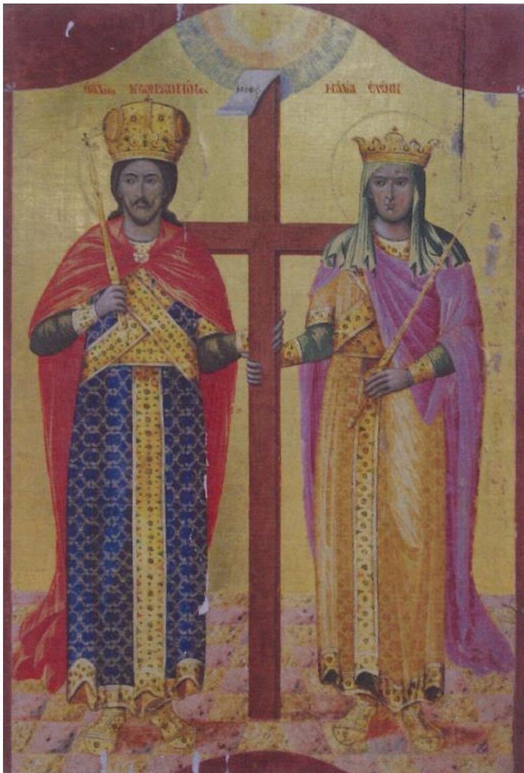
5. Ιερά Εικόν των Αγίων Ισαποστόλων Κωνσταντίνου και Ελένης (Καθολικόν Ιεράς Μονής Αγίας Τριάδος Χάλκης)

Το 315 ο Κωνσταντίνος και ο Λικίνιος ήταν Ύπατοι. Νέες διενέξεις μεταξύ των δύο, το 321, και εξ αιτίας του επαναληφθέντος διωγμού των Χριστιανών από τον Λικίνιο, προκάλεσαν τον δεύτερο πόλεμο μεταξύ των, στον οποίο νικήθηκε ο Λικίνιος στις 3 Ιουλίου 323 στην Αδριανούπολη και στις 18 Σεπτεμβρίου του ίδιου έτους στην Χρυσούπολη, οπότε και τον απέκλεισε στην Νικομήδεια. Με την