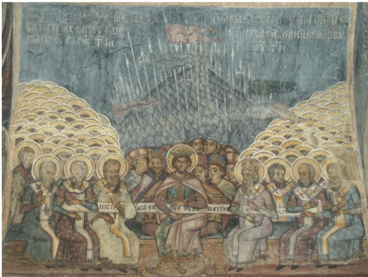
Απεικόνιση της Α΄ Οικουμενικής Συνόδου