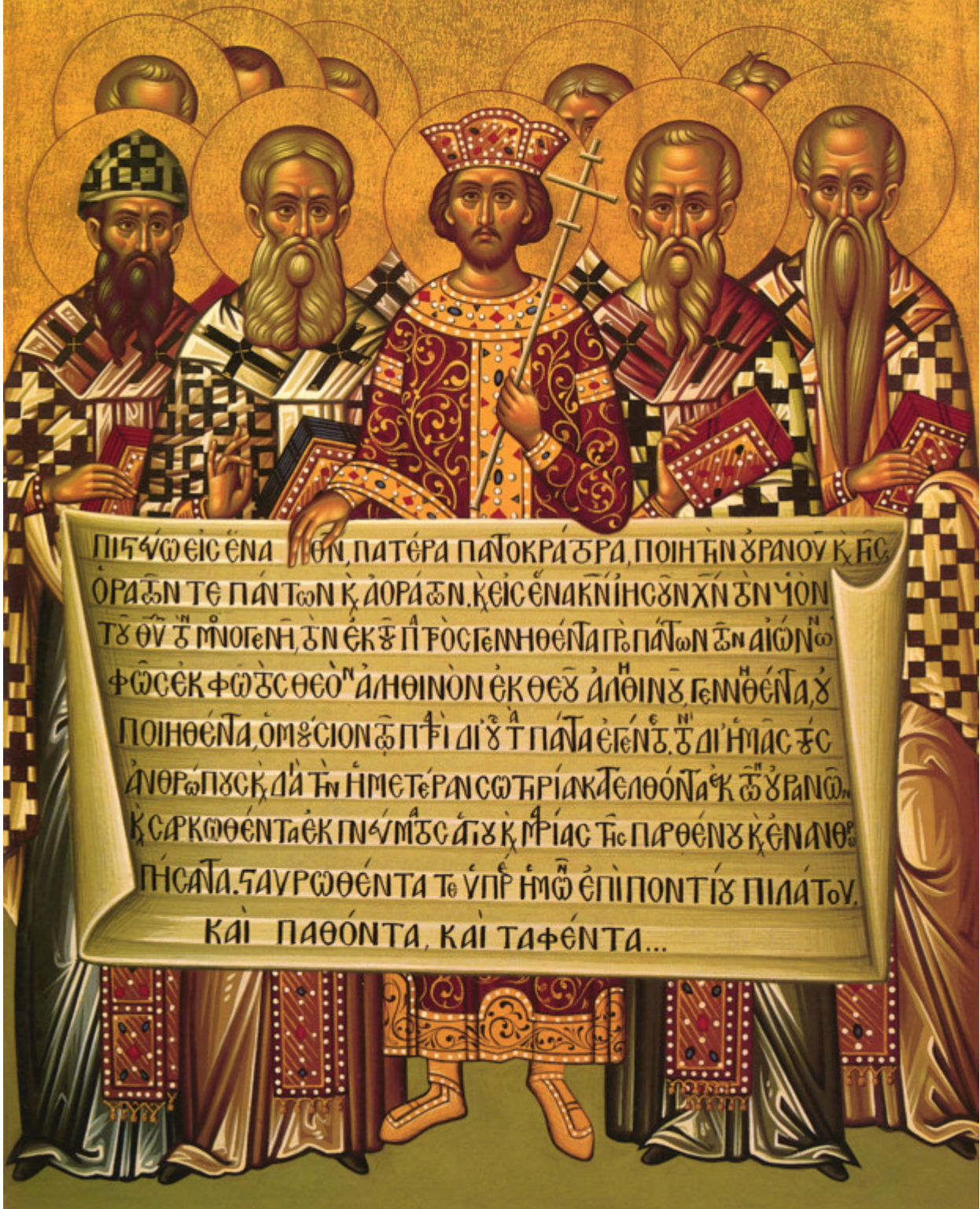
Ο Μέγας Κωνσταντίνος βρίσκεται στο κέντρο περιτριγυρισμένος από Εκκλησιαστικούς Πατέρες της Α' Οικουμενικής Συνόδου. Ο ρόλος περιέχει το πρώτο μισό του συμβόλου Πίστewς Νίκαιας - Κωνσταντινούπολης.