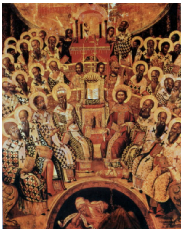
Μεταβυζαντινή εικόνα με θεολογική αναπαράσταση της Α΄ Οικουμενικής Συνόδου