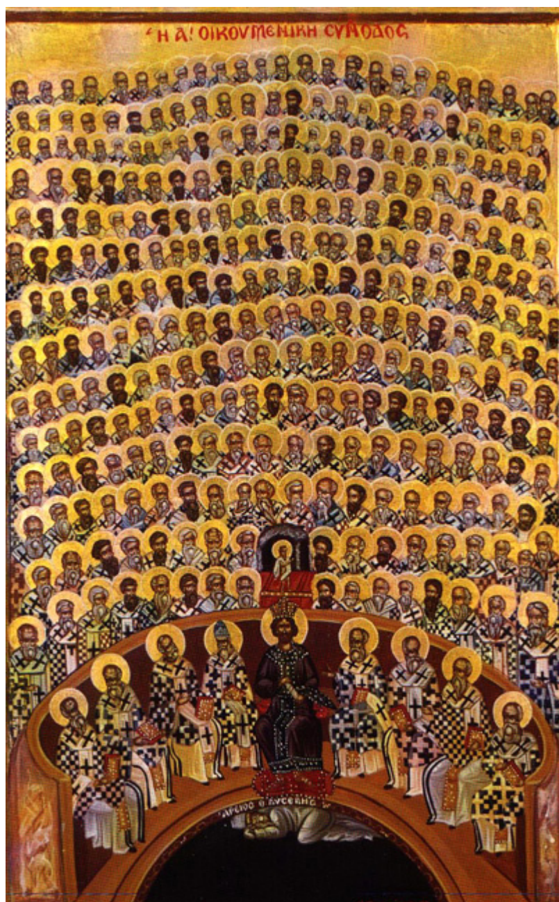
Απεικόνιση της Α' Οικουμενικής Συνόδου

(Μιχαήλ Δαμασκηνός, 1591, Μουσείο Αγίας Αικατερίνης Σιναΐτών, Ηράκλειο Κρήτης)