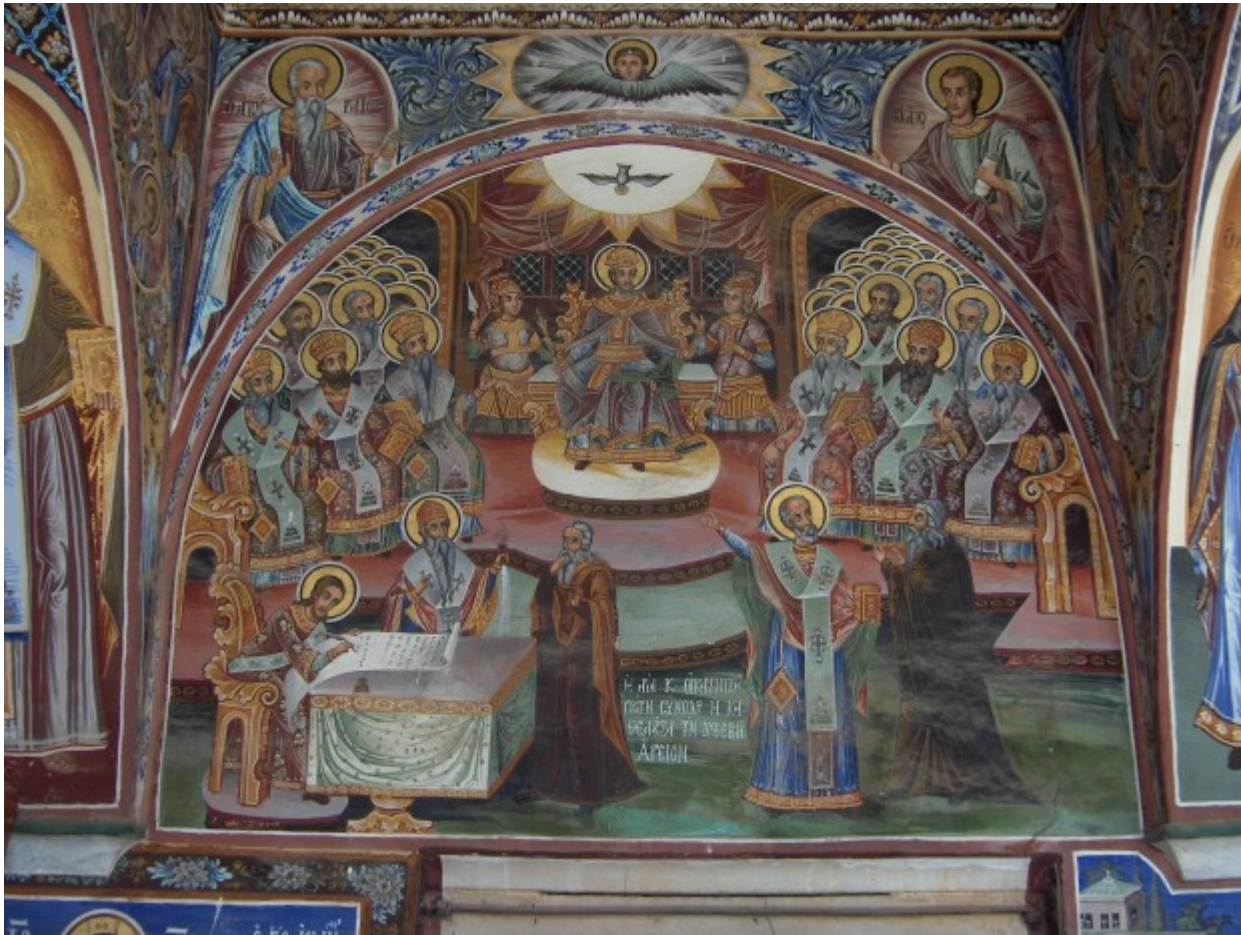
πεικόνιση της Α' Οικουμενικής Συνόδου - Άγιον Όρος, Μεγίστη Λαύρα