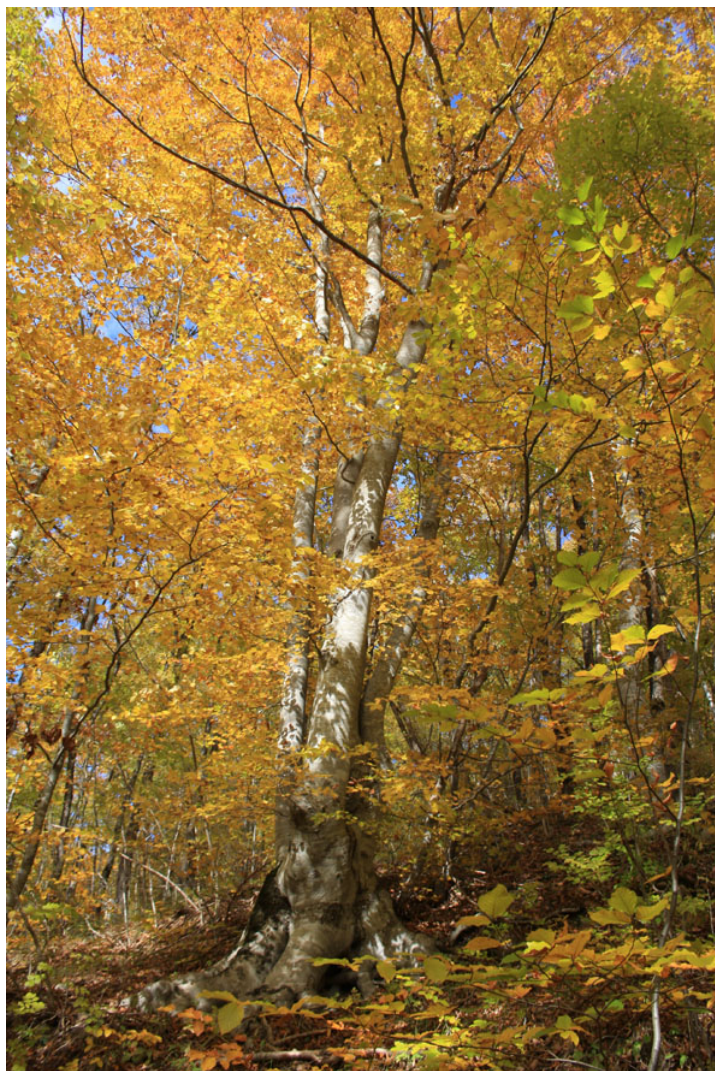
Οξιές στο Φαρασινό