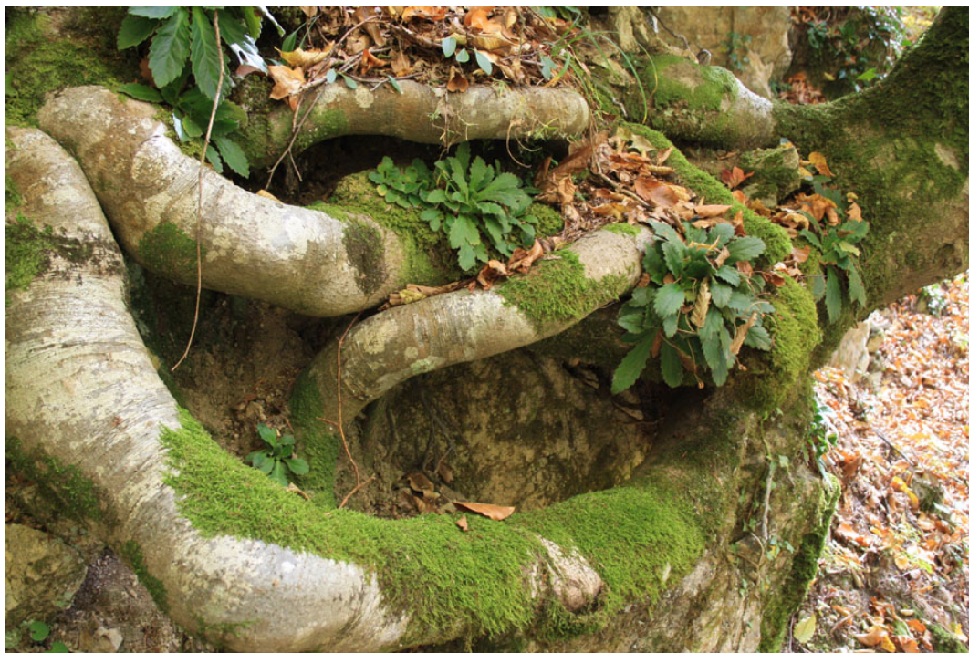
Haberlea rhodopensis σε ρίζες οξιάς

Το μονοπάτι, στρωμένο με πεσμένα φύλλα, δύσκολα ξεχώριζε σε μερικά σημεία από τις φορτωμένες με φύλλα πλαγιές πάνω και κάτω από αυτό. Το ρέμα πάντα δεξιά μας, πότε κοντά πότε απομακρυσμένο, επέτρεπε να αποτυπώσουμε μέσα από τα δένδρα και τις φυλλωσιές πανέμορφες εικόνες των μικρών λιμνών και καταρρακτών που δημιουργούσε. Στις βράχινες συχνά γρανιτένιες όχθες του, η βλάστηση ποικίλει και ανάμεσά της συχνή η παρουσία του Haberlearhodopensis , σπάνιου φυτού της προπαγετώνιας περιόδου. Το μονοπάτι συνεχίζει για δύο ώρες περίπου μέχρις ότου συναντούμε το περίφημο μονότοξο πέτρινο γεφύρι του Φαρασινού. Αλγεινή εντύπωση προκαλεί η παρουσία απορριμμάτων (πλαστικές σακούλες, ποτήρια, πιάτα, χαρτιά) εκεί, δείγμα προφανώς της αδιαφορίας που οι διοργανωτές δύο εκδηλώσεων Μαραθώνιου διενεργούν κάθε χρόνο. Γενικότερα, η εικόνα που δίνει όλο το μονοπάτι με τα πολλά πλαστικά ή και φωσφορίζοντα σήματα επάνω στα δένδρα και άλλου για τους δρομείς, πολύ απέχει από εκείνη που υπήρχε χρόνια πριν. Η παρέμβαση στη φύση, όταν γίνεται χωρίς γνώση και ευαισθησία, ασφαλώς δεν προσδίδει στη διατήρηση της ομορφιάς περιοχών όπως εκείνης του Φαρασινού ρέματος.