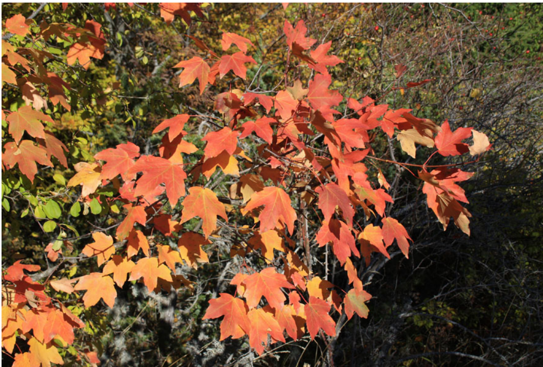
Τα χρώματα του Σφένδαμου

Το φθινόπωρο περισσότερο ίσως από άλλες εποχές, δίνει την ευκαιρία στους κατοίκους των αστικών κέντρων να γνωρίσουν και να θαυμάσουν την ομορφιά της φύσης όπως αυτή εκφράζεται από την ποικιλότητα των χρωμάτων των φυτών (κυρίως δένδρα και θάμνοι). Η αλλαγή του χρώματος των φύλλων που την εποχή αυτή συντελείται, είναι για ορισμένα τουλάχιστον είδη φυτών, πολύ εντυπωσιακή.