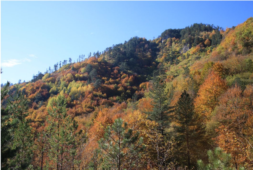
Φθινοπωρινά χρώματα στη Ροδόπη

ορεινά κυρίως μέρη της Ελλάδος, έχουν ασφαλώς αποκομίσει και νοιώσει όμορφες εμπειρίες και συναισθήματα.