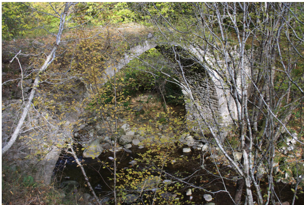
Το γεφύρι του Φαρασινού το Φθινόπωρο

Λίγο μετά το γεφύρι, βλέπουμε να ξεπροβάλει μέσα από την πυκνή βλάστηση, το Αετόρεμα, που βιαστικά συμβάλει με το Φαρασινό ρέμα.