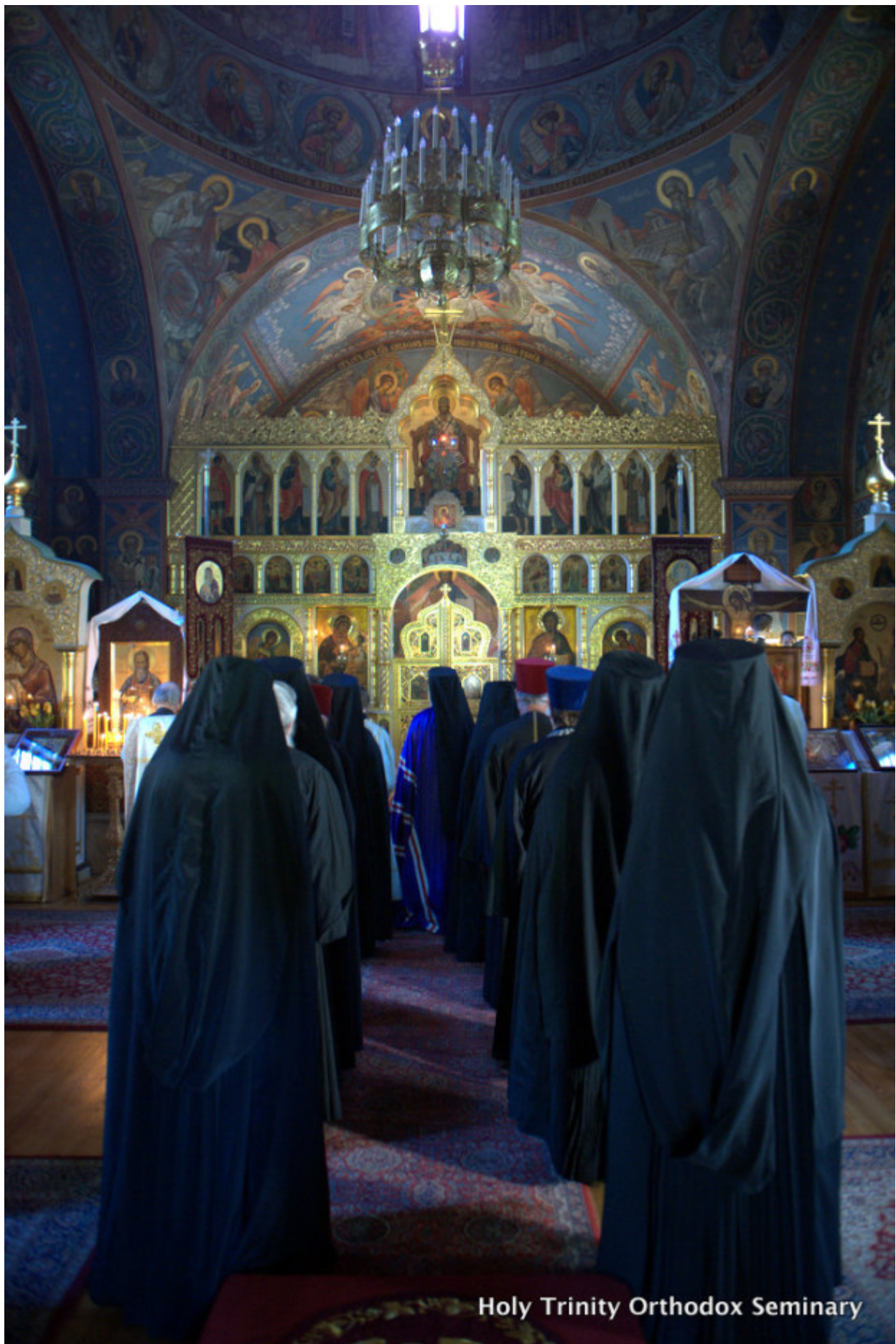
Holy Trinity Orthodox Seminary