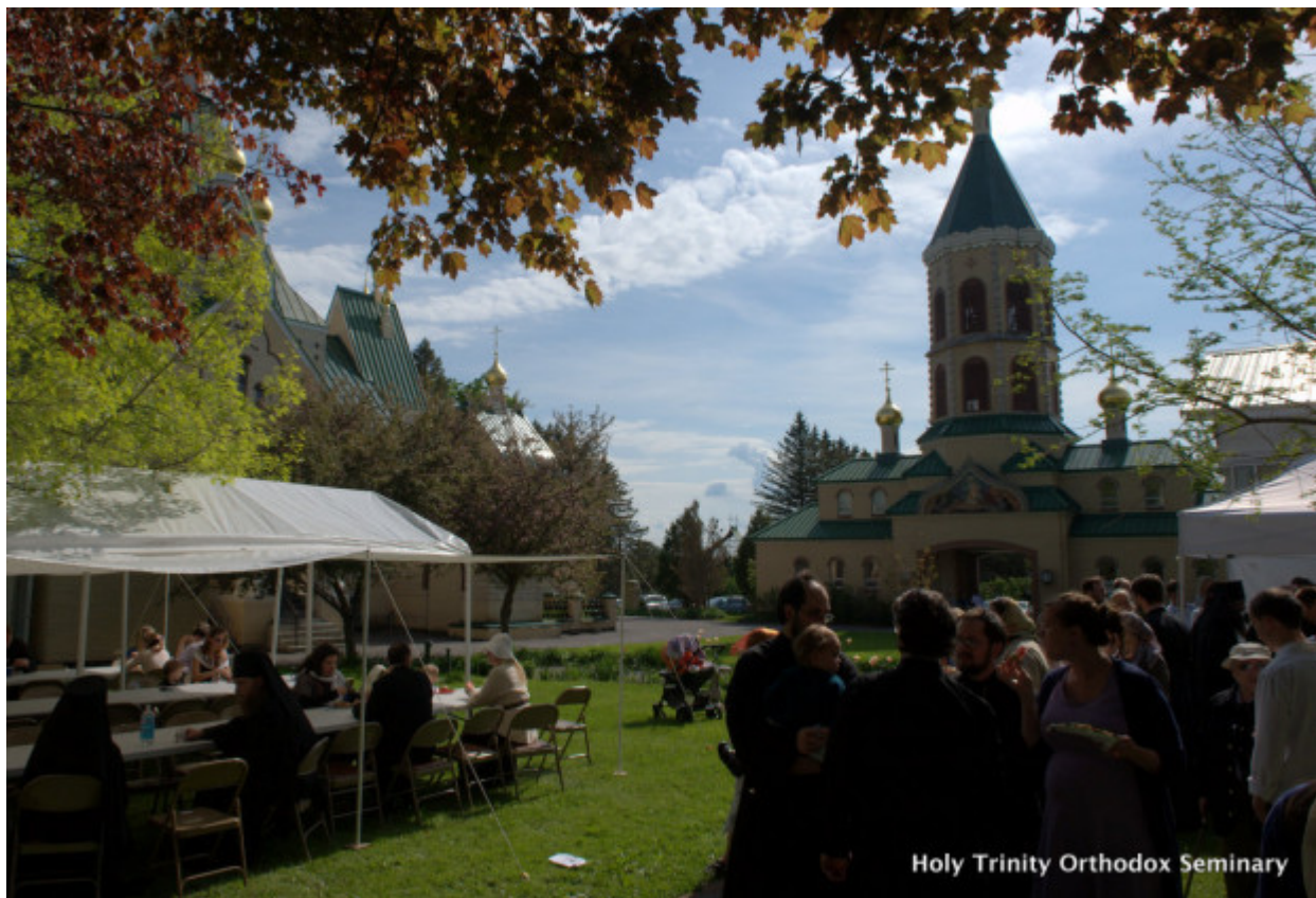
Holy Trinity Orthodox Seminary