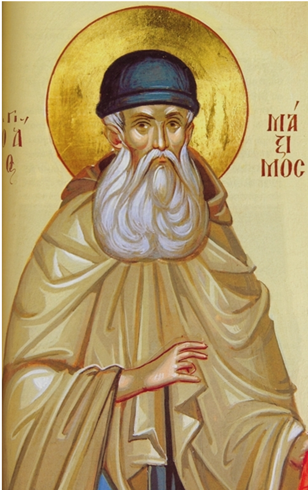
Ο Άγιος Μάξιμος ο Βατοαπιδινός, ο εξ Ιθάκης, ο Νέος Ομολογητής, εθναπόστολος των Ελλήνων και φωτιστής των Ρώσων ο επιλεγόμενος Γραικός

Πραγματικά, στις 2 μ.μ. της 3 Ιουλίου του 1996 ανέσυραν με προσοχή και ευλάβεια τα ιερά οστά και τα τοποθέτησαν σε μεγάλη ξύλινη θήκη προσωρινής λάρνακας για τη μεταφορά τους, τα εκάλυψαν δε με λαμπροκεντημένα άμφια μεγαλοσχήμονα μοναχού. Τη στιγμή εκείνη οι καμπάνες ηχούσαν χαρμόсуνα και άρχισε να