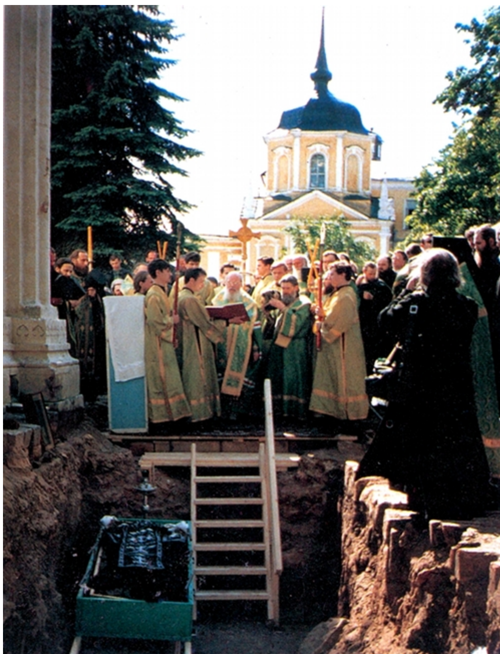
Μεγάλη ιστορική φωτογραφία. Η τελετή της Ανακομιδής των ιερών λειψάνων του Αγίου των Ρώσων και ελλήνων Μαξίμου του Γραικού.

Ήταν οι δέουσες τιμές των Ρώσων στον προσάτη και φωτιστή τους Έλληνα άγιο, ή ηθική και θρησκευτική δικαίωση και αναγνώριση προς τον ακατάβλητο αγωνιστή υπέρ του Ρωσικού λαού και υπέρ της ανόθευτης ορθόδοξης χριστιανικής πίστεως, τον μεγάλο φιλόσοφο, τον μεταφραστή, διορθωτή και ερμηνευτή ιερών βιβλίων, τον πολυγραφότατο συγγραφέα και ποιητή, τον Ισαπόστολο της Ορθοδοξίας Μάξιμο Τριβώλη, τον εν Άρτη γεννηθέντα και εκ Σπάρτης καταγόμενο