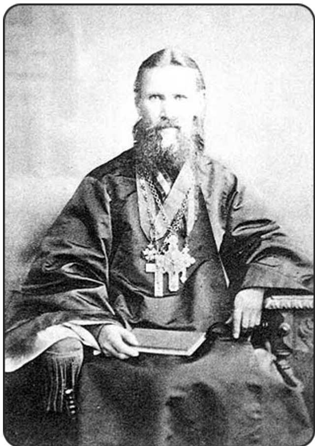
Άγιος Ιωάννης Κροστάνδης