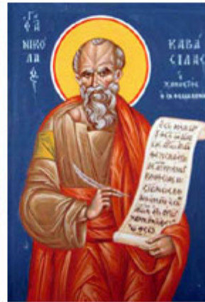
ΑΓ. ΝΙΚΟΛΑΟC ΚΑΡΑCΙΑΑC 20 Ιουνίου