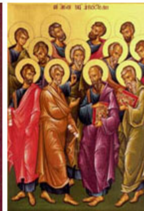
CΥΝΑΞΙC 12 ΑΠΟCΤΟΛΩΝ 30 Ιουνίου