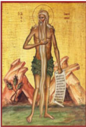
ΟCΙΟC ΟΝΟΥΦΡΙΟC 12 Ιουνίου