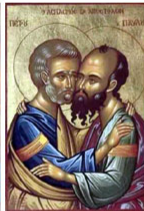
ΑΓ. ΠΕΤΡΟC & ΠΑΥΛΟC 29 Ιουνίου