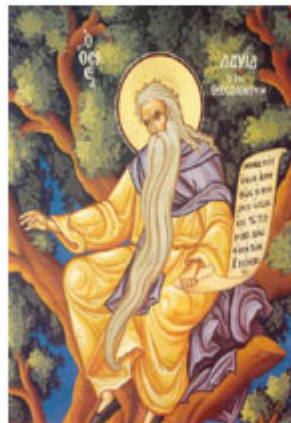
ΟC ΔΑΒΙΔ ΕΝ ΘΕCΣΣΑΛΟΝΙΚΗ 26 Ιουνίου