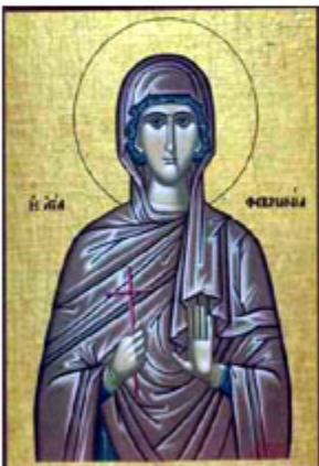
ΟCΙΟΜΑΡΤΥC ΦΕΡΩΝΙΑ 25 Ιουνίου