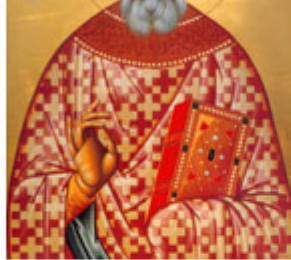
ΟC ΠΑΝΑΓΙΩΤΗΣ ΗΠΑΓΙΩC 7 Ιουνίου