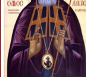
ΑΓ. ΛΟΥΚΑC Ο ΙΑΤΡΟC 11 Ιουνίου