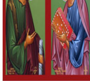
ΑΓ. ΒΑΡΘΟΛΟΜΑΙΟC & ΒΑΡΝΑΒΑC 11 Ιουνίου