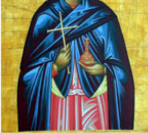
ΜΑΡΘΑ & ΜΑΡΙΑ 4 Ιουνίου