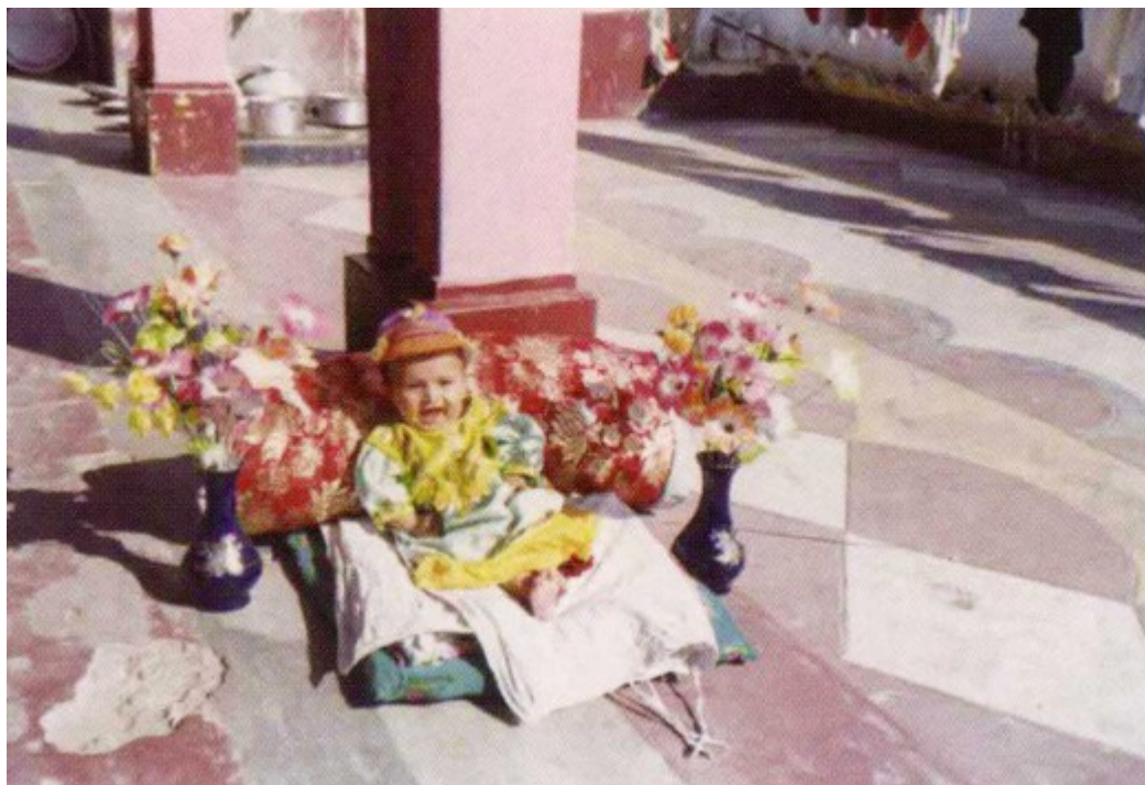
Η Μαλάλα μωρό