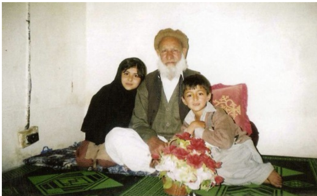
Με τον παππού της

«Το να φοράς μπούρκα είναι σαν να περπατάς σκεπασμένη με ένα μεγάλο υφασμάτινο κλουβί με μονάχα μια γρίλια για να βλέπεις, ενώ τις μέρες που έχει καύσωνα η μπούρκα είναι ζεστή σαν φούρνος. Εγώ τουλάχιστον δε χρειάστηκε να φορέσω ποτέ. Ο Πατέρας μου είπε ότι οι Ταλιμπάν είχαν απαγορεύσει στις γυναίκες ακόμα και να γελάνε μεγαλόφωνα ή να φοράνε άσπρα παπούτσια, καθώς το άσπρο «ήταν ένα χρώμα που ανήκει στους άντρες». Γυναίκες κατέληγαν στη φυλακή και υποβάλλονταν σε βασανιστήρια μόνο και μόνο επειδή είχαν βαμμένα νύχια.»