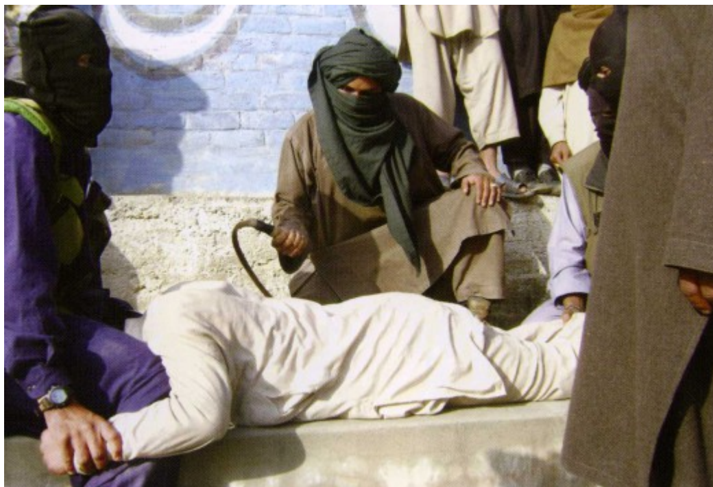
Δημόσια μαστίγωση από τους Ταλιμπάν

παραδοσιακό σαλβάζ καμίζ, κι επέμεναν ότι οι γυναίκες πρέπει να 'χουν το κεφάλι τους καλυμμένο. Ήταν θαρρείς και ήθελαν να διαγράψουν κάθε ίχνος γυναικείας παρουσίας από τον δημόσιο βίο.»