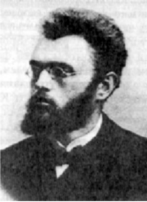
Άγιος Λουκάς Αρχιεπίσκοπος Συμφερούπολεως και Κριμαίας