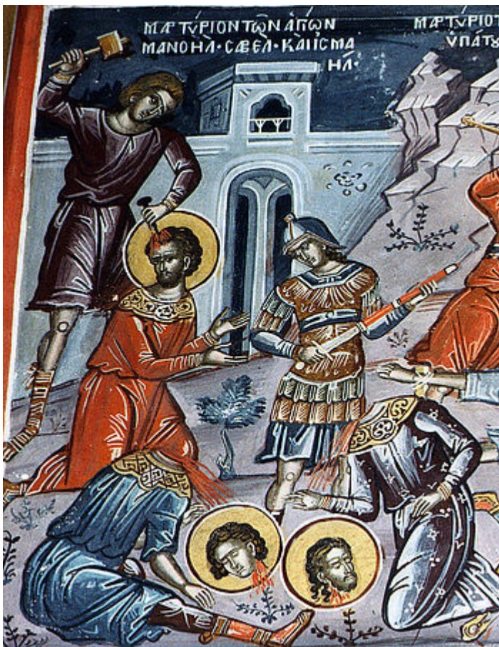
Ἅγιοι Μανουήλ, Σαβέλ και Ισμαήλ