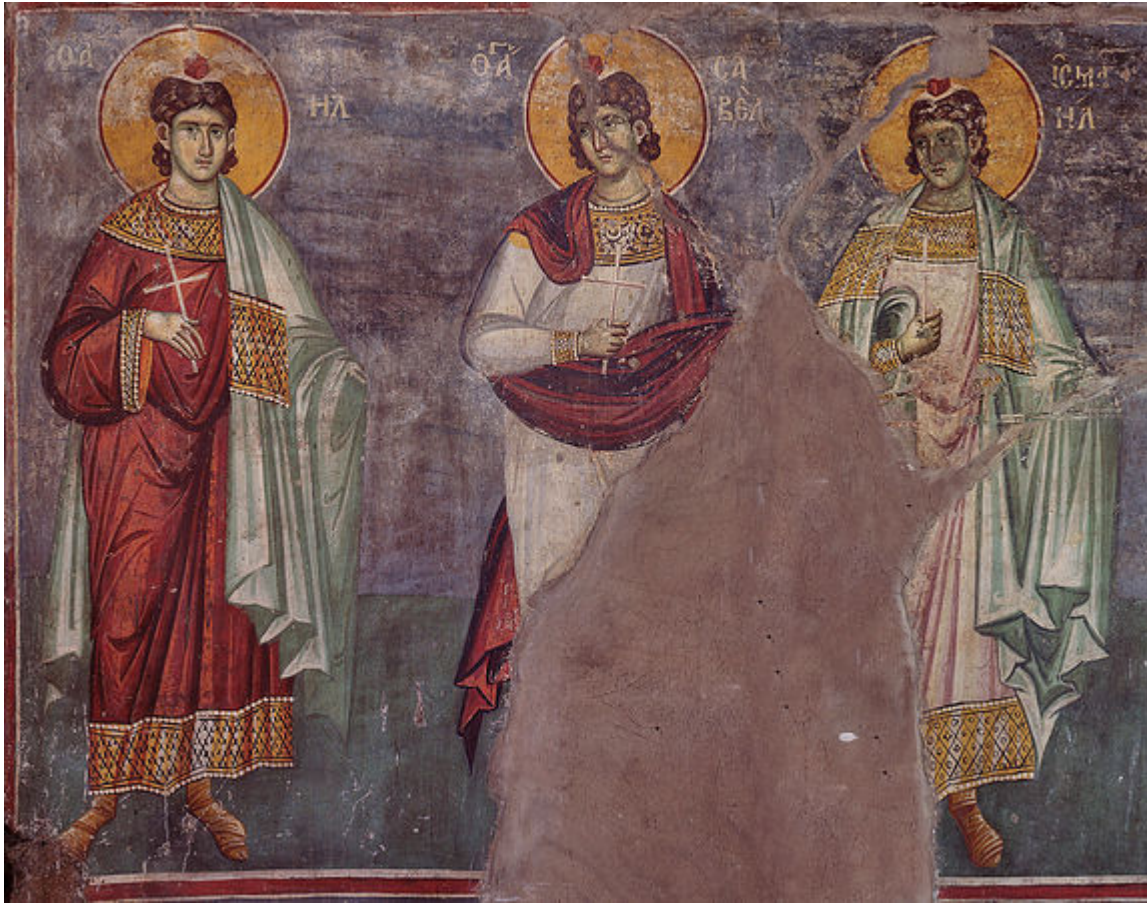
Άγιοι Μανουήλ, Σαβέλ και Ισμαήλ