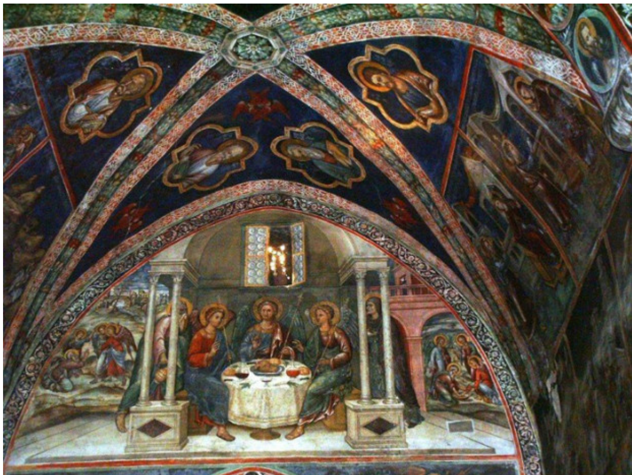
Η φιλοξενία του Αβραάμ, Ιερά Μονή Οσίου Ιωάννου του Λαμπαδιστή, Καλοπαναγιώτης