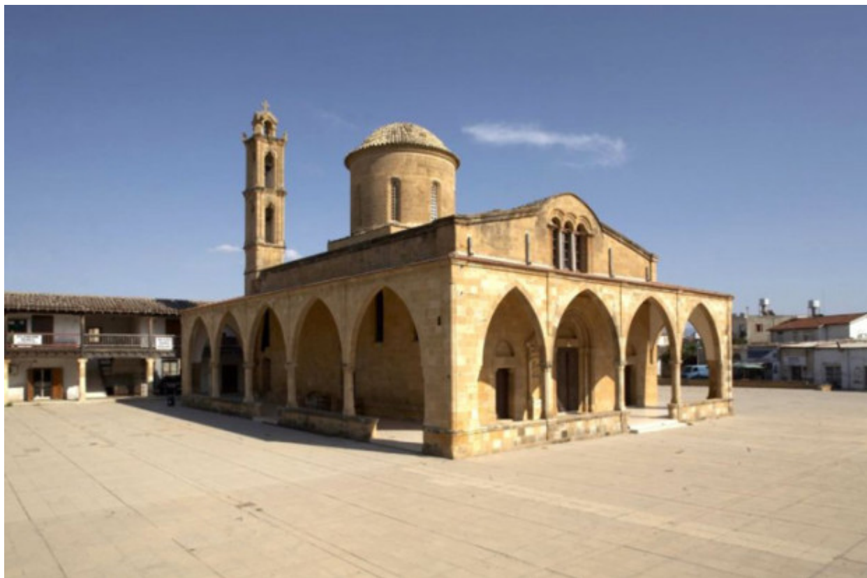
Ιερός Ναός Αγίου Μάμαντος, κατεχόμενη Μόρφου