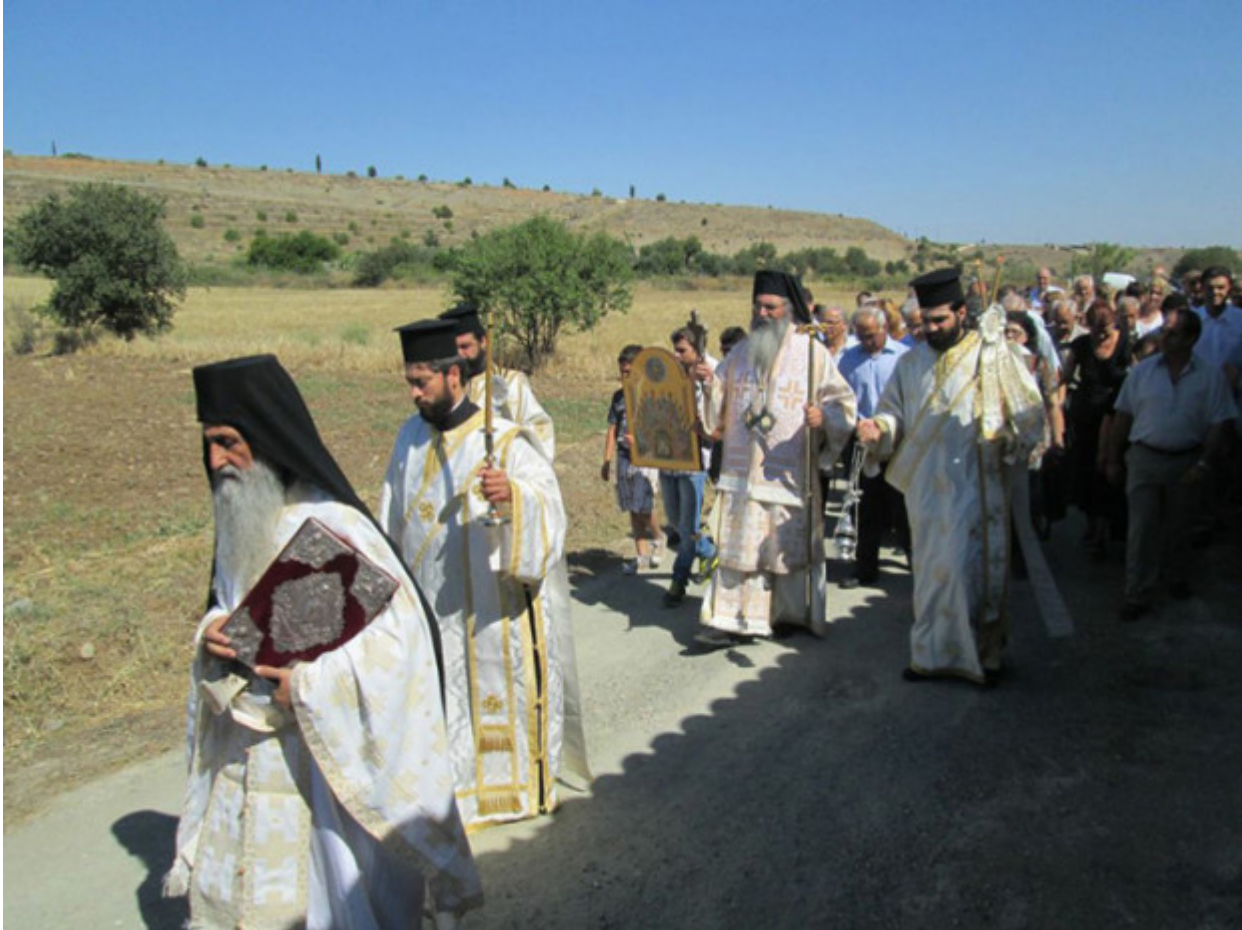
Εορτή Αγίου Πνεύματος, Ιερά Μονή Αγίου Νικολάου παρά την Ορούντα