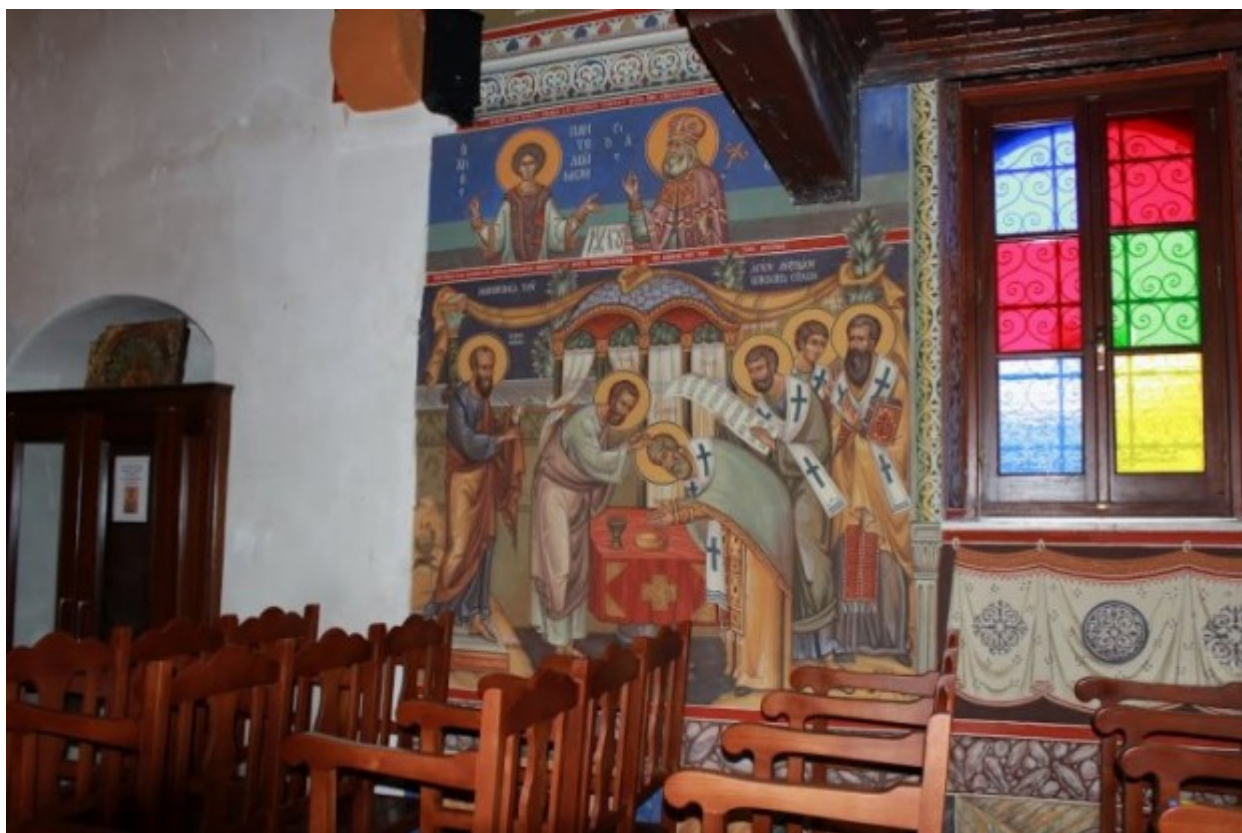
Η χειροτονία του Αγίου Αυξιβίου, Ιερός Ναός Αγίων Κυπριανού και Ιουστίνης, Μένικο