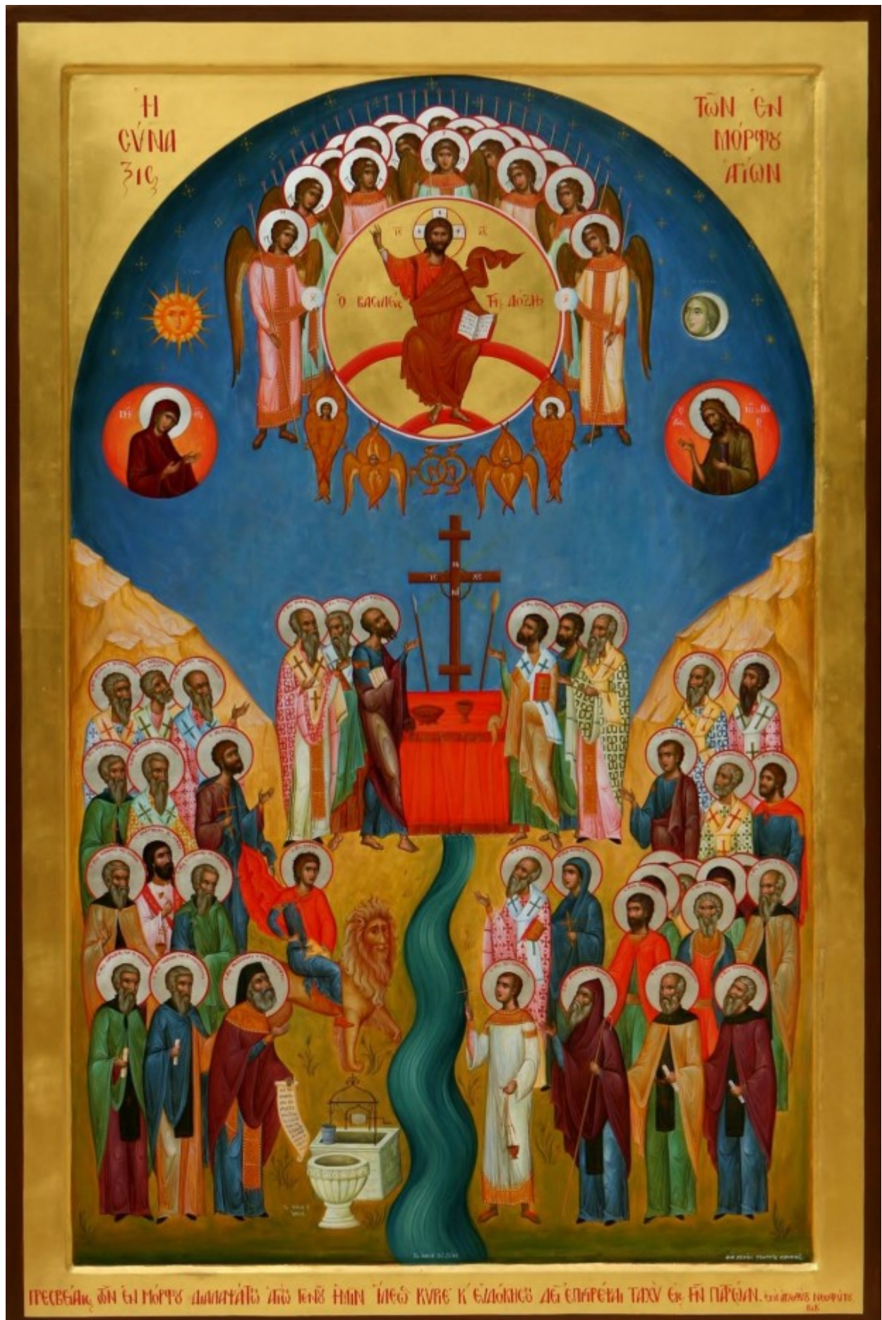
Η σύναξη των εν Μόρφου Αγίων, χειρ Γεωργίου Σταυρινού, 2012, Ιερά Μητρόπολις Μόρφου