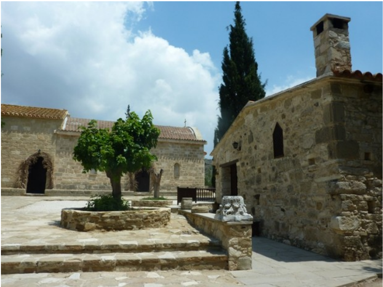
Close Hereλερά Μονή Αγίου Γεωργίου Μαυροβουνίου

Αυτά τα ολίγα είδε κι έγραψε η πένα κι ο φακός, που άλλοτε γινόταν κούλος κι άλλοτε κυρτός, άλλοτε θόλωνε κι άλλοτε γινόταν ...μεγεθυντικός! Εις το επανιδειν, καί τῷ Θεῷ δόξα!