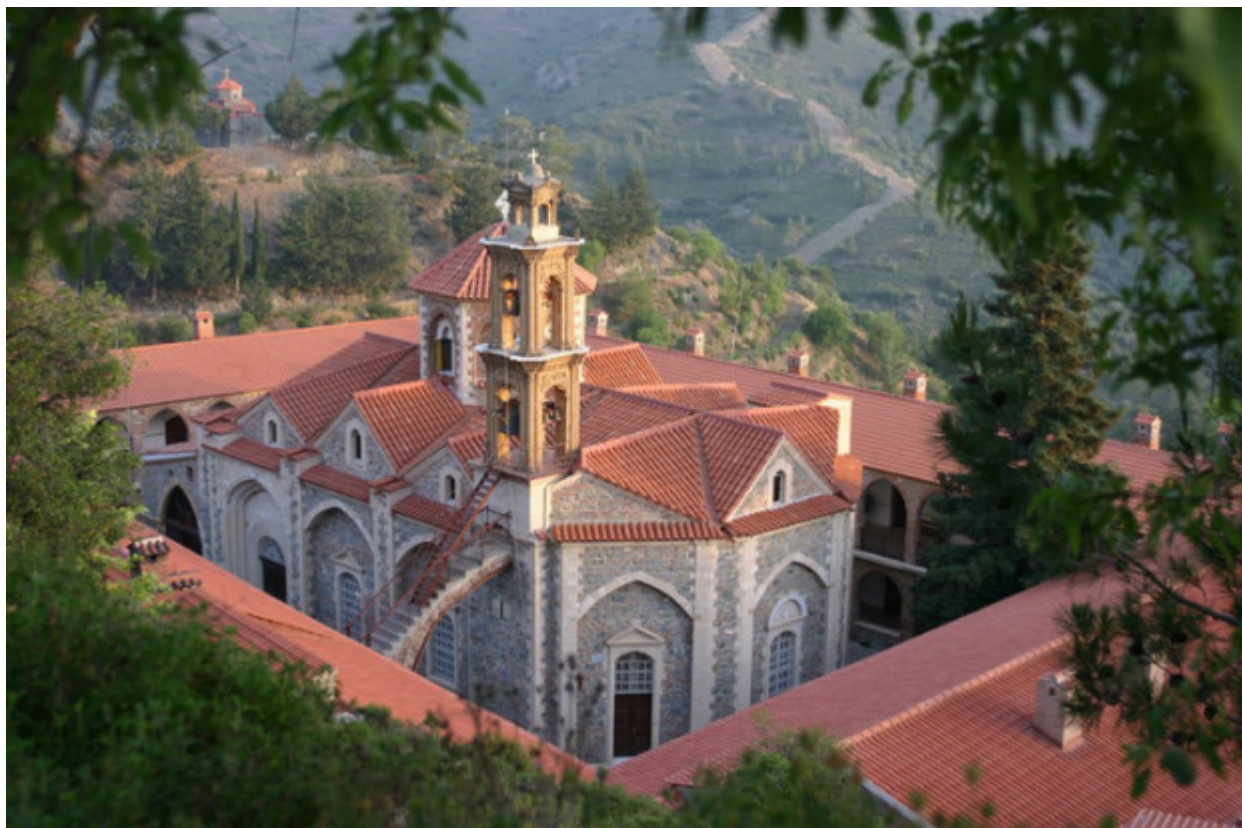
Ιερά Μονή Παναγίας Μαχαιρά