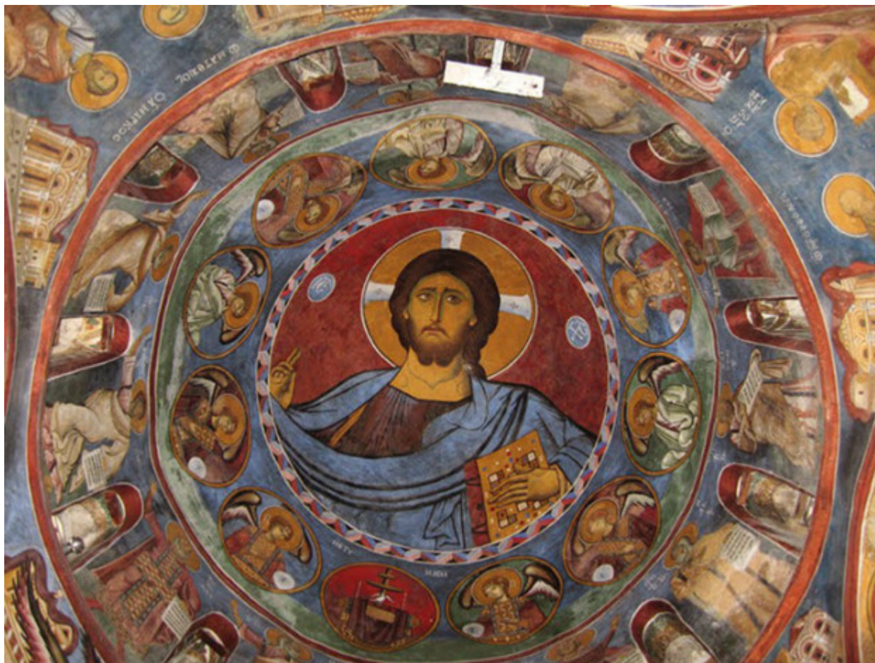
Ο Παντοκράτορας, Ιερά Μονή Παναγίας του Αρακα, Λαγουδερά